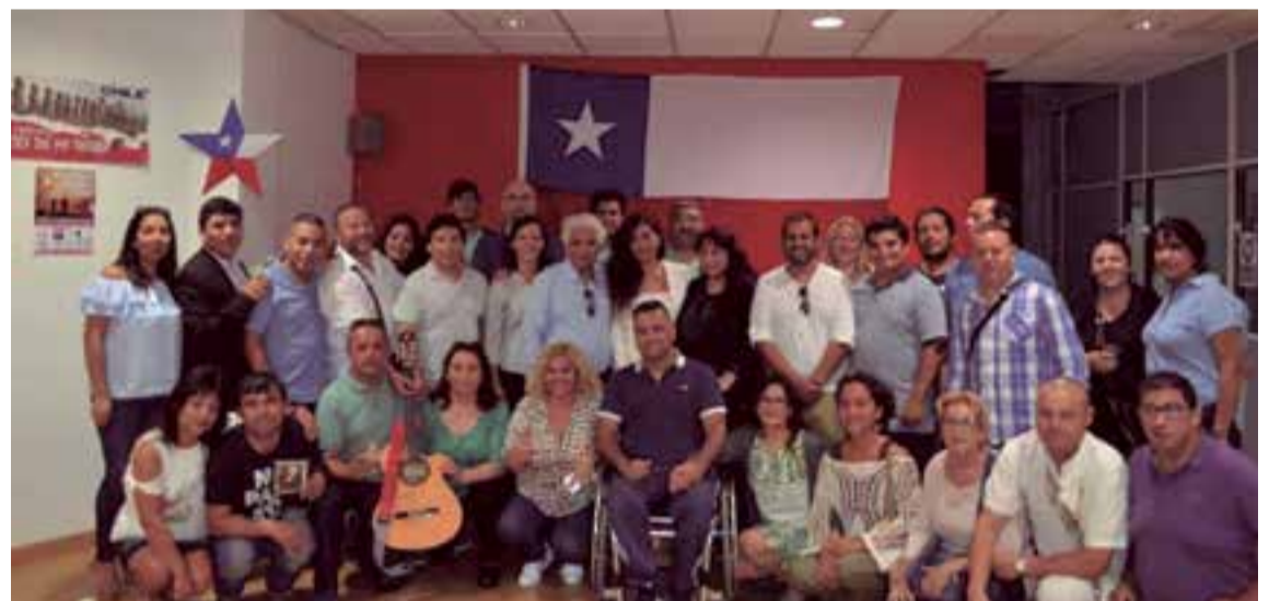
La comunidad chilena de las Islas asciende a unos cinco mil residentes (Foto de archivo)