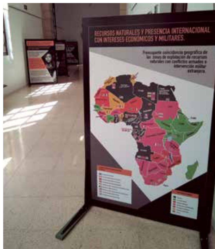
Exposición de la asociación cultural ONGD Thakhi-runu en el edificio Sa Riera de la Universitat de les Illes Balears.

Caminando en esa ruta la exposición infográfica L’OVELLA NEGRA JA NO ÉS UN BLANC PERFECTE, que actualmente se exhibe en el edificio Sa Riera de la UIB, intenta dar a conocer la manipulación que introduce en el imaginario social el odio y el rechazo principalmente hacia estas personas del África subsahariana abocadas a una diáspora en busca de un futuro digno para ellas y los suyos.