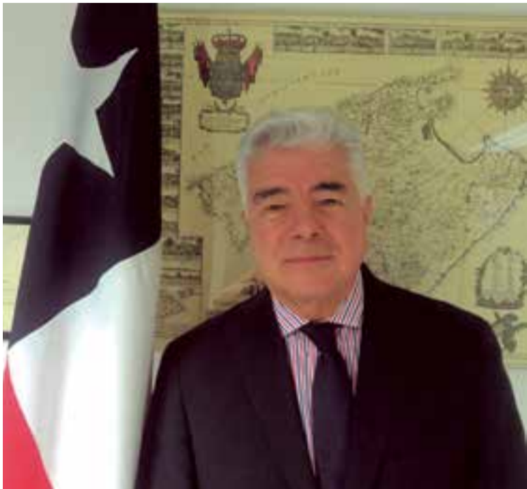
El cónsul general de Barcelona, Jaime Bascuñán.