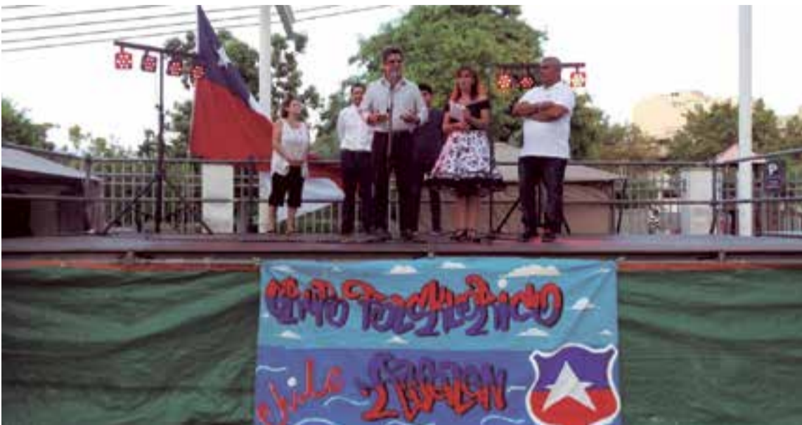
La celebración de las fiestas patrias chilenas fue organizada por la Asociación Folclórica Ayelén