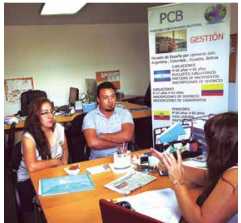
Dos usuarios de los servicios de PCB Tramitaciones

entre ellos, arraigos, renovaciones, reagrupaciones y permisos de trabajo. Por otra parte, por estos días han ido en aumento los solicitantes que prefieren acudir a una asesoría profesional para los solicitantes de la nacionalidad española.