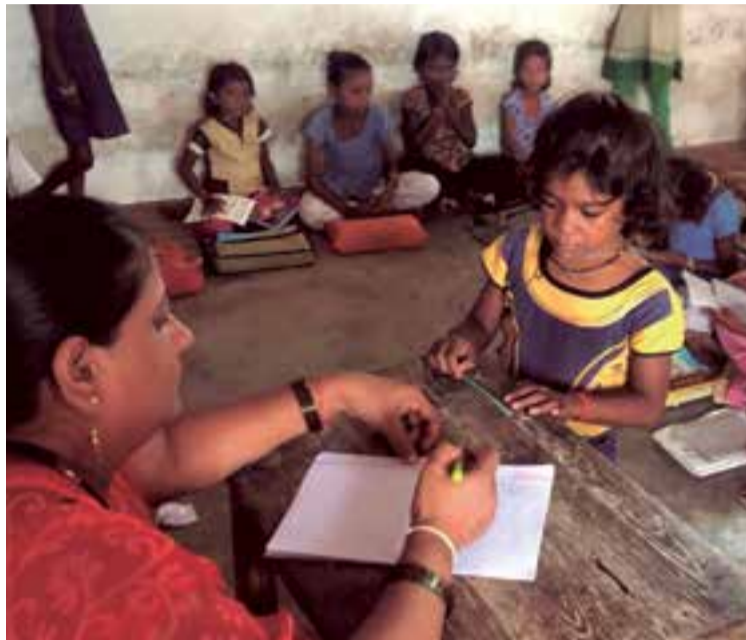
Los niños en situación de extrema pobreza pueden acceder a la escuela gracias a las ayudas.

Para él siempre ha constituido un noble motivo ayudar a los pequeños en países en los que escasea