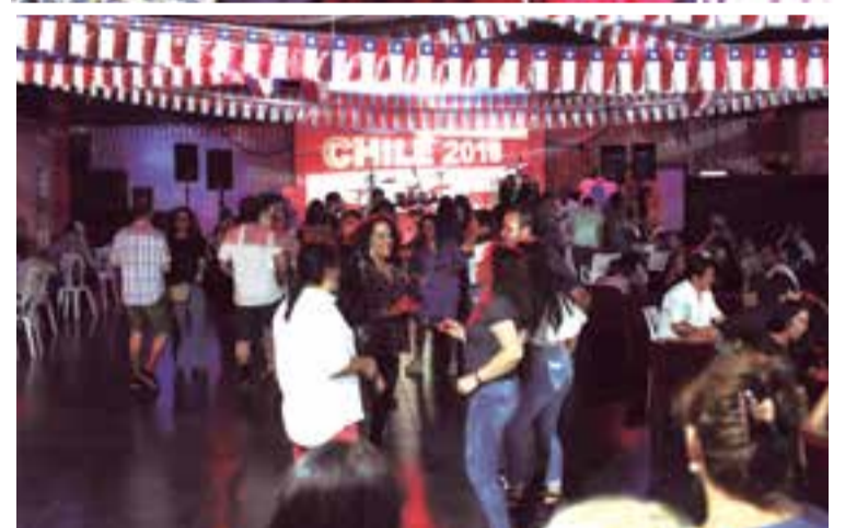
El evento reunió a más de 500 personas en la Sala Oshum