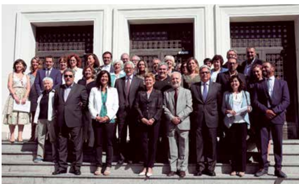
Imagen de los participantes en la firma del convenio de cooperación institucional contra los delitos de odio