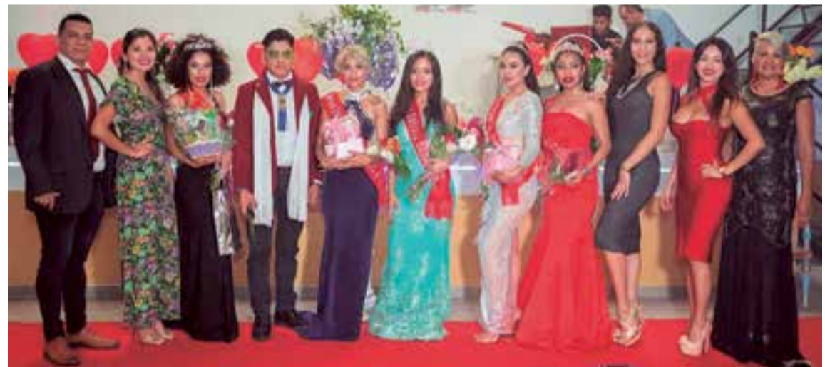
Las reinas y el jurado del concurso de Miss Bolivia 2018