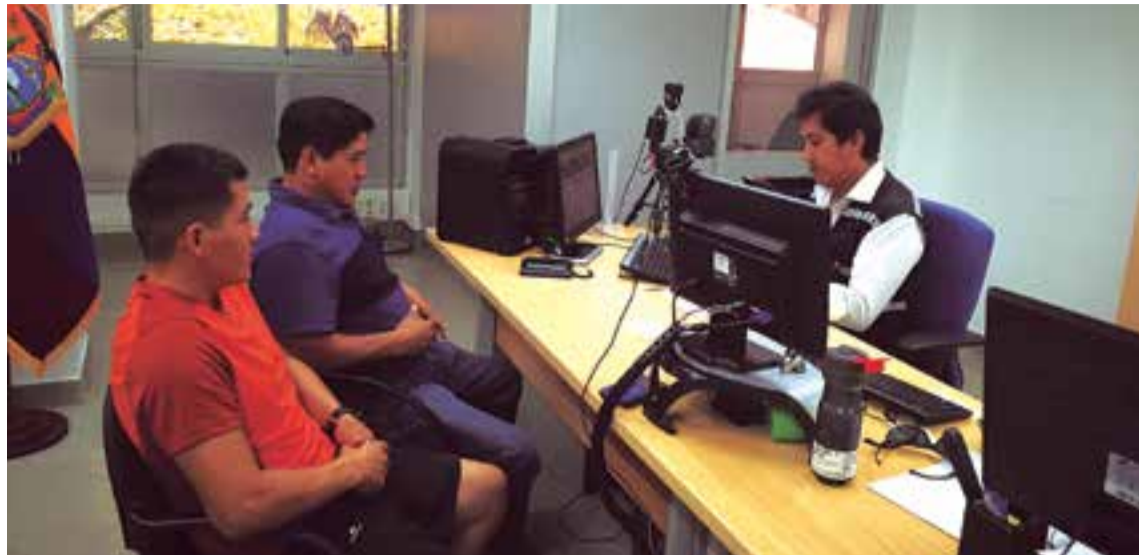
Dos usuarios del consulado atendidos por uno de los funcionarios en la sede de la Avenida Alemania de Palma