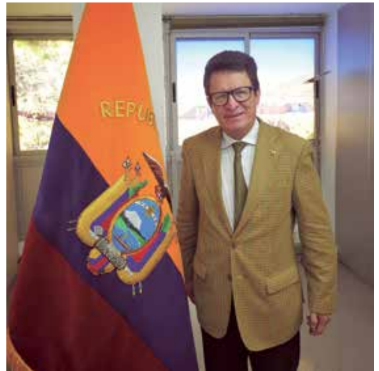
Cristóbal Roldan, Embajador de Ecuador en España

¿Con qué grupo han iniciado conversaciones?