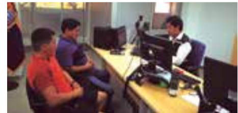
Editorial, Págs. 7, 8 y 9