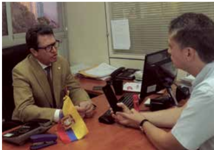
Entrevista de BSF con el Embajador, de Ecuador en España, Cristóbal Roldan