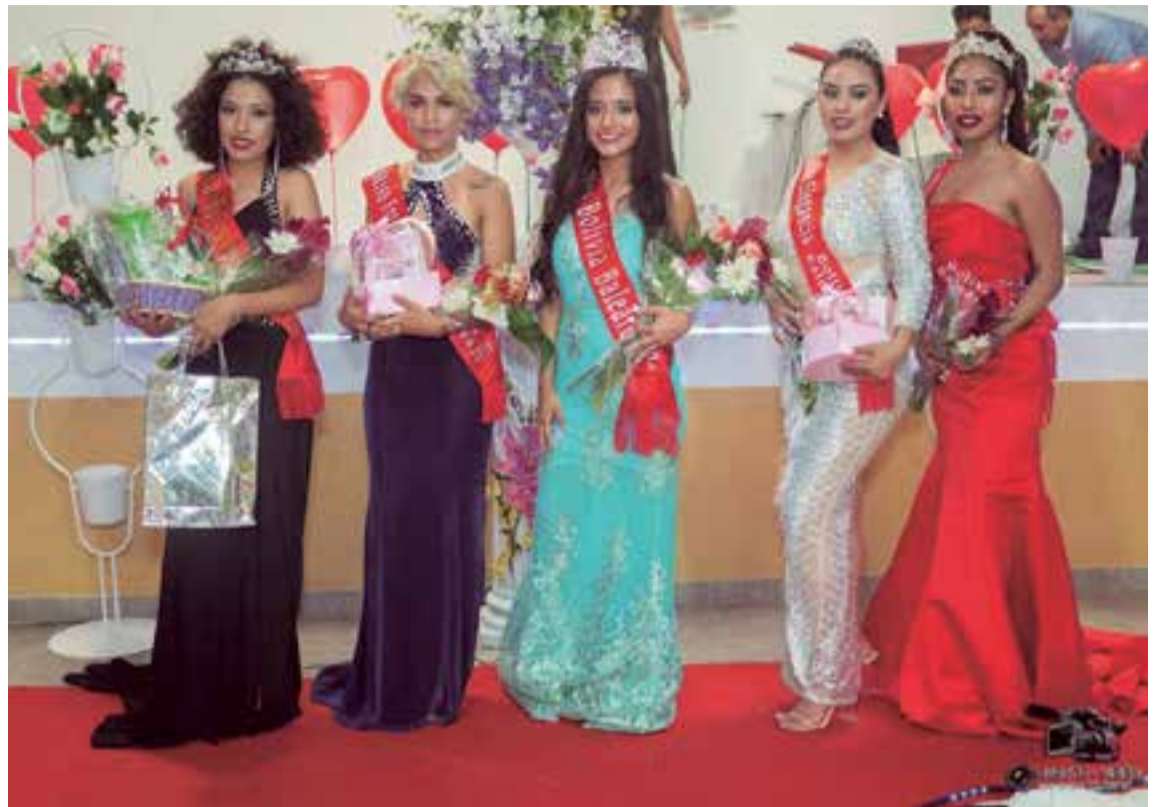
El vestuario de las reinas corrió a cargo de Moda Luz Mallorca Gala.