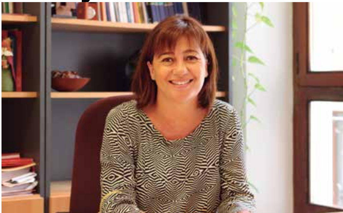
Francina Armengol, candidata del PSIB-PSOE al Govern balear, cuestiona las medidas sociales del actual equipo de gobierno y se compromete a restaurar la asistencia sanitaria desde la normalidad a los residentes en las Islas si su partido gobierna los siguientes cuatro años.