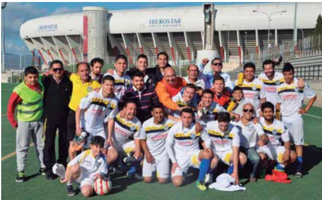
Después del partido que se enfrentó a Serralta no faltó la foto de familia a la que se sumaron aficionados y amigos