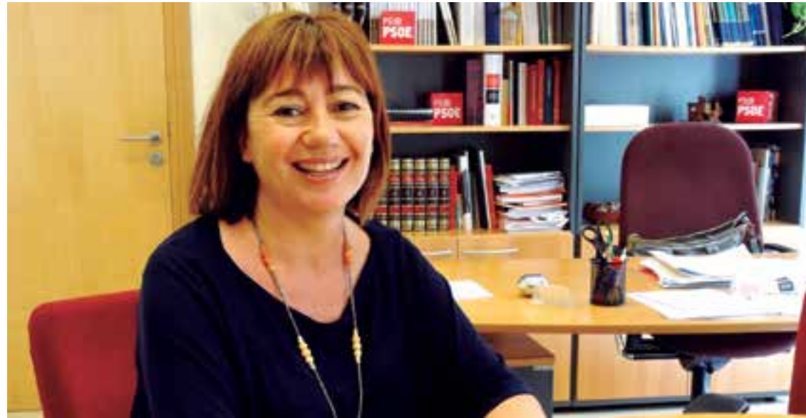
Francina Armengol, candidata a la presidencia del Govern balear

Baleares Sin Fronteras: Muchas son las propuestas para ser Presidenta de esta Comunidad Autónoma,