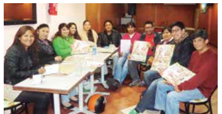
Comité organizador de actividades bolivianas, a la cabeza del grupo Sentimiento Chaqueño.

De hecho, recuerdan la participación de danzas de Bolivia en Sa Rúa de Palma, Calviá, Manacor, Inca y Lluçmajor, entre otros municipios de la Isla ●