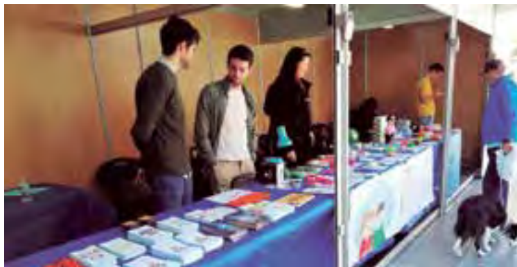
Durante la jornada para conocer los derechos de los consumidores