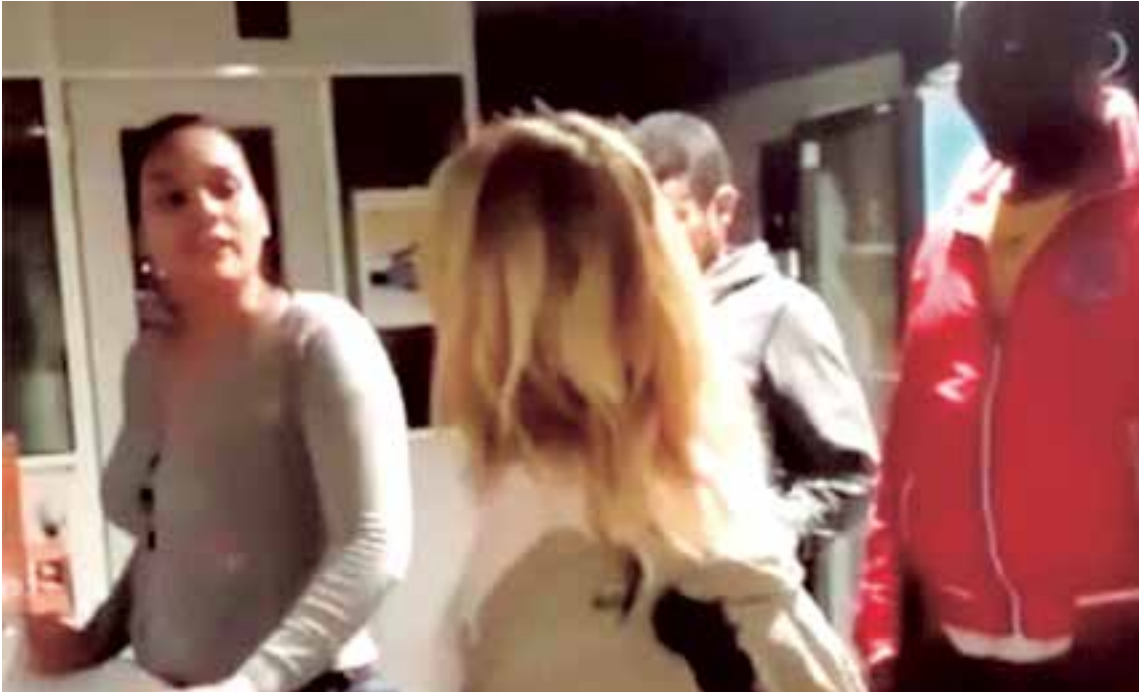
Imagen del vídeo grabado que muestra a una mujer española discute con una migrante en un locutorio de Valencia.

El lamentable caso de racismo en Valencia y análisis de algunas razones que han generado un repunte racista en España