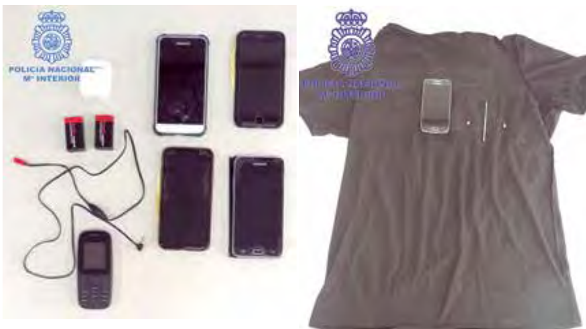
Algunos de los elementos probatorios confiscados por la Policía Nacional