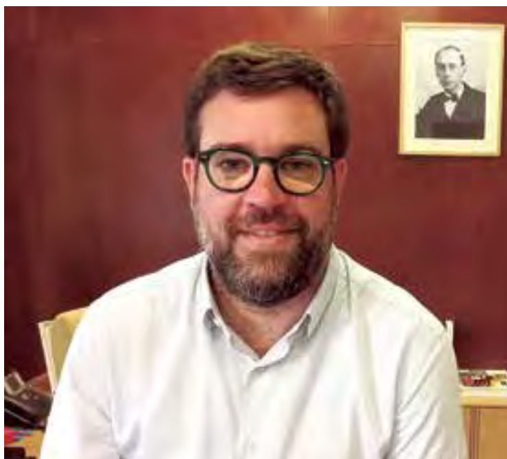
Antoni Noguera, Alcalde de Palma