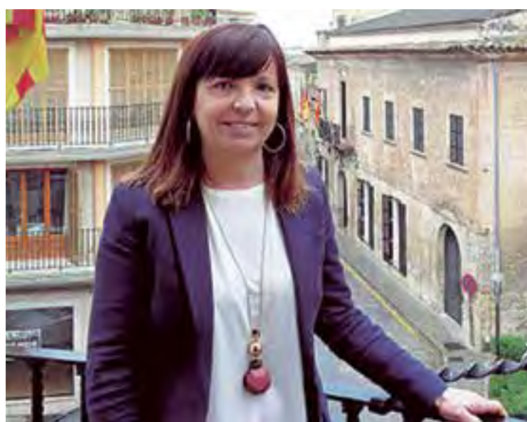
La Alcaldesa de Manacor, Catalina Riera

No obstante, el alcalde reconoce que más allá de la situación de que un inmigrante tenga o no papeles, el ayuntamiento no puede dar la espalda a las familias que se vean en situaciones de emergencia y siempre estará atento para suplir cualquier tema de extrema gravedad o que requiera atención básica.