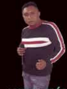
ANIMACIÓN PATO MIX