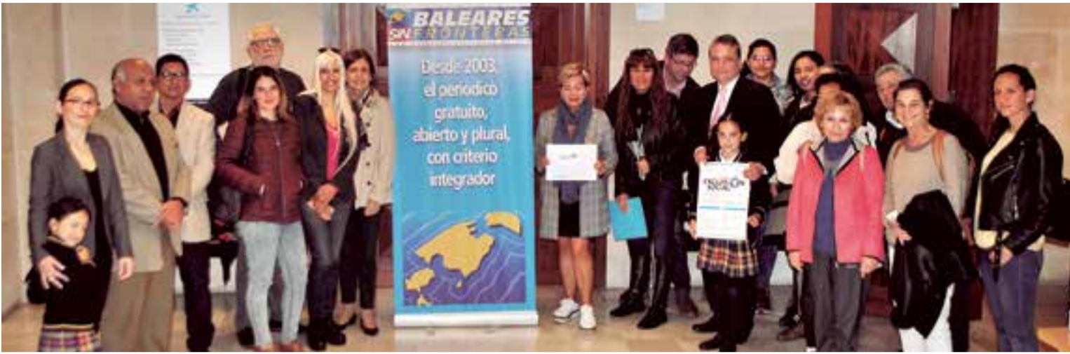
Una parte del público no quiso pasar desapercibido al final de la jornada en el CaixaForum de Palma