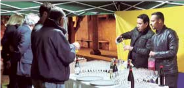
Se ofreció un ágape a los invitados al final del largometraje Mateo