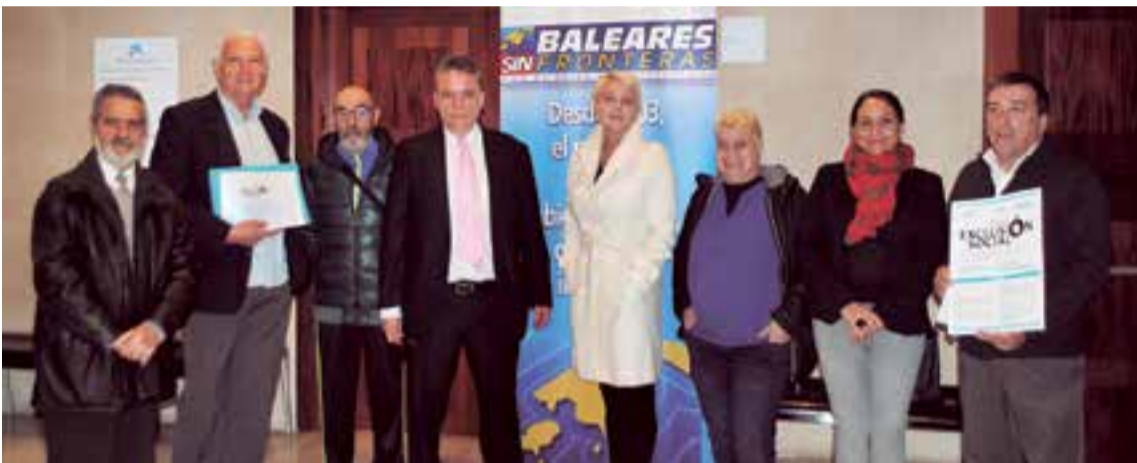
Los integrantes del partido político asistentes estuvieron en el foro atentos a las ponencias