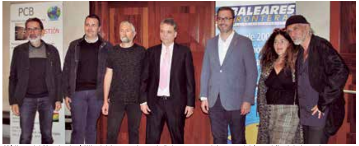
Médicos del Mundo, José Hila del Ayuntamiento de Palma con participantes del foro al final de la tarde