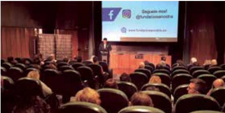
Asistencia nutrida a los ciclos de cine en el Centro Cultural sa Nostra