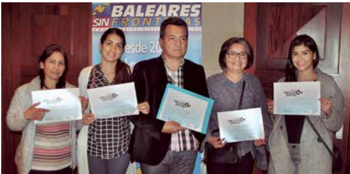
Algunos de los asistentes posando para la foto con el certificado de asistencia al Foro de Exclusión Social