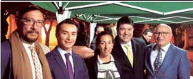
El equipo del Consulado de Colombia satisfecho por la iniciativa social de cine