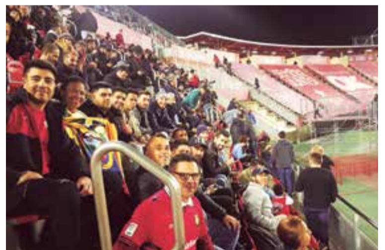
Integrantes de la plantilla del BSF FC acompañando al Real Mallorca en Son Moix en el partido que venció 3-0 al Real Zaragoza