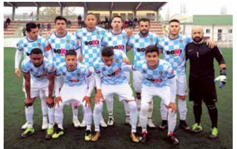
Una de las últimas formaciones habituales de Baleares Sin Fronteras FC