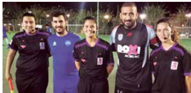
Buena actuación del trio arbitral en el Polideportivo de Son Moix

Un partido muy completo, con mucha posesión y con las cosas claras. El encuentro también dejó dos noticias más: el debut del portero italiano Gioele Tabarelli y del defensa colombiano