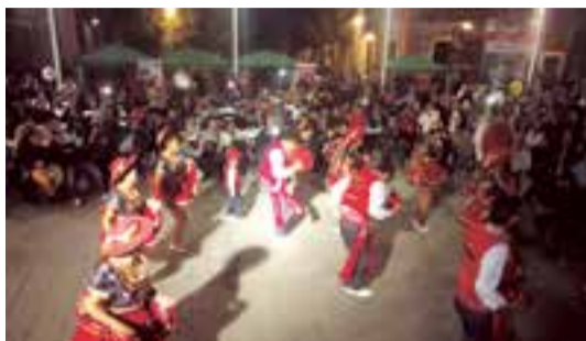
Dos imágenes de las jornadas multiculturales realizadas al conmemorarse el 15º aniversario de Baleares Sin Fronteras.