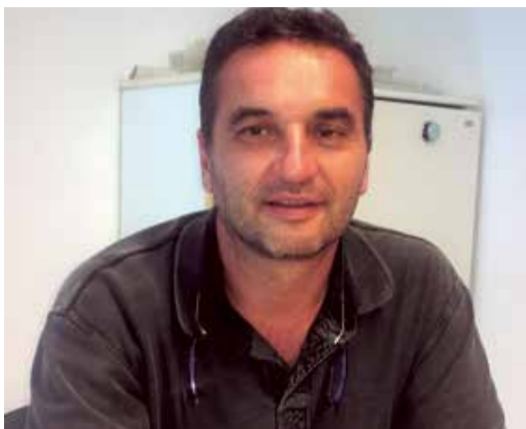
Tomeu Cifre Ochogavía, Alcalde de Pollença

A pesar de llevar cuatro años fuera de la alcaldía, nunca pensó en tirar la toalla. Políticamente jamás se sintió derrotado, aunque reconoce que estar en un partido independiente no deja de ser complejo, concretamente a la hora de los pactos