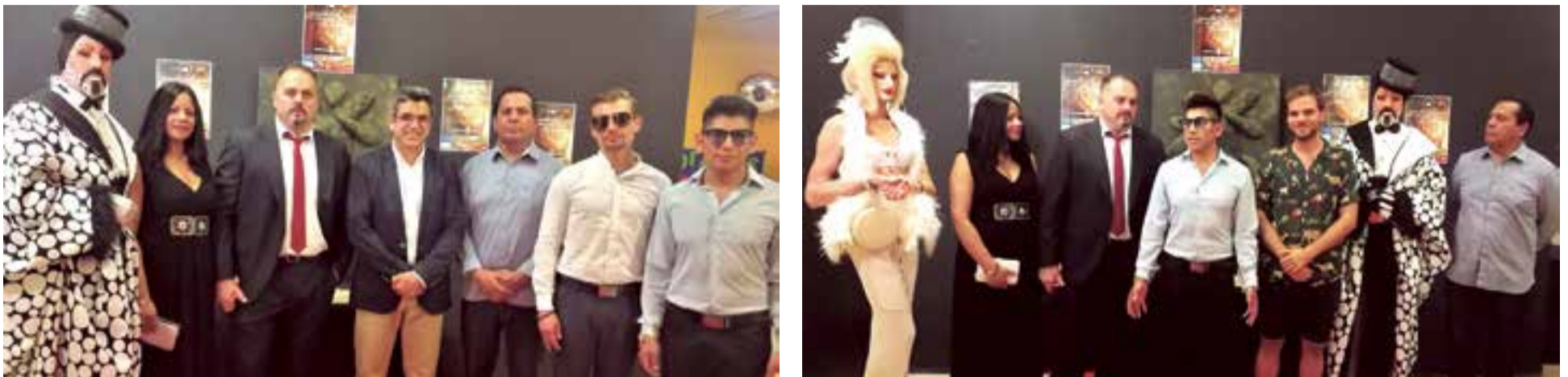
Asistentes de diversas entidades sociales y representantes políticos durante el acto de presentación, en el Centro Cultural Flassaders, de la primera asociación multicultural LGTB que organizó una exposición de arte a beneficio de ALAS (asociación de lucha contra el SIDA).

Desde la entidad consideran que existen prejuicios injustificados y temores infundados hacia el colectivo