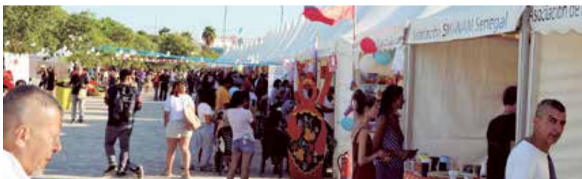
Los stands de las distintas asociaciones culturales recibieron una muy positiva acogida del numeroso público visitante