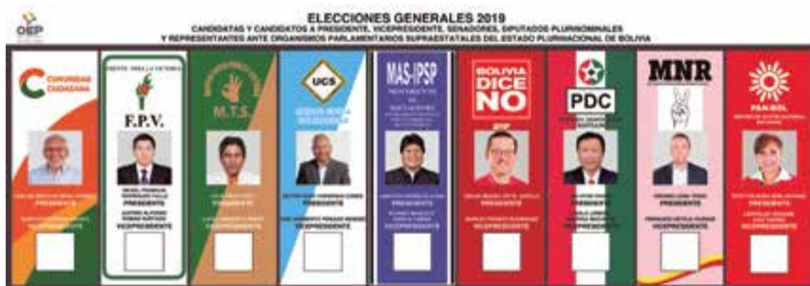
Facsimil con imágenes de los candidatos presidenciales a las elecciones generales 2019 en Bolivia.