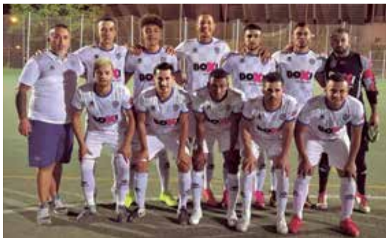
Equipo inicialista que derrotó 5-0 al Binissalem

El equipo suma quince puntos producto de cuatro victorias, tres empates y una derrota