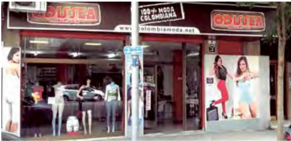
Fachada del local de Odissea Modas en la calle Antoni Marqués 22, casi Blanquerna.