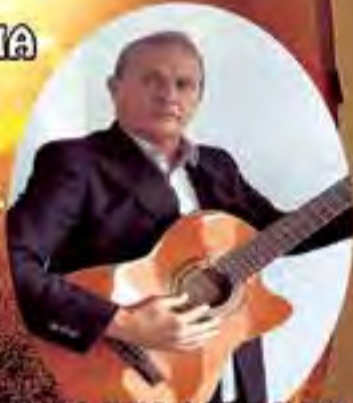
EL POPULAR ZORRO