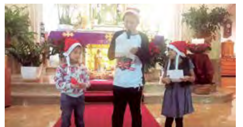
Entusiasmo y alegría de las niñas durante la lectura de algunos fragmentos de las novenas celebradas la parroquia de la Asunción de Palma

Al finalizar 2019 queremos dar muchas gracias a todos nuestros clientes por creer en las bondades de la deliciosa cocina ecuatoriana.