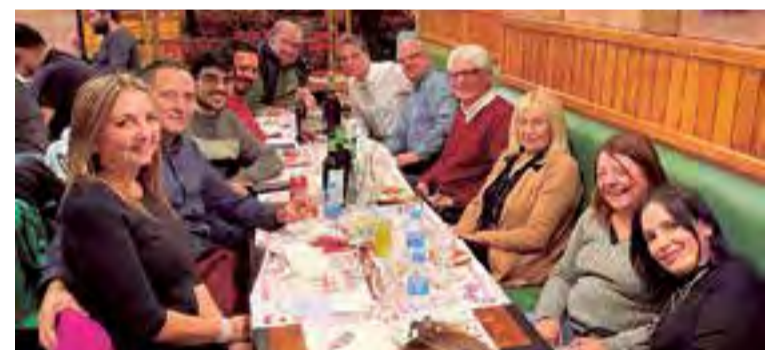
Integrantes, colaboradores e invitados a la comida de este periódico

La velada tuvo lugar en Pizza Industria de Joan Miró ●