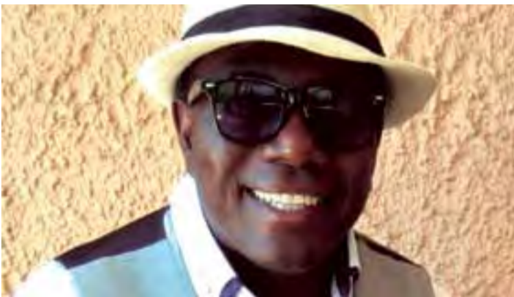
El Negrito de la Salsa