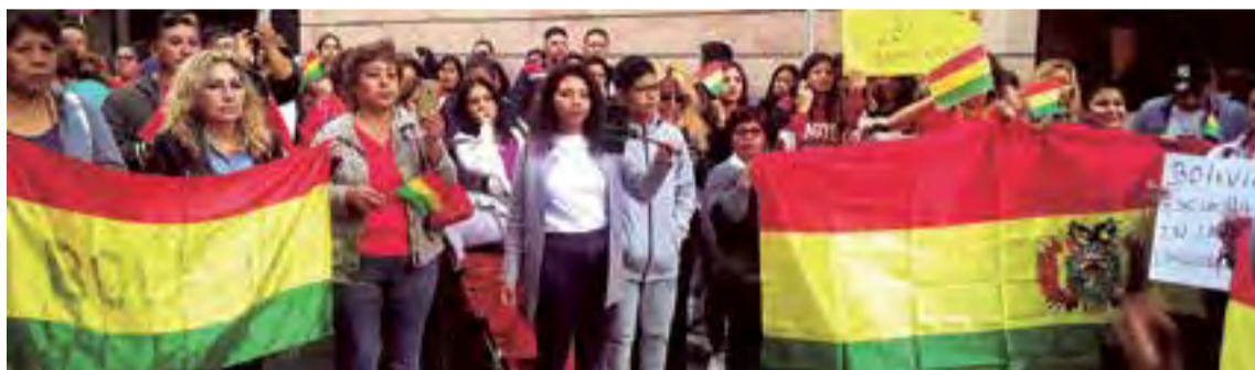
(Dos fotos superiores, de archivo) Manifestación de seguidores de Evo Morales en Palma el pasado 17 de noviembre realizada en el Parque de las Estaciones. En octubre de este año, a las puertas del viceconsulado de Bolivia en Palma antes de que se cerrara, manifestantes detractores del ex presidente Morales denunciaban fraude en las elecciones de su país (foto inferior).

tarea de “pacificación” del país, donde sigue habiendo protestas contra la presidenta interina Jeanine Áñez, si bien la intensidad y la cantidad de los conflictos están disminuyendo.