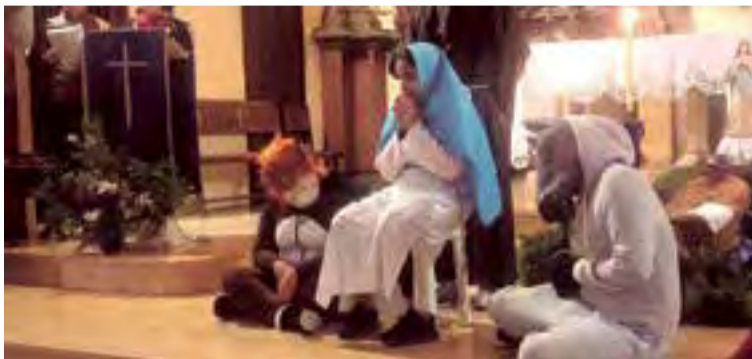
En la iglesia de los Capuchinos los ecuatorianos hicieron la novena al Divino Niño Jesús. Clave la participación del Consulado en la convocatoria