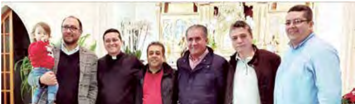
El poasaadoi 20 de diciembre en uno de las celebraciones de las novenas con parte del cuerpo consular de Colombia