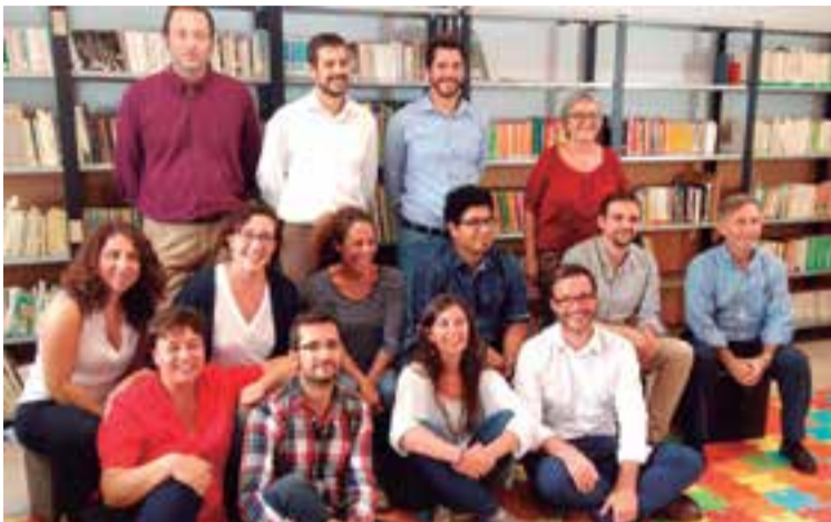
El equipo de gobierno del Ayuntamiento de Palma

Las áreas municipales empiezan a establecer sus prioridades para el año que viene