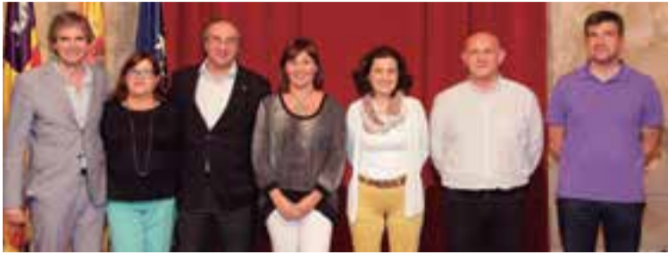
Integrantes de parte del equipo del Govern que sacó adelante la iniciativa