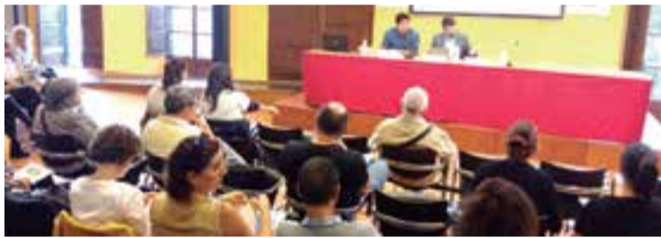
Jornada especial en Flassaders sobre el Día Internacional de la Gente Mayor

El alcalde ha avanzado que "nuestra intención es, año tras año, ir aumen-