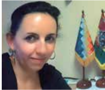
Maya Nemtala, Vicecónsul de Bolivia en Palma de Mallorca

Mallorca está compuesto por compatriotas de distintas regiones del país quienes representan la diversidad cultural de Bolivia y a través de fraternidades de