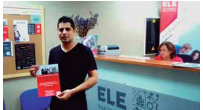
Un estudiante de ELE USAL Mallorca iniciando el curso de preparación

"Estudiantes de ELE USAL Mallorca en el curso de preparación del Diploma de Español como Lengua Extranjera (DELE) A2 al que van a presentarse el próximo 16 de octubre y de la prueba de conocimientos constitucionales y socioculturales de España (CCSE) que son requisitos legales para poder optar a la nacionalidad española. Del 9 al 13 de noviembre se celebrará un curso similar en ELE