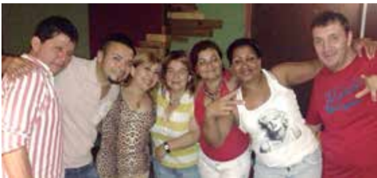
“La Islita” continúa sumando clientes y amigos