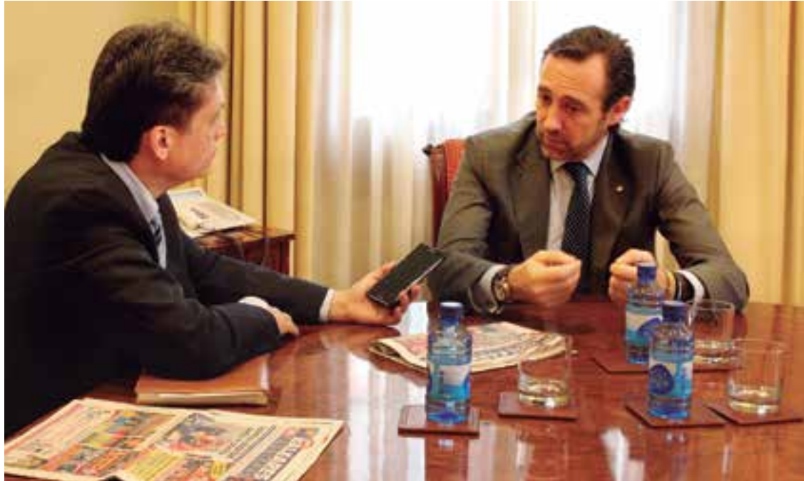
Durante la entrevista al Presidente Bauzá, también candidato por el PP a repetir gobierno en la próxima legislatura

J.R.B: Es absolutamente falso. Ninguna persona en los casos que nos determina la ley se ha quedado sin ser atendida. Las mujeres embarazadas y niños han sido atendidos siempre. Y no voy a dejar de obviar una desgraciada situación que fue el fallecimiento de una persona, cuya situación en su momento fue denunciada. La justicia al final dijo que dicha denuncia tenía un sesgo e intención política de fondo y se ha determinado que la actua-