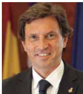
Mateo Isern, alcalde de Palma.

Mateo Isern ha señalado que “la información publicada sigue la línea de lo que vienen señalando otros medios de comunicación internacionales de reconocido prestigio que valoran positivamente el cambio que ha experimentado Palma en los últimos