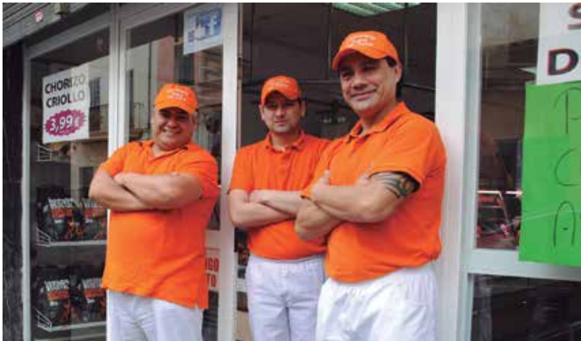
El equipo de trabajo de Ca'n Dante en la fachada de la carnicería