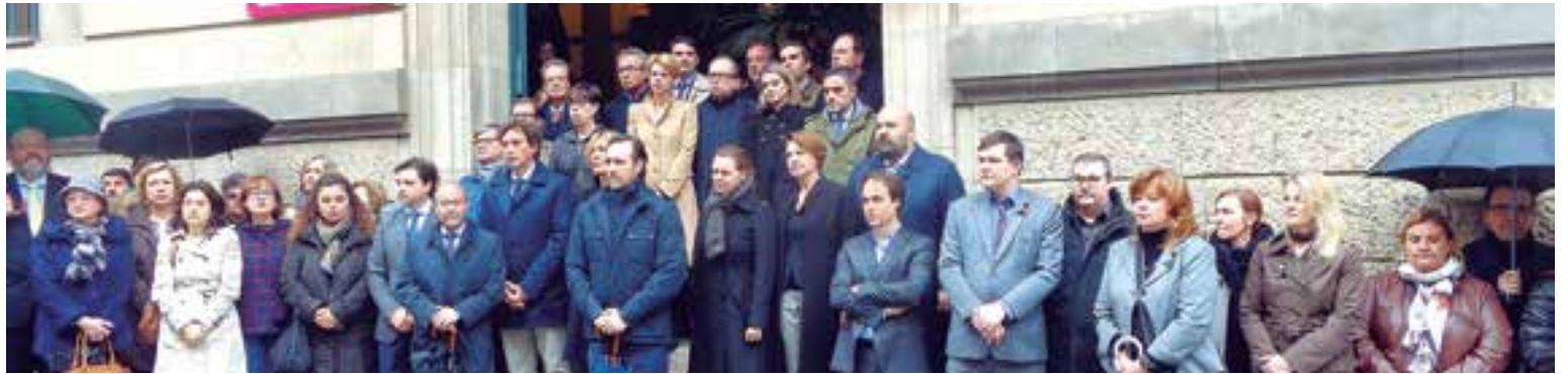
Las autoridades de Baleares en un minuto de silencio por los fallecidos del avión siniestrado.

La delegada ha recordado que el Gobierno de España ha puesto a disposición de las autoridades francesas los equipos de rescate y policía científica de las Fuerzas y Cuerpos de Seguridad del Estado, y que se han decretado tres días de luto oficial, “por lo que hemos suspendido la agenda pública prevista en señal de duelo y respeto a las víctimas”.