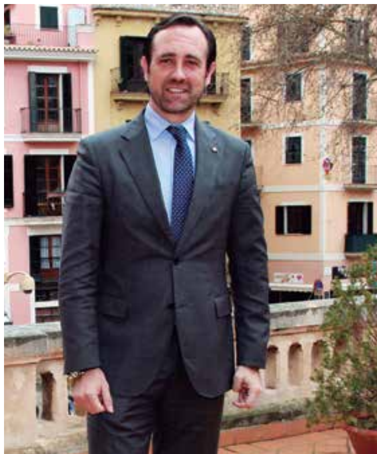
José Ramón Bauzá, Presidente del Govern balear en el balcón de su despacho

deuda pública de más de siete mil millones de euros, y usted afirma que los problemas económicos se han superado