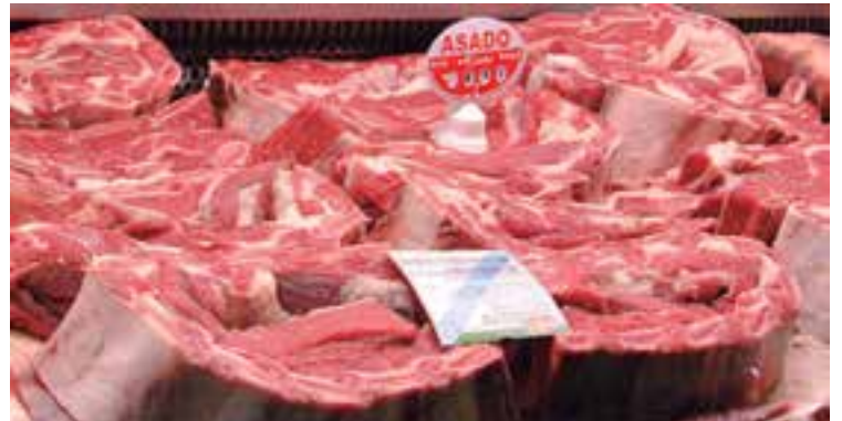
Tanto la calidad de las instalaciones como del servicio y de sus productos hacen que cada día Ca'n Dante sume más clientes plenamente satisfechos.