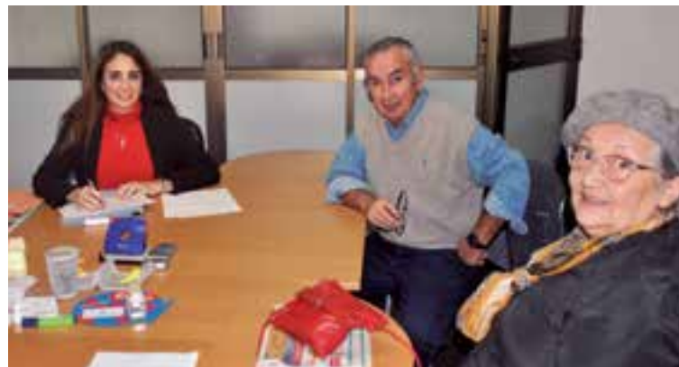
Una pareja de argentinos reciben asesoría en la última vi

Una gran cantidad de ciudadanos que se benefician de los convenios de reciprocidad se están acercando a la edad de jubilación y les interesa informarse sobre todos los trámites a seguir y los requisitos burocráticos al momento de comenzar a gestionar los papeles, que dicho sea, no es tan fácil como inicialmente se piensa, y máxime si no se cuenta con una empresa experta en este ámbito y el interesado se encuentra lejos del país