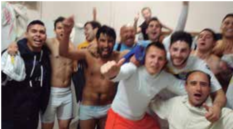
Algarabía en el vestuario por el último triunfo frente al Bunyola, 1-3

Los locales urgidos de tres puntos vitales para recuperar puestos en la clasificación