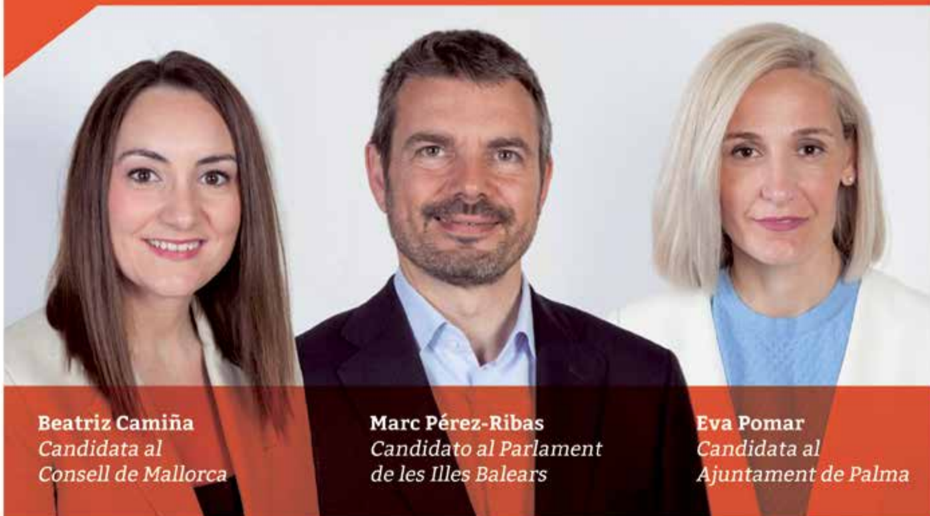
Beatriz Camiña Candidata al Consell de Mallorca