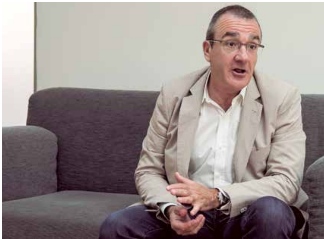
Juan Pedro Yllanes, candidato de Unidas Podemos al Govern Balear

JPY: Hablamos de temas trascendentales como la vivienda, renta social garantizada, territorio, medio ambiente y otros problemas que afectan a la cotidianidad de quienes viven en la Comunidad Autónoma de Baleares.