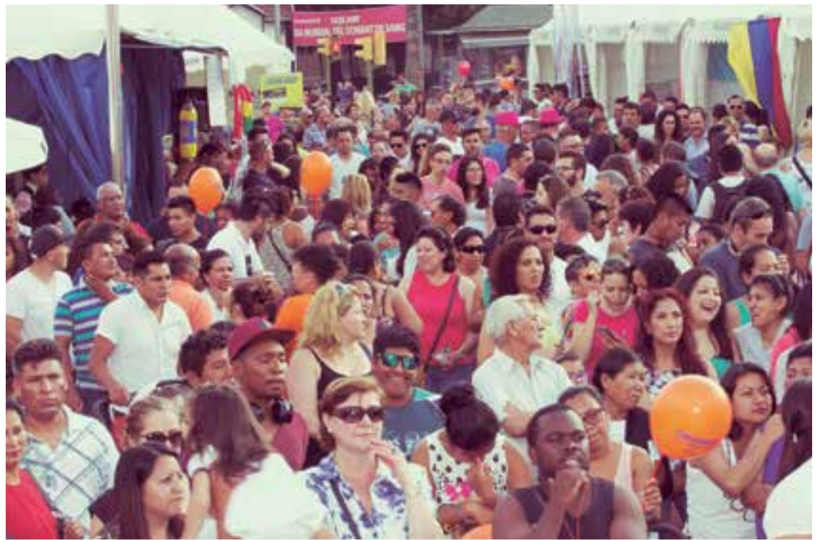
Así luce la feria en los momentos de masivas visitas de residentes y turistas a lo largo de estos ocho años