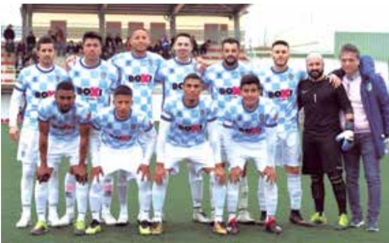
Baleares Sin Fronteras Fútbol Club en busca de asegurar la permanencia