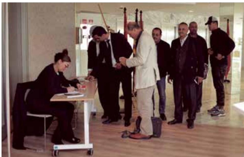
En los pasillos de eventos del Hotel Meliá, los marroquíes solicitan información

De la misma forma, es importante reseñar que durante esta visita se dieron a conocer los reglamentos jurídicos y judiciales relacionados con los problemas planteados en la quejas de los marroquíes residentes en España.