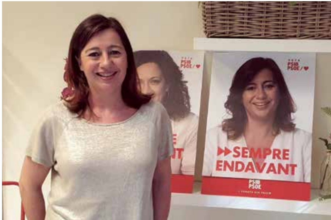
Francina Armengol, candidata por el PSIB-PSOE al Parlament de les Illes Balears

Para Armengol, la tendencia de los resultados de las elecciones generales se pueden repetir en Baleares. No hay que confiarse, pero cierto es -se enorgullece- que su partido obtuvo la mayor parte de