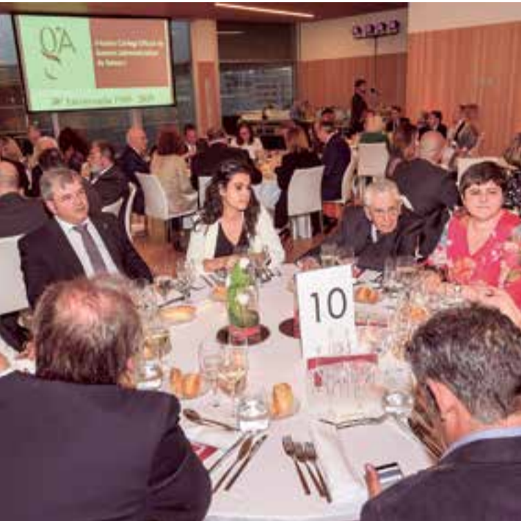
Cena de celebración del 50 aniversario del Colegio de Gestores Administrativos