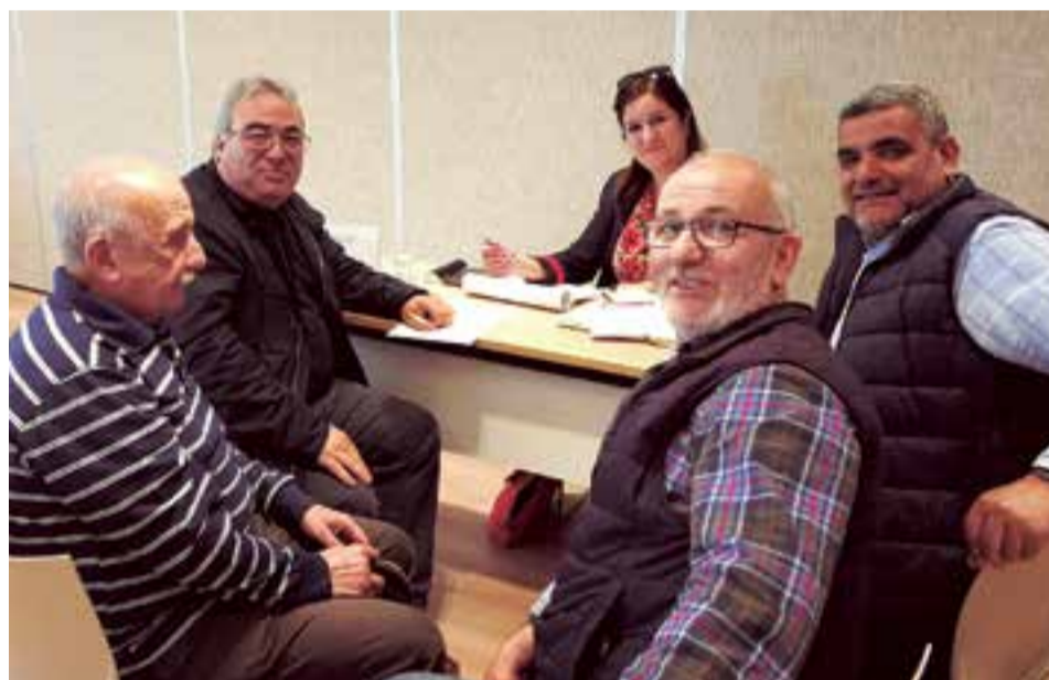
Durante una sesión informativa de un grupo de ciudadanos de Marruecos afincados en Mallorca

asesorar y acompañar de cerca, en todas sus gestiones administrativas al colectivo marroquí residente en España que se acerca a la importante cifra