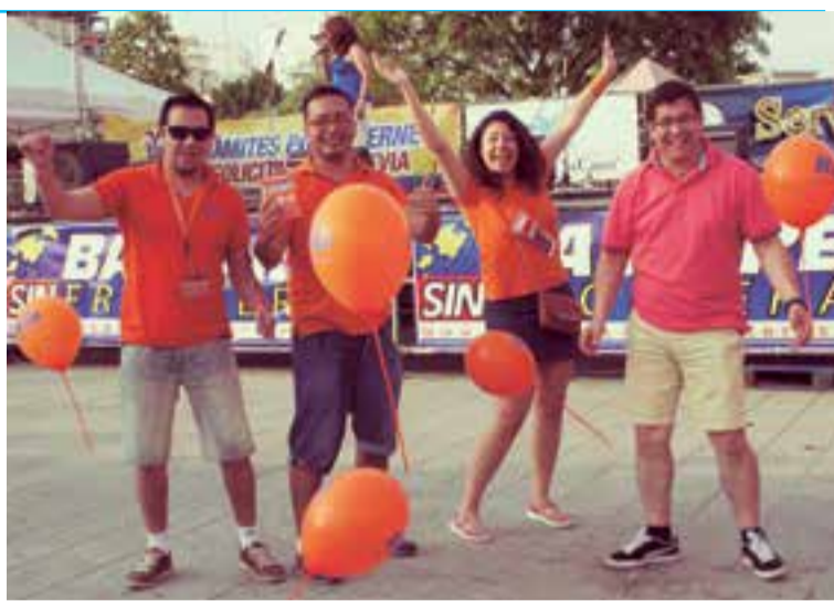
La delegación de Ria Envía de Madrid estará en Palma para la feria