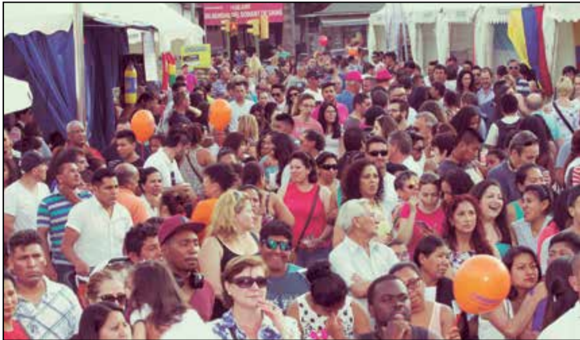
Este año será el 31 de mayo, 1 y 2 de junio en la explanada del Parque de las Estaciones de Palma.