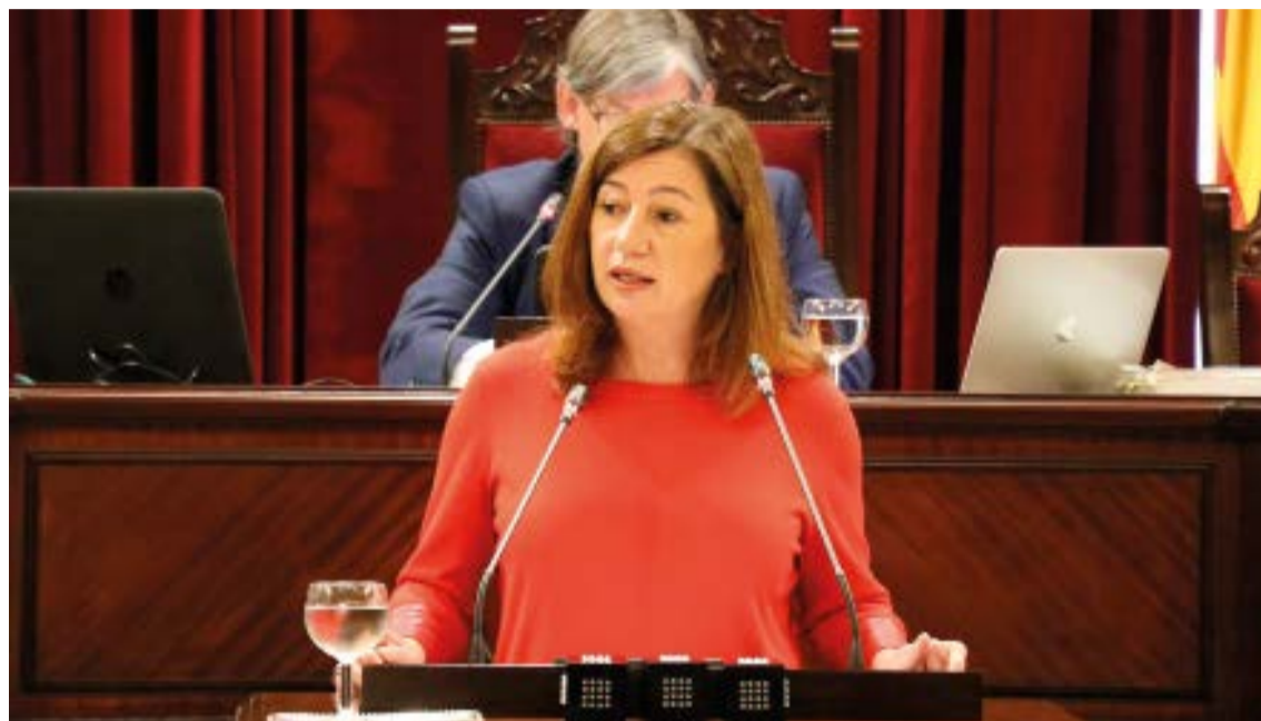
Francina Armengol en su comparecencia en el Parlament Balear por la emergencia sanitaria del coronavirus.

En el ámbito sanitario, la presidenta ha informado sobre el refuerzo de los equipos profesionales y la planificación para hacer frente a un repunte de contagios. Así pues, tal como ha recordado, el sistema de salud dispone de las camas de UCI habituales en la red pública, que se podrían duplicar en algunos hospitales, si fuera necesario, y reforzar con las de clínicas privadas. También ha recordado otras medidas, como la