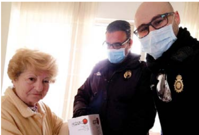
Los vecinos de Palma no dudan en ser generosos. Efectivos de la Policía Nacional han acudido a varios domicilios a recibir donativos de mascarillas sanitarias.