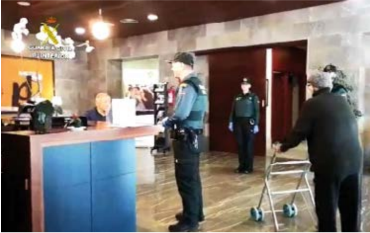
La Guardia Civil y la Policía Nacional visitan las residencias de personas mayores para ayudar a cualquier contingencia provocada por el COVID-19

El aeropuerto de Son Sant Joan, en Palma, registra la llegada de 330 pasajeros, mientras que otros 294 salieron de Mallorca en los distintos vuelos programados en las últimas horas.