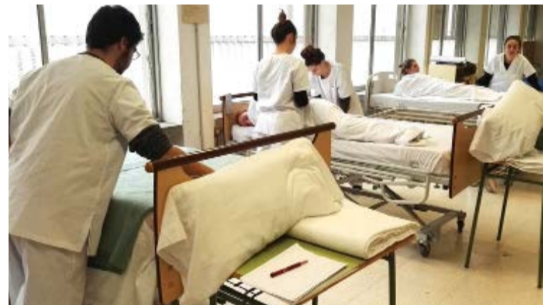
Los profesionales sanitarios responden con creces a la emergencia sanitaria por el COVID-19

Son centros públicos, concertados y privados que ofrecen ciclos de Formación Profesional de las familias de Sanidad y Servicios socioculturales. Ponen a disposición de Salud material como botellas de hidroalcohol, mascarillas quirúrgicas, guantes o batas de aislamiento