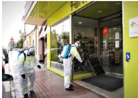
La solución usada para desinfección de las calles no supone ningún riesgo para la población.

El consistorio ha suspendido los servicios no esenciales de la ORA y aparcamientos. De la misma manera se han creado equipos de guardia por duplicado e independientes para las actividades que requieren una labor presencial que imposibilita el teletrabajo con el fin de pre-