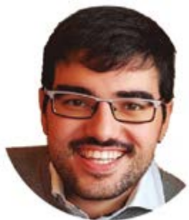
Por Alex Pomar

Y a van prácticamente tres semanas sin fútbol, tanto en competiciones profesionales como amateurs, sénior y categorías formativas.