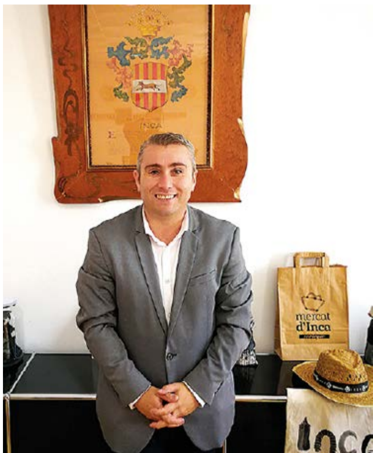
Virgilio Moreno, alcalde de Inca, dispuesto a ayudar a sus ciudadanos y hacer frente juntos al impacto del coronavirus.

Además, el consistorio priorizará también los trámites para la obtención de las licencias de obras.