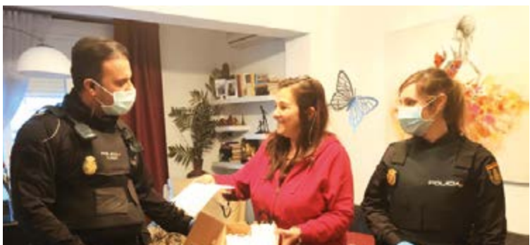
La comunidad china de Mallorca sigue haciendo gala de su solidaridad donando agua y suministros de primera necesidad a la Policía Local de Palma

nidad china y de gente anónima. En el perfil del Facebook enviaban un mensaje: “Y seguimos recibiendo detalles y donaciones, como este paquete de botellas de agua