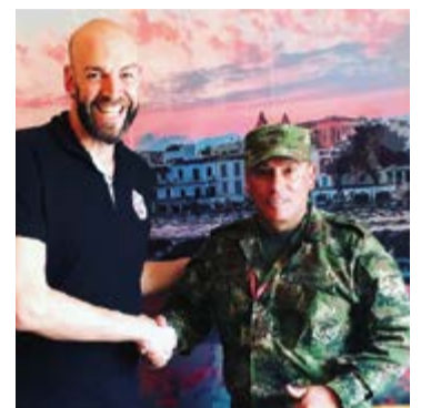
Ariza con un integrante del Ejército de Colombia que visitó su restaurante.