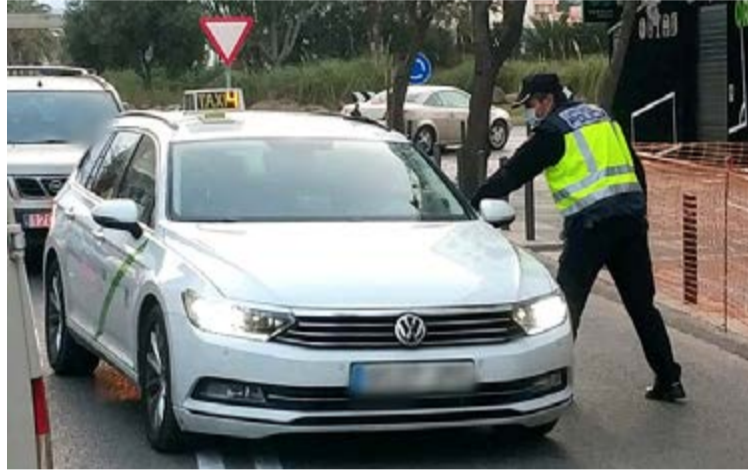
En diferentes puntos urbanos y carreteras de Baleares, la Policía Nacional, Guardia Civil y policías locales realizan controles a los conductores para verificar que se cumplen las disposiciones del estado de alarma.