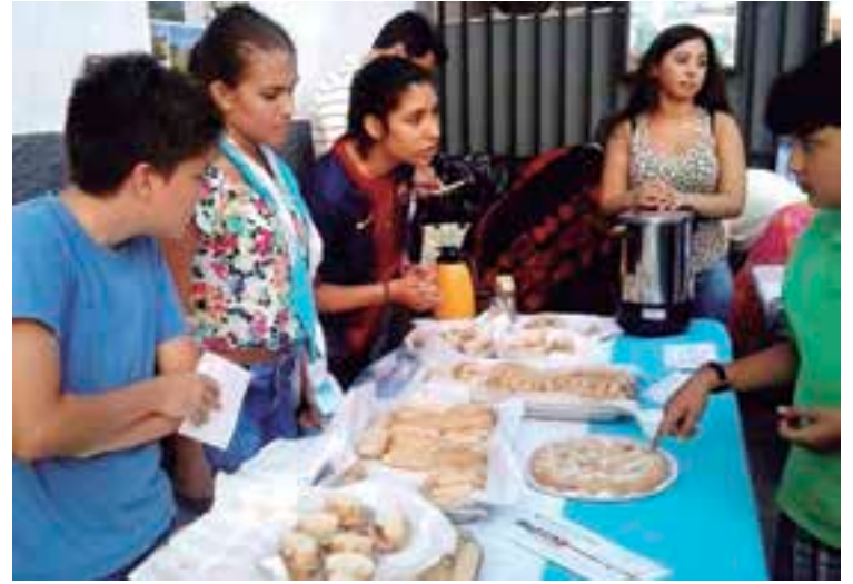
Los niños disfrutaron participando muy activamente en la fiesta.