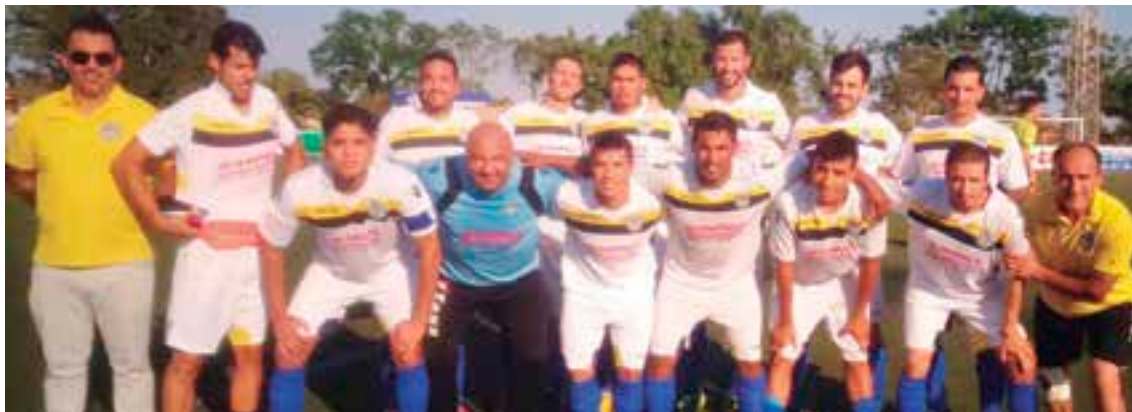
La alegría, el optimismo, la garra y la esperanza de BSF FC ya están enfocadas hacia el nuevo torneo.

Aunque los casis no valen, se debe valorar positivamente el desempeño del equipo en esta temporada 2014-2015