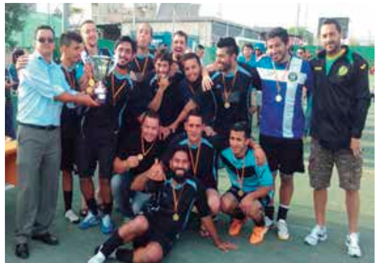
Los integrantes del Club Deportivo Sa Riera, flamantes campeones de la Liga Independiente 2014/2015.