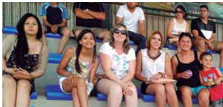
Esposas y familiares de los jugadores siempre junto a ellos

Baleares Sin Fronteras comienza la pretemporada desde el 20 de julio en el Polideportivo de Son Moix en horarios por confirmar. Desde este momento se abre una convocatoria de jugadores que quieran integrar el plantel. Informes en el 655 20 70 19 / 600 887 680 ●