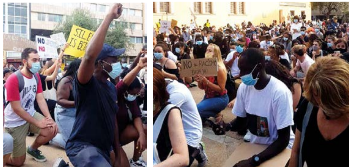
Los manifestantes en Palma por el asesinato de George Floyd aprovecharon el momento para denunciar políticas racistas en contra de su comunidad.

fiesto leído por una joven africana hacía referencia a la vulneración de derechos y garantías en los CIE (Centro de Internamientos para extranjeros), además de las condiciones infra-