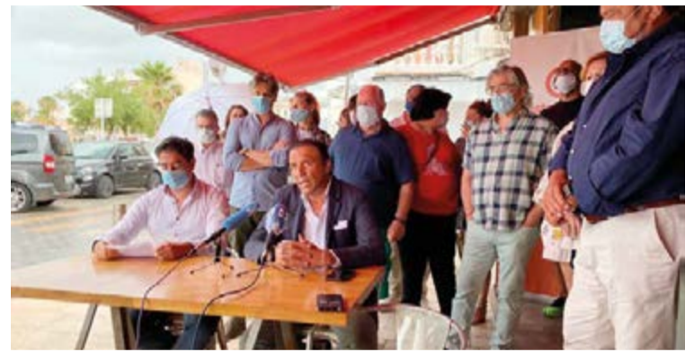
Rueda de prensa celebrada en Cocco, restaurante ubicado en Portixol con los restauradores de la zona muy afectados por esta crisis.

Una situación que contrasta mucho con la que están viviendo otros municipios de la Part Forana y ciudades a nivel nacional donde sus máximos organismos municipales “han hecho todo lo que podían para ayudar al sector”. Ejemplo de ello, ha declarado el vicepresidente de Restauración CAEB, es Calvià, Inca o Madrid “que no solo se han adelantado a los problemas sino que su gestión nada tiene que ver con las políticas restrictivas y de ninguneo como las que aplica el Ayuntamiento de Palma”.