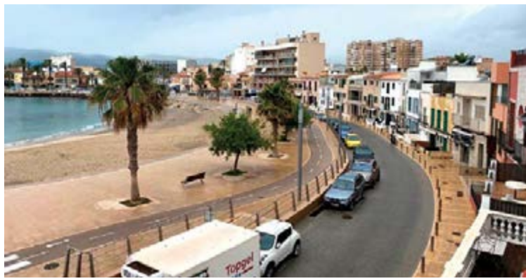
El sector de la restauración de Portixol es uno de los más afectados de Palma

Sin embargo, añade, “seguimos teniendo incertidumbre en todo aquello relacionado con