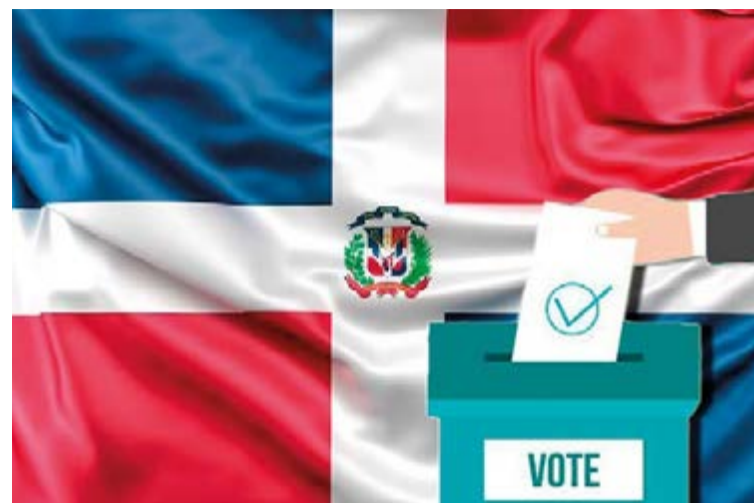
El 5 de julio los dominicanos inscritos en el padrón electoral podrán votar a las presidenciales de su país.

El colegio electoral será habilitado en el CEIP Aina Moll i Marqués, Palma