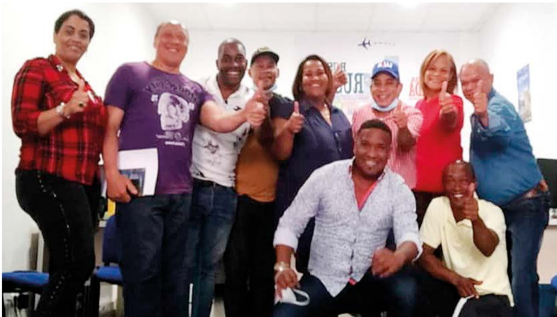
Un grupo de entusiastas dominicanos en Mallorca se decantan por el Partido Revolucionario Moderno