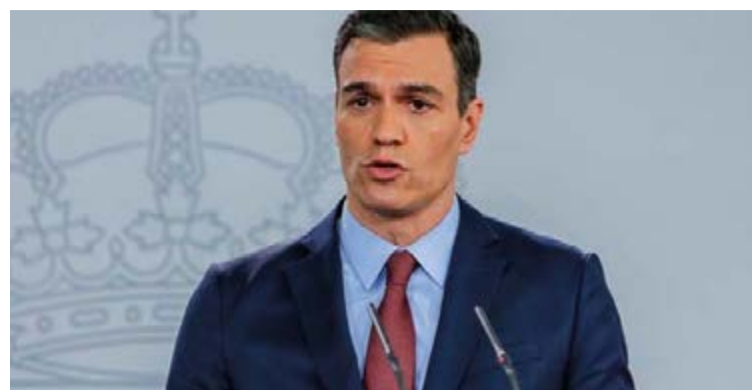
Pedro Sánchez no dio mayores detalles sobre si en la agenda del gobierno exista la posibilidad de una regularización de inmigrantes

Los comunicadores de diferentes medios no perdieron la oportunidad para preguntarle por una posible regularización de inmigrantes en España, que dicho sea, es la prin-