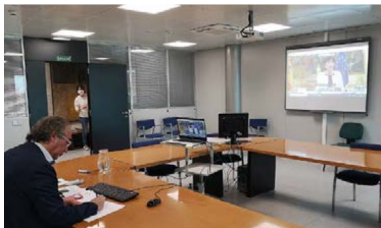
El Conseller de Educación Martí March en la Conferencia Sectorial de la Educación con el Ministerio.

Las propuestas del Ministerio han sido valoradas de manera positiva por parte de Baleares. “Se han aprobado los 14 puntos propuestos por el Ministerio por la mayoría de comunidades y es que todos coincidimos en la necesidad de hacer un buen inicio de curso y de coordinarnos y llegar a acuerdos para hacerlo posible con la