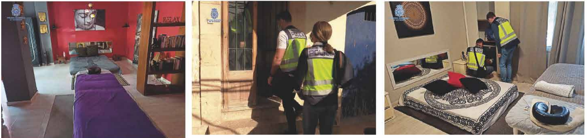
Imágenes de distintas instancias del procedimiento realizado por una veintena de agentes de la Policía Nacional

La obligaban a prostituirse en un piso de la barriada palmesana de Foners