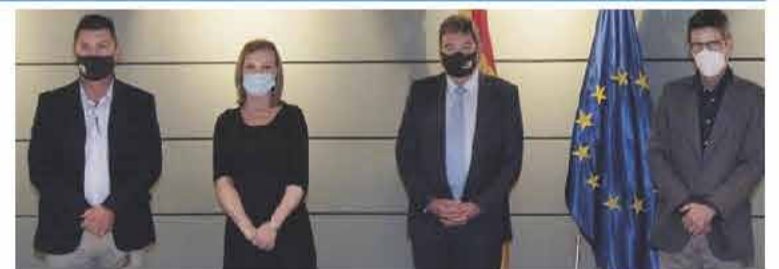
El ministro José Luis Escrivá, se reunió con representantes de las principales asociaciones de autónomos

La propuesta inicial del Ministerio, sobre la que se ha iniciado el diálogo con las asociaciones, plantea que los nuevos trabajadores por cuenta propia elijan su base de cotización en función de las previsiones de rendimientos que tendrán. Escrivá ha planteado un sistema flexible, que se pueda modificar a lo largo del año y que se regularice un año después, incluso con la posibi-