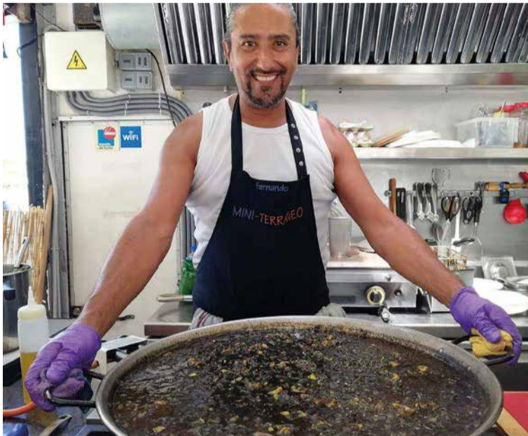
No es grande ningún desafío culinario para este colombiano afincado hace tres décadas en Mallorca

Sin embargo, sus enriquecedoras experiencias en la Isla nos hizo retroceder en el tiempo.