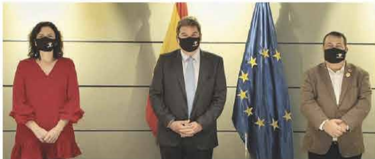
Milagros Paniagua, el ministro de Inclusión, Seguridad Social y Migraciones, José Luis Escrivá, y el alto comisionado contra la Pobreza Infantil, Ernesto Gasco