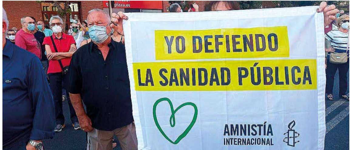
Manifestaciones de protesta ante un sistema sanitario desbordado