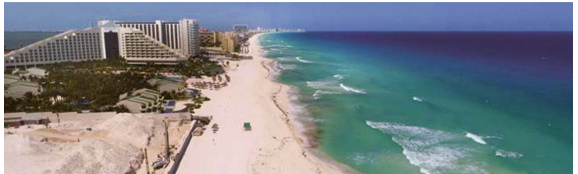
Playas de Cancun, México, sin turistas por crisis del Covid-19.

Las causas y consecuencias ya están sobre diagnosticadas y consideradas, pero quizá, no se han dimensionado en todo se espectro; teniendo en cuenta que el turismo no es solo impulsor del transporte aéreo, terrestre y marítimo, la hotelería, los operadores y agencias de viajes, sino que involucra todos los demás rubros económicos como la gastronomía, bares, tiendas