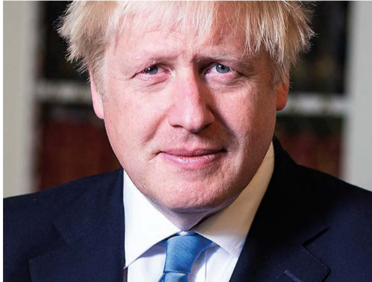
Boris Johnson, primer ministro del Reino Unido.

Entre tanto, un portavoz del ministerio del Interior británico aclara esta versión de otra manera: “Quizá algunas personas no elijan solicitar la residencia a través del EUSS o no quieran quedarse en el Reino Unido después de la fecha límite. Por eso hemos escrito a personas y organizaciones interesadas para informarles de que los ciudadanos del Espacio Económico Europeo que