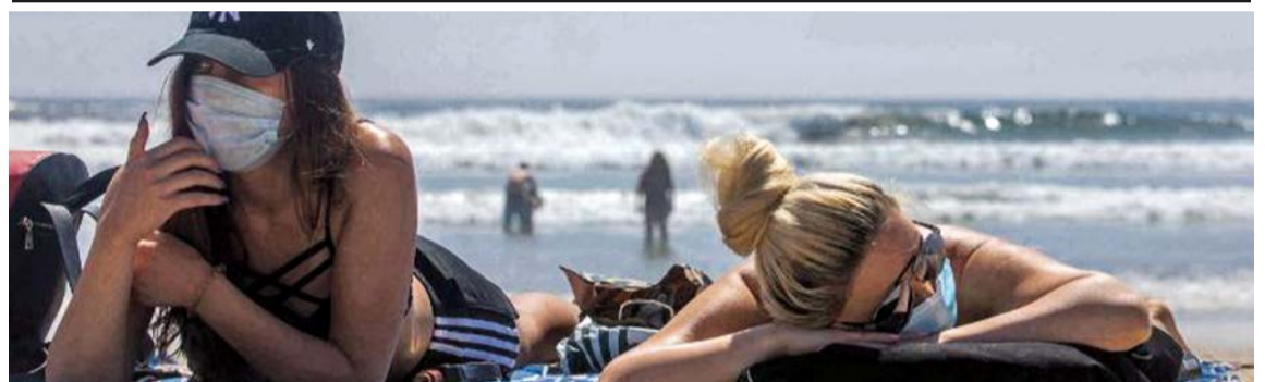
Turistas en la playa con mascarilla y distanciamiento como muestra de los cambios de hábito por la pandemia.