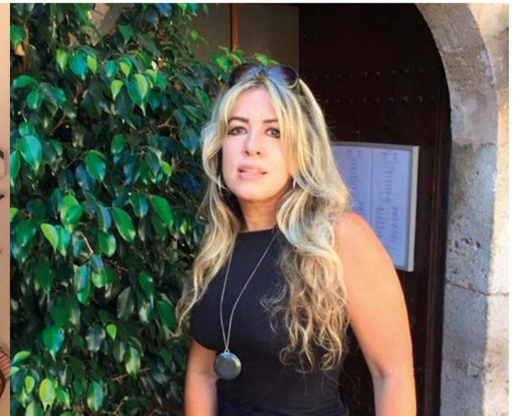
La artista y una de sus obras.

precisado. Tenía planeado un viaje a Venezuela pero esto del Covid-19 lo ha trastocado todo, mientras esta dificultad pasa sig