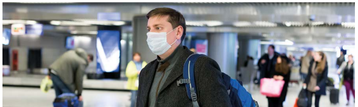
Viajeros en aeropuertos con medidas de bioseguridad por cuenta del Covid-19.