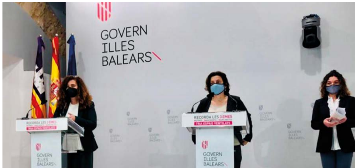
La consellera de Afers Socials i Esports, Fina Santiago

Como si fuera poco, las entidades del tercer sector no dan abasto para atender las necesidades de los usuarios que llegan