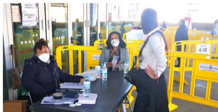
Ecuatorianos acudieron al Palma Arena a depositar sus votos