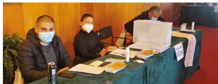
Miembros de la mesa electoral en las votaciones de Perú.