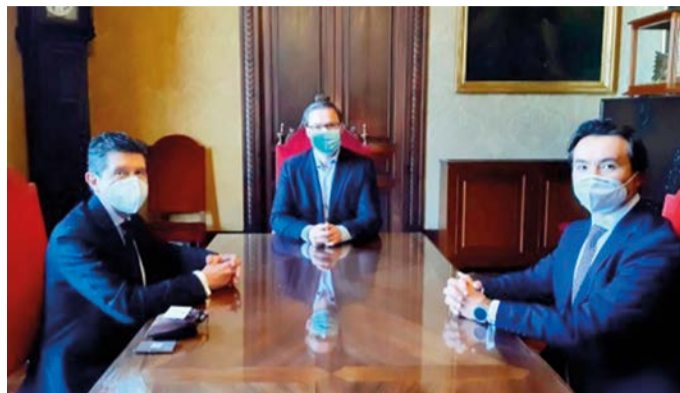
El cónsul, Rafael Arismendy, el alcalde de Palma, José Hila y el vicecónsul de Colombia en Baleares, Juan David Moncaleano.

Se estima que actualmente la cifra de ciudadanos nacidos en este país asciende a veinte mil, por eso razón, para el consulado es importante tener una línea de atención eficaz a los usuarios y preparar iniciativas sociales y culturales en el que se plasme lo más representativo del país ●