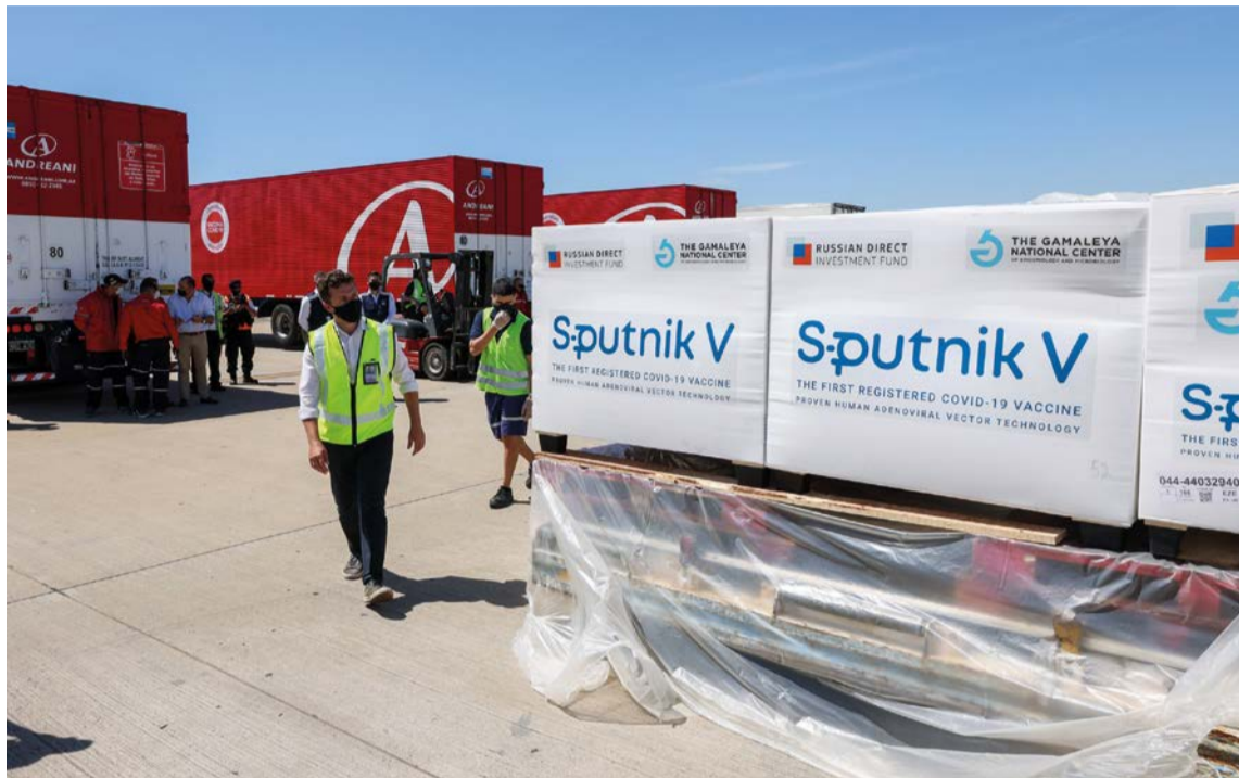
Arribo de un cargamento de vacunas Sputnik a la Argentina.