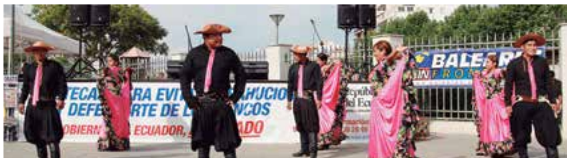
Exhibición de bailes tradicionales bolivianos durante la Feria de Comercio Latinoamericano de Palma.

La jornada contará con la colaboración de las diferentes asociaciones civiles, culturales y deportivas con el apoyo de empresarios bolivianos y la colaboración del Ayuntamiento de Palma de Mallorca ●