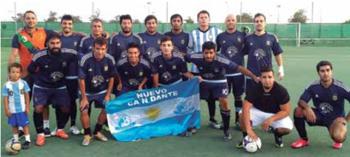
Argentina, una de las favoritas para ganar el torneo.

Todas las categorías entran en la fase decisiva para definir los campeones