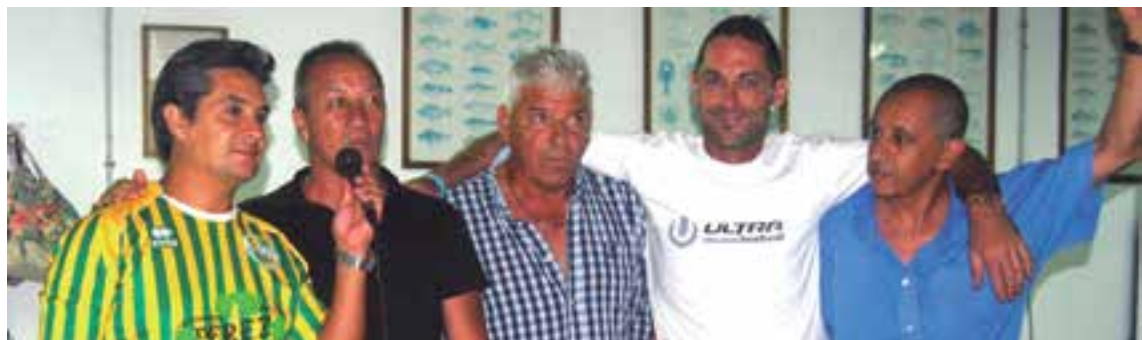
Aldosivi-Mallorca, una pasión importada desde Mar del Plata, Argentina.