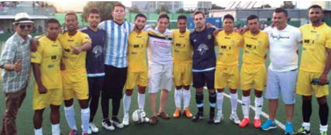
Una imagen de hermandad, antes del partido de Colombia vs Argentina, jugadores de ambos equipos que militan en BSF FC de segunda regional, junto a directivos y cuerpo técnico del Club.