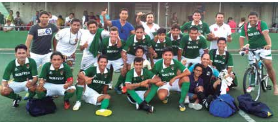
La Selección de Bolivia, una de las sensaciones del mundialito, apoyada por su numerosa afición.