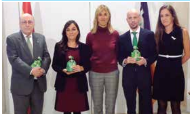
En la entrega en la sede de la Delegación del Gobierno del reconocimiento a instituciones que luchan contra la violencia de género

La delegada del Gobierno entrega 3 'Meninas' a instituciones u organizaciones que trabajan a lo largo del año por la erradicación de la violencia contra la mujer