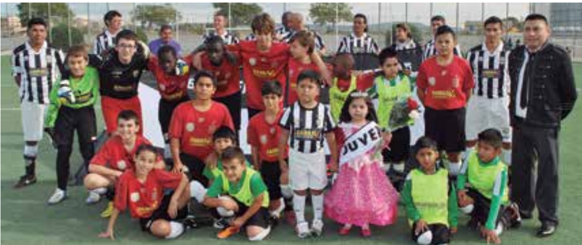
Los equipos y sus acompañantes durante el desfile de inauguración de la Liga Master sub 40