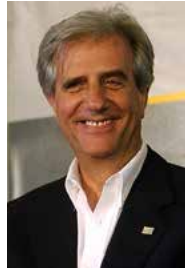
Tabaré Vázquez asume su segunda presidencia.

La página del Ministerio de Relaciones Exteriores enfatiza en que "asumimos el compromiso de coordinar gestiones y acciones comunes con todas las partes implicadas, a saber: sectores de la sociedad civil del país, de la diáspora uruguaya y el sistema político en su totalidad, en defensa de los derechos cívicos de las ciuda-