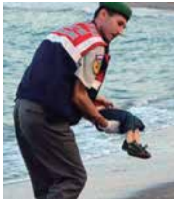
La foto que conmueve al mundo

Baleares no ha sido la excepción a los mensajes de solidaridad que la sociedad civil envía. Ya se conocen casos de familias residentes en esta