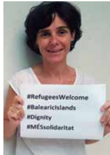
Margalida Capellà, diputada de Més Per Mallorca.

A su vez, los movimientos ciudadanos de ayuda se expanden a lo largo de la Islas. Recientemente en el centro cultural Can Alcover se reunió un nutrido número de personas para crear una plataforma de ayuda a los refugiados.