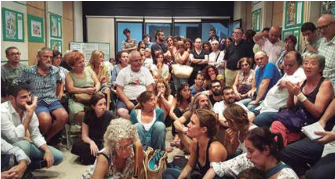
La imagen del niño sirio Aylan, fallecido en una playa turca ha despertado el espíritu solidario de la sociedad civil de Mallorca, representantes políticos y las instituciones para la acogida de refugiados.