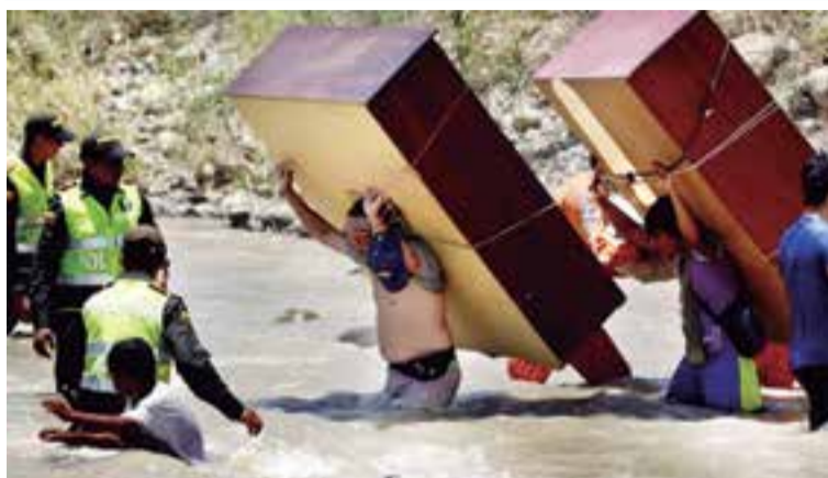
Colombianos deportados de Venezuela con sus enseres al hombro

A.I. Amnistía Internacional está profundamente preocupada por las denuncias recibidas de violaciones de derechos humanos que se estarían produciendo en la zona fronteriza con Colombia, en el contexto de un operativo de las autoridades venezolanas para combatir la inseguridad y el contrabando en la zona.