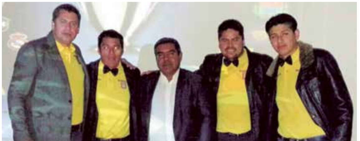
Representantes homenajeados por la Liga Boliviana de Fútbol de Mallorca