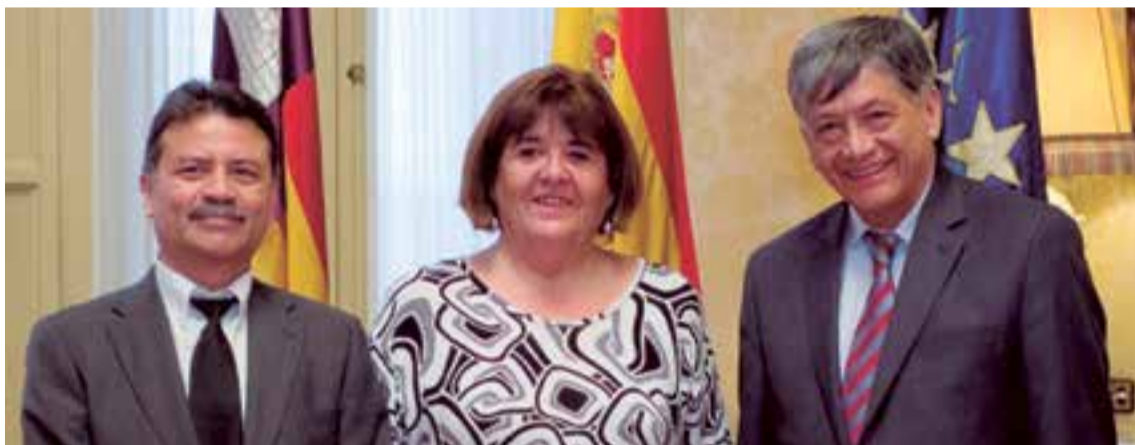
Los representantes del Ejecutivo ecuatoriano durante la visita a la presidenta del Parlament, Xelo Huertas