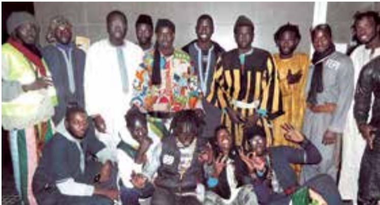
Representantes y asistentes senegaleses celebrando su festividad