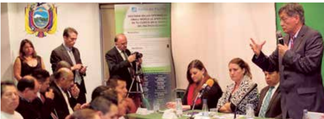
Un centenar de ecuatorianos acudieron a la exposición del diplomático al taller de asistencia jurídica de hipotecas