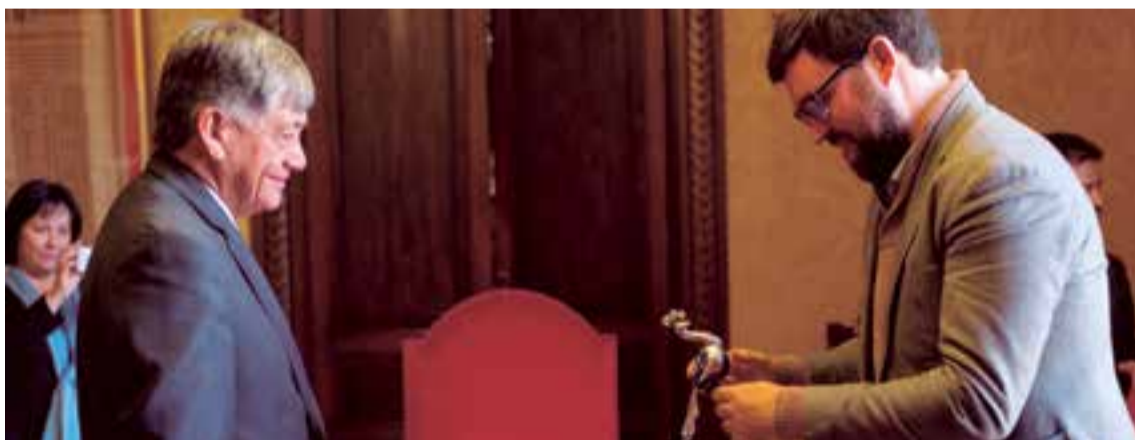
El embajador recibiendo un detalle simbólico del teniente de Alcalde del Ayuntamiento de Palma, Antoni Noguera