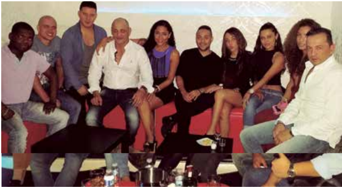
Como se puede apreciar en las imágenes, Pupetto- Pub abrió con éxito las puertas al público el pasado 5 de diciembre