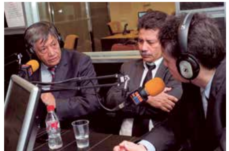
Durante la entrevista al embajador y al cónsul en la emisora Fiesta FM