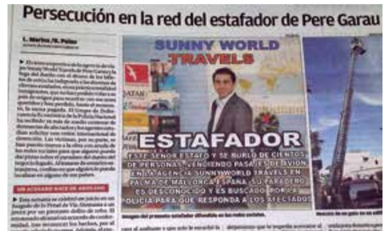
La imagen que ha circulado por las redes sociales, también publicada junto a una reseña por el Diario de Mallorca.

Su estupefacción fue máxima cuando al llegar a la agencia a pagar otra cuota se encontró con la noticia de que el dueño había cerrado. “Perdí mi dinero”, comen-