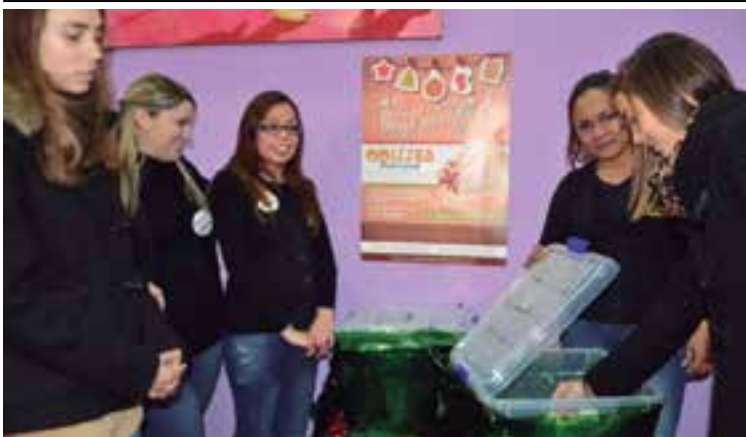
Momento del sorteo de determinó el nombre de las dos ganadoras