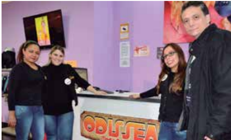
Baleares Sin Fronteras acompañó al equipo de Odissea Moda Casual en el sorteo de las agraciadas

El sorteo se hizo el pasado 2 de enero en la sede de la calle Antonio Marqués, en Palma