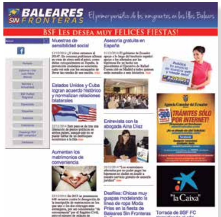
Home-page del nuevo website www.baleares-sinfronteras.com

Por otra parte, dentro de un mes nuestro radio de acción se ampliará con la llegada de nuevos expositores que se pondrán en sitios frecuentados por público masivo. Los antiguos soportes permanec