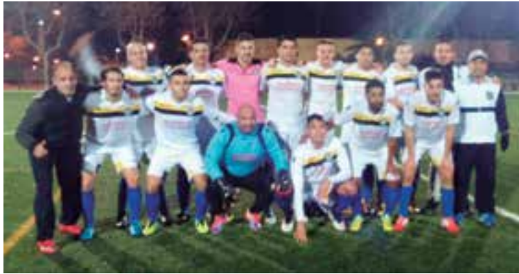
Este es el equipo que ganó el último partido en su visita a Sa Pobra, 0-3

En total serán veinte finales en las que el equipo estará preparado para afrontar el reto de ascenso a primera