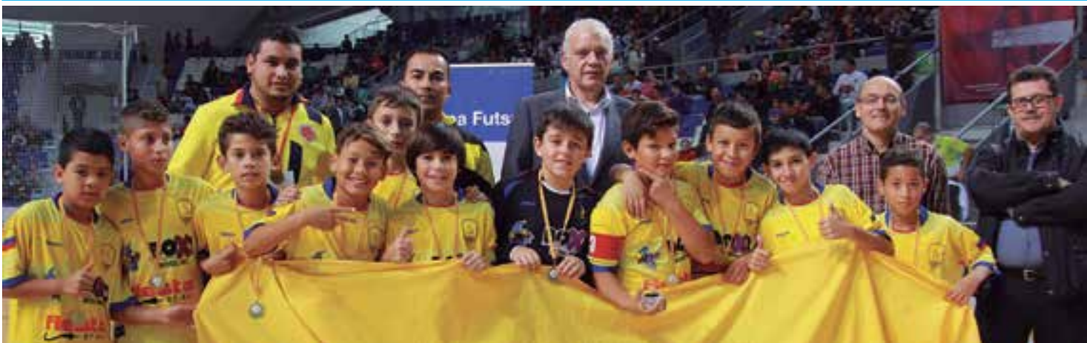
Colombia ganó el derecho a jugar la Air Europa Cup Palma 2015 de fútbol sala en Son Moix.

Es un torneo que congrega los mejores equipos de futbol sala, entre ellos el Barcelona y Pozo de Murcia que competirán