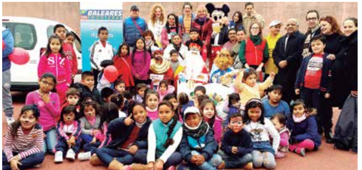
Los niños que acudieron con sus familias a Son Moix a hacer su donativo de alimentos no perecederos

Asimismo, la inestimable colaboración de la Agencia Consular de Ecuador, el Consell de Mallorca, la Fundación la Caixa, de Goya Nativo y del Circo Alegría On Ice, que creyeron en este proyecto de buenas intenciones ejecutado en la práctica ●