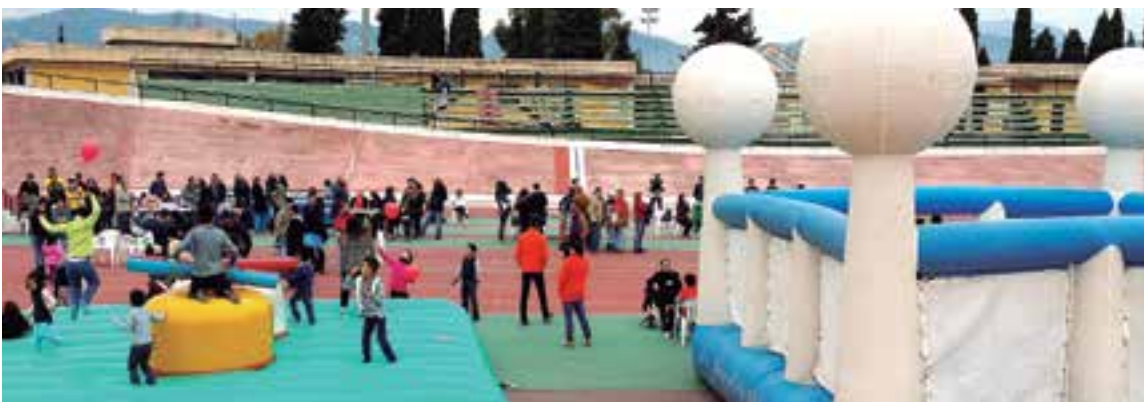
En las imágenes los castillos hinchables, los payasos, los reyes Magos, pintacaritas y OGC, colaborador del evento