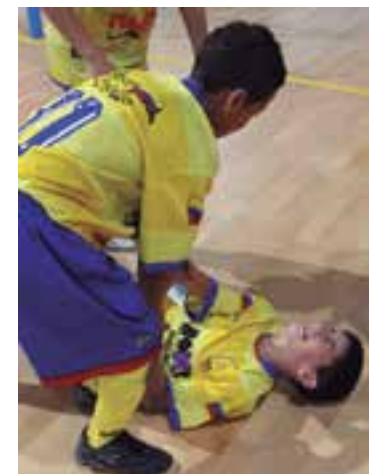
Un niño de Colombia es consolado por su compañero tras haber fallado un penal en el emotivo partido frente a Uruguay en el mundialito reciente, organizado por Palma Futsal y Baleares Sin Fronteras.