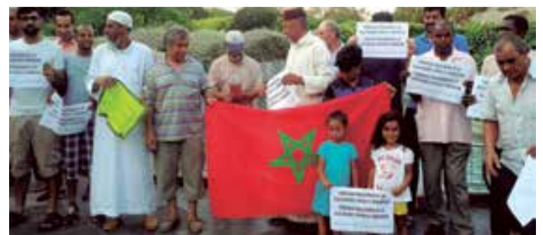
Numerosos miembros del colectivo estuvieron presentes a favor de la paz.