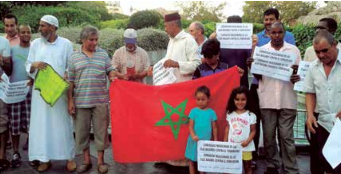
Un grupo de representantes islámicos piden a la ciudadanía de las Islas no estigmatizarlos frente a los hechos violentos sucedidos en la última época. Sus líderes rechazan cualquier acto que atente contra la ciudadanía.