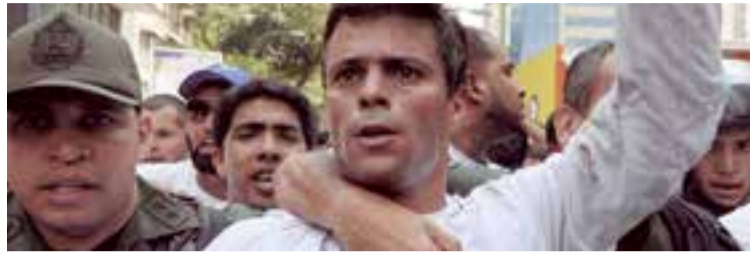
El venezolano Leopoldo López, líder del partido opositor Voluntad Popular.

Leopoldo López, líder del partido de oposición Voluntad Popular, se entregó a la Guardia Nacional el 18 de Febrero de 2014 tras una manifestación que organizó. El 10 de Septiembre de 2015, fue encontrado culpable de incitar a la violencia durante protestas contra el gobierno el 12 de Febrero de 2014 y sentenciado a 13 años y nueve meses de prisión por cargos de conspiración, incitación al delito, incendio y daños a propiedad