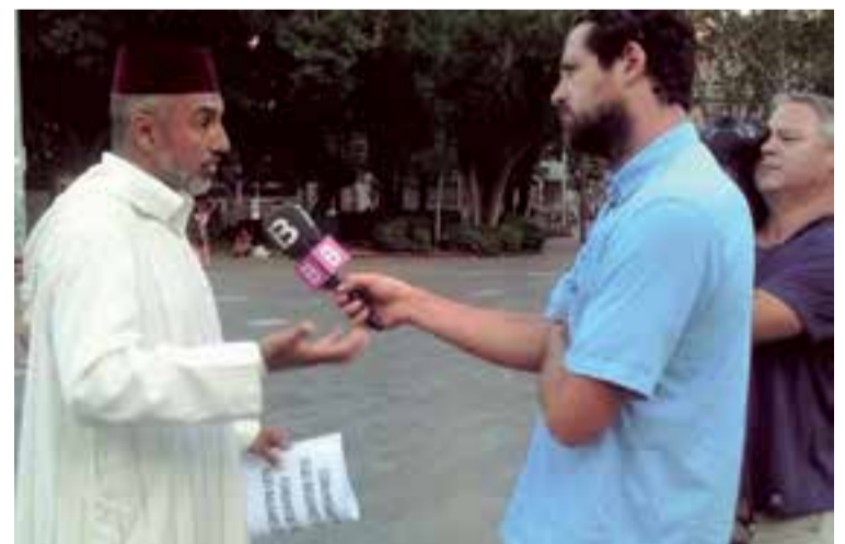
Un imán es entrevistado por la cadena de televisión IB3.