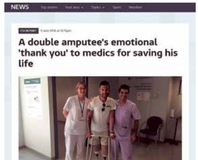
Una de las notas publicadas online en el Reino Unido.