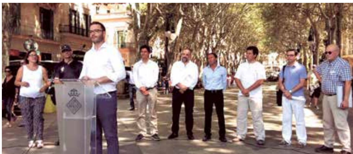
El alcalde de Palma, José Hila, durante la presentación de la red WiFi gratuita en el paseo de Born.

En palabras de José Hila, “el wifi gratuito tiene un potencial extraordinario de difusión de los atractivos turísticos de Palma: cada turista puede ser un prescriptor de promoción de la ciudad: hace fotos, las cuelga