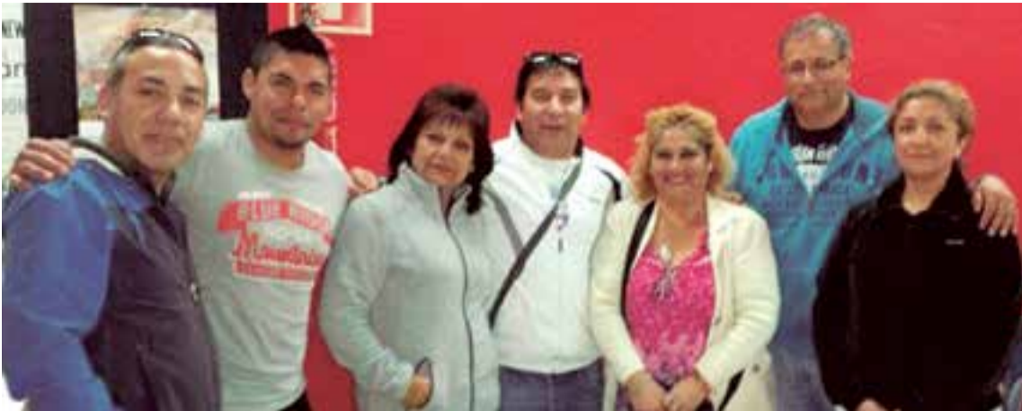
Directivos de la Asociación Raíces de mi Tierra, que interviene en numerosas actividades de difusión cultural.