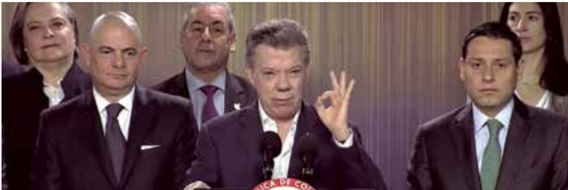
El presidente Santos enfatizó y celebró que en el último informe diario emitido sobre incidencias de seguridad el resultado ha sido "cero muertes".

El pueblo colombiano decidirá con su voto si aprueba el acuerdo de paz propuesto.