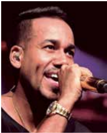
Romeo Santos, la gran decepción.