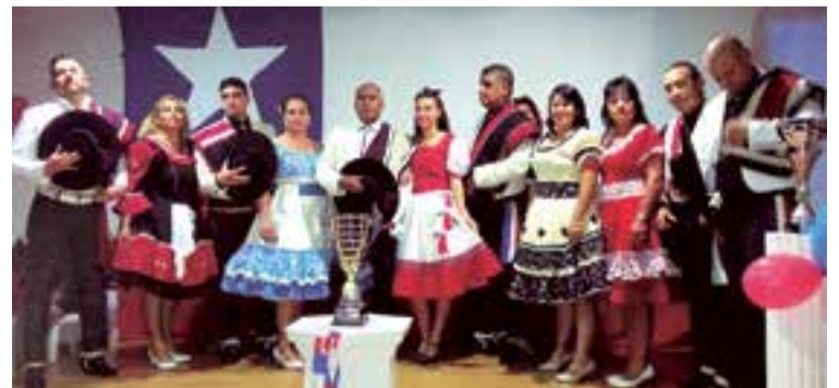
Las tradicionales danzas folclóricas chilenas, siempre bien representadas.

Entre tanto, la otra parte de lo recaudado se utilizará