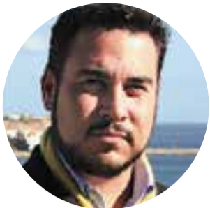
Por: Igor Valiente Bastante Abogado 4006 VALIENTE ABOGADOS C/. General Riera, 1 - 10º C 07003 Palma