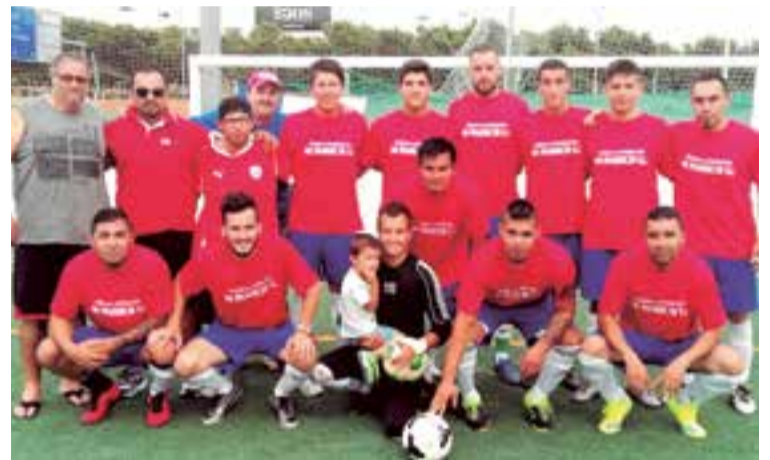
El equipo a pleno del club de fútbol Cóndores de Chile.