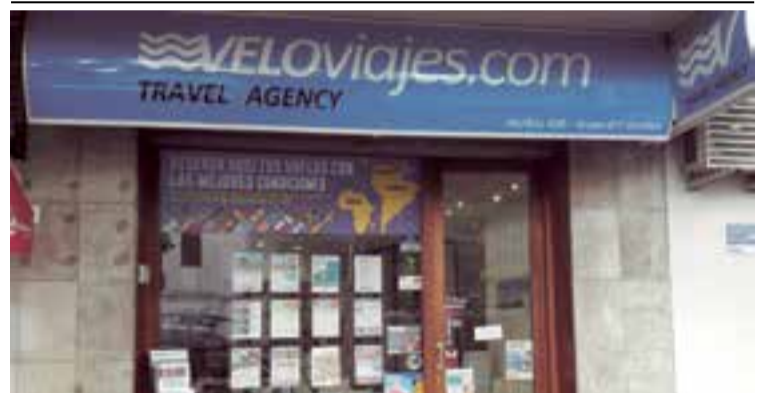
La fachada de Veloviajes, localizada en la calle Jaume Balmes, 1-A- Palma