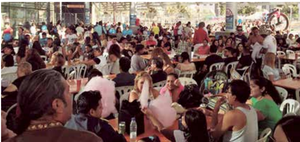
Más de 1.500 personas se congregaron en el Palma Arena para celebrar el Día del Amor y la Amistad

las modelos de Odissea Moda Casual. La jornada también contó con un abanico de posibilidades gastronómicas de diferentes países. Los exigentes paladares degustaron las comidas típicas de varios negocios regentados por empresarios sudamericanos ●