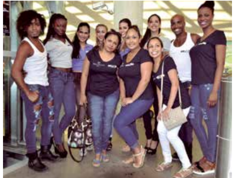
El equipo de desfile de Odissea, Moda Colombiana, en el Palma Arena.