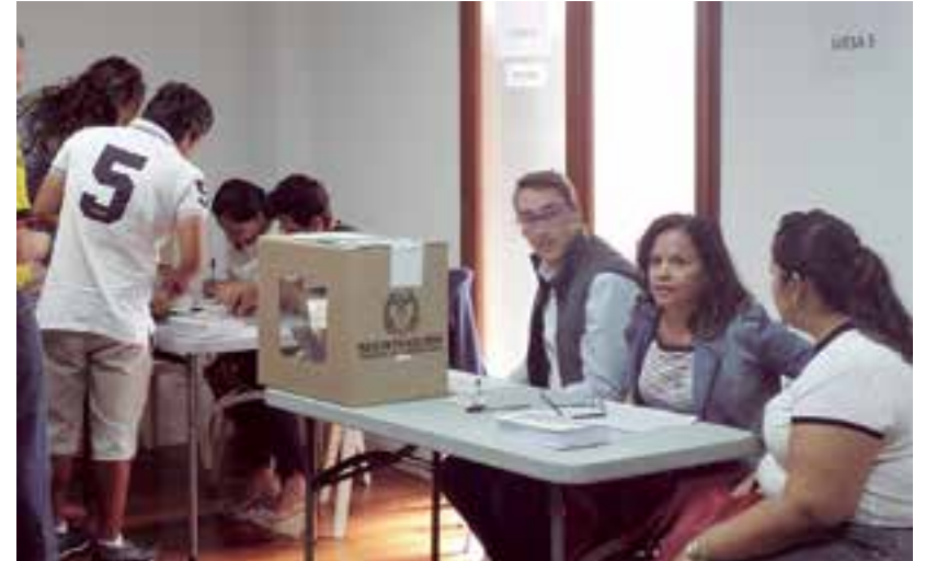
El consulado colombiano de Palma abrió sus puertas desde las 8.30h para las votaciones al Plebiscito