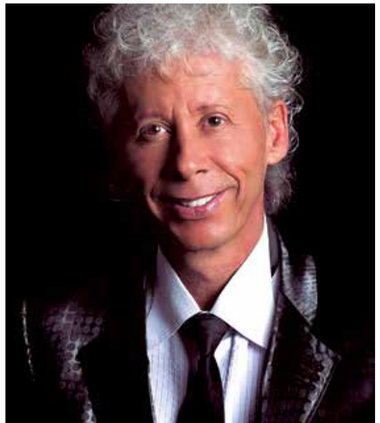
Galy Galiano con lo mejor de sus éxitos musicales este 8 de octubre en la sala de Eventos Factory, localizada en el Polígono Son Castelló.

Para quienes no conocen la trayectoria de Galy Galiano, cabe señalar que es uno de los artistas polifacéticos, exitoso en cada uno de sus géneros musicales: baladas, ranchera, salsa y