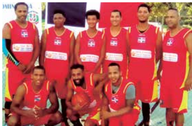
Los equipos de baloncesto dominicanos juegan en la barriada de Son Oliva