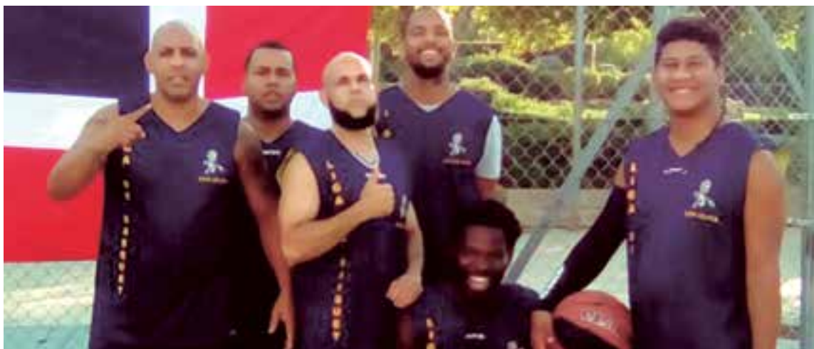
Uno de los deportes más seguidos en República Dominicana es el baloncesto, disciplina que los jóvenes practican en el torneo de la barriada de Son Oliva con la presencia de aficionados y empresarios de esa nacionalidad

Desde Baleares Sin Fronteras seguiremos apoyando estas iniciativas que contribuyen a estrechar lazos de confraternidad entre las diferentes culturas afincadas en Mallorca ●