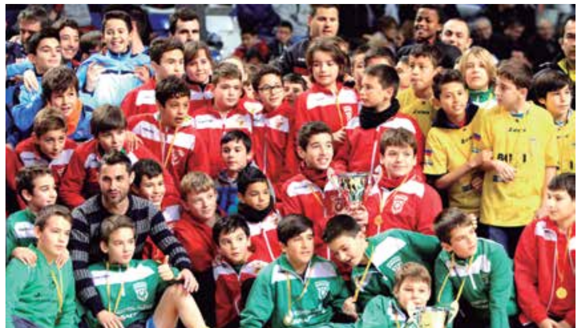
La foto de familia de los equipos participantes en la Cup Air Europa