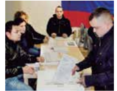
El colombiano, después del ecuatoriano, es el segundo colectivo que más comunicaciones ha recibido del INE para votar a las municipales del 24M. Foto de archivo

Contrario a lo ocurrido el año pasado, y según por lo que hemos podido sondear a través de las asociaciones de inmigrantes, esta