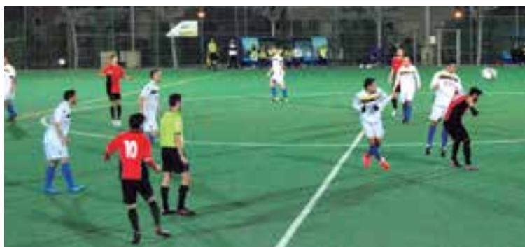
En el primer tiempo BSF FC marcó los dos goles que le dieron la victoria ante La Unión Deportiva Santa María

Comienzan una serie de partidos que definirán la suerte que representa a este periódico