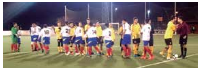
Los jugadores del equipo latinoamericano saludando a los locales de Son Sardina B- previo al juego que ganaron 0-3