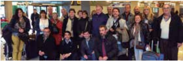
Los baleares que emigraron a otros países, especialmente a Latinoamérica, fueron recibidos por las autoridades en el aeropuerto de Palma

Se trata de mantener las raíces culturales propias de las Islas arraigadas de los baleares emigrantes a otros países