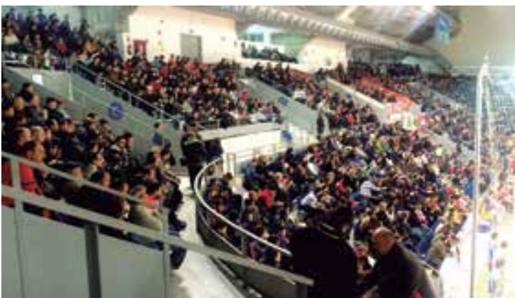
Los chavales de Colombia satisfechos tras un notable torneo