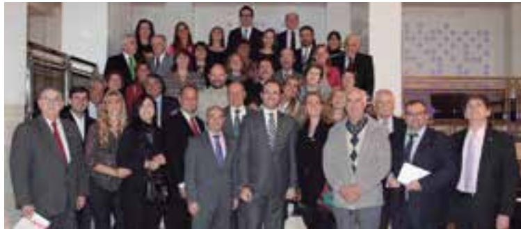
La foto de familia con las autoridades del Govern