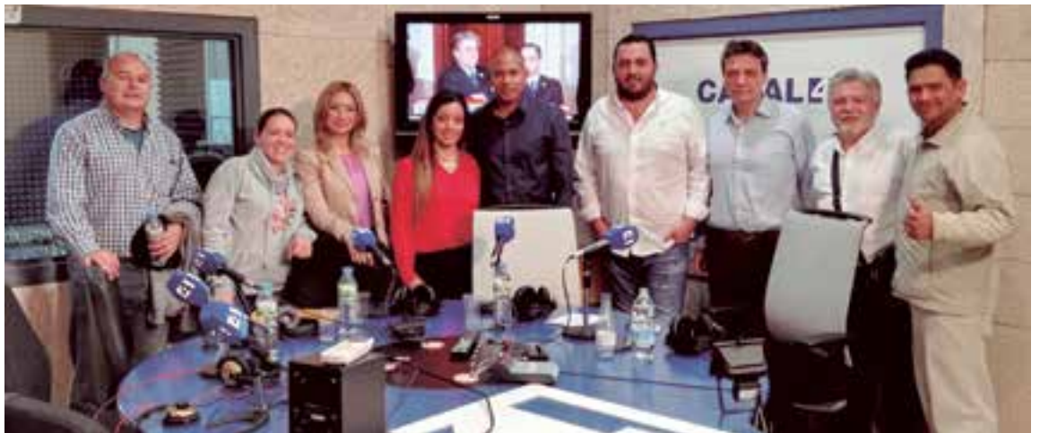
En uno de los programas de Baleares Sin Fronteras Magazine, que se emitirá también por televisión Canal 4

De la misma forma existe una sección dedicada a los convenios bilaterales de pensiones entre España y los países latinoamericanos ●