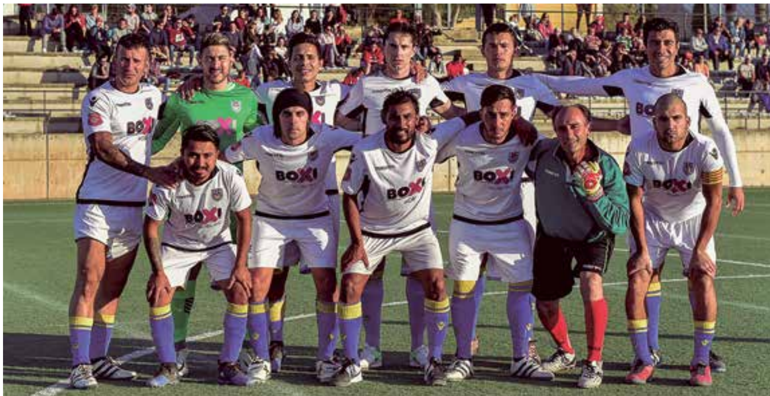
El equipo titular que saltó al campo para jugar contra Unió Esportiva Santa María en el triunfo que lo consolida como líder de la clasificación.

Poco a poco, BSF FC hace afición, quedó demostrado en un espectacular marco de público el pasado 22 de abril en Son Moix