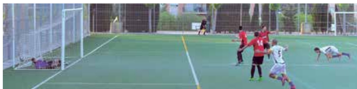
Una imagen del tercer gol de cabeza marcado por el pichichi del equipo, el paraguayo, Silvio Esquivel