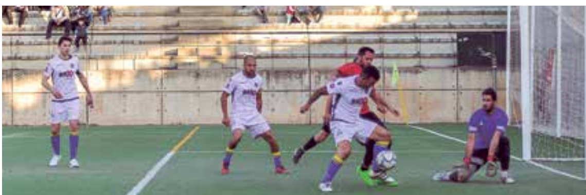
Desde los primeros minutos del partido BSF FC buscaba abrir el marcador