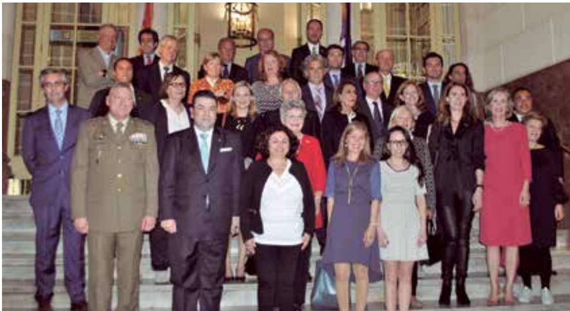
El cuerpo consular de Baleares le apuesta a impulsar políticas de integración entre sus representados y la sociedad de acogida