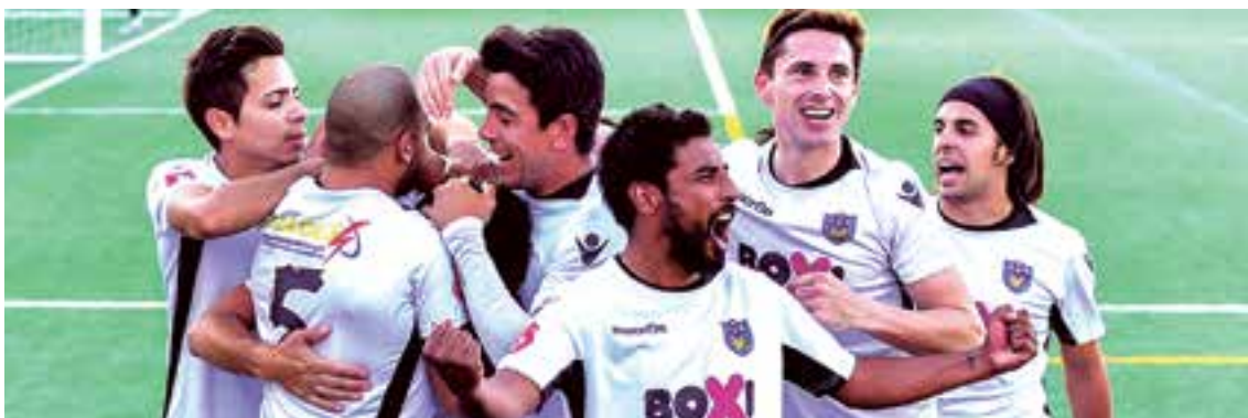
El equipo festeja uno de los goles convertidos al Santa María.