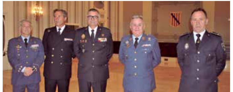
Altos mandos militares y de la Policía Local de Palma