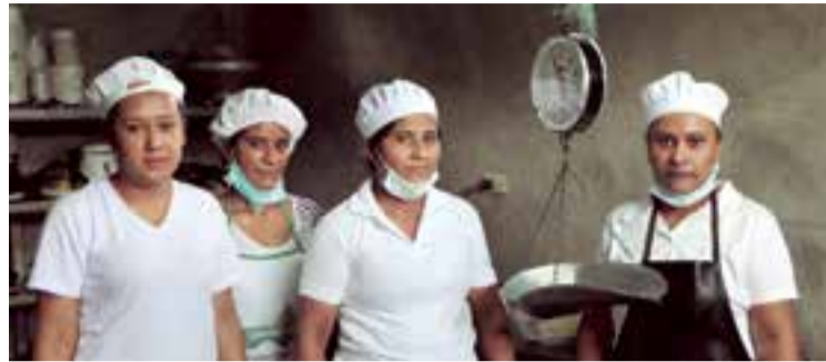
Beneficiarias de un microcrédito en una fabrica de lacteos

Esta cooperación, que sigue la filosofía del Fondo e implica la cooperación mutua entre las autoridades y entidades locales y mallorquinas, ha dado como fruto proyectos tan necesarios como la