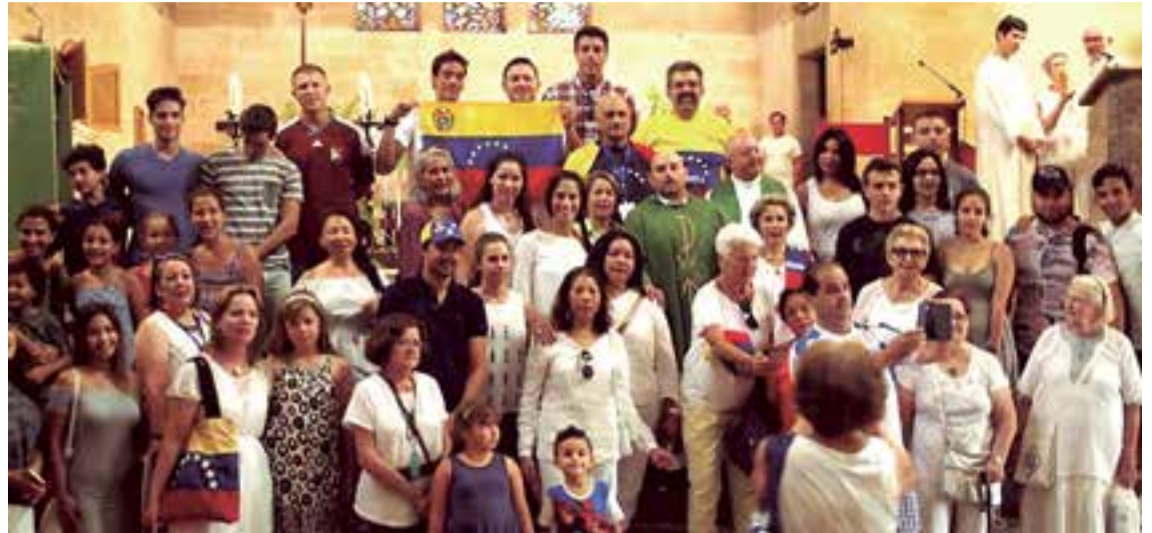
Los venezolanos elevaron sus plegarias por la paz de su país envuelto en un fuerte conflicto social

Significativas imágenes avivaron el sentimiento patrio de los venezolanos, además de las notas musicales en las que se escuchó el cuatro (instrumento musical) y una enorme bandera del país sudamericano que se