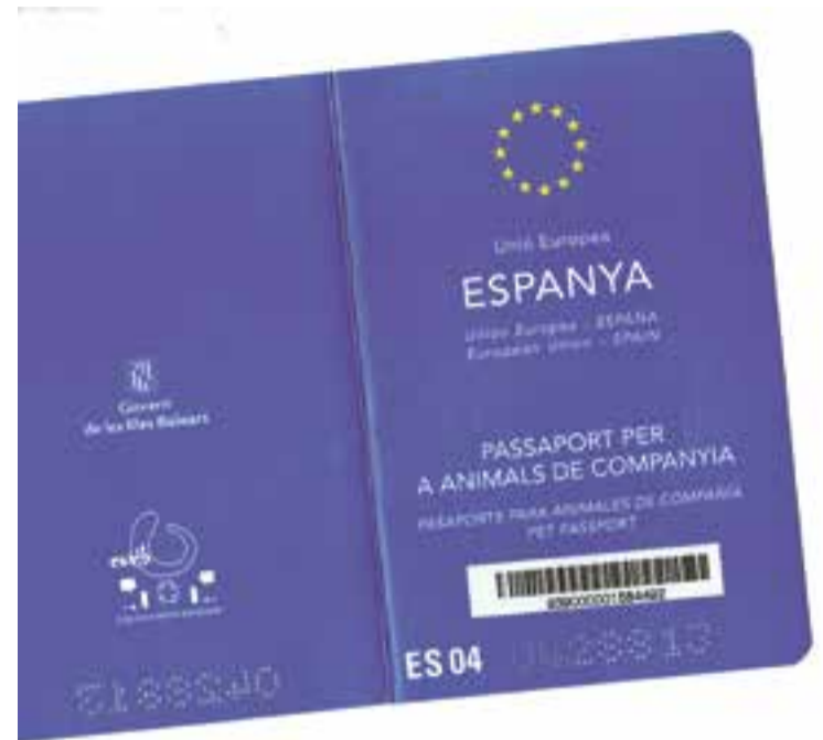
Pasaporte de Rist, un perro traído desde Bolivia, a su dueño, sorprendentemente le han denegado la tarjeta de familiar de comunitario

Este tema me recuerda a lo que sucedía hace ya muchos años, hasta que los jueces con sus sentencias intervinieron cuando los consulados solicitaban en la reagrupación familiar en régimen general (cuando ninguna de las partes es español o comunitario) en los consulados los mismos documentos que solicitaban en la Oficina de Extranjería para conceder la autorización de residencia temporal que luego