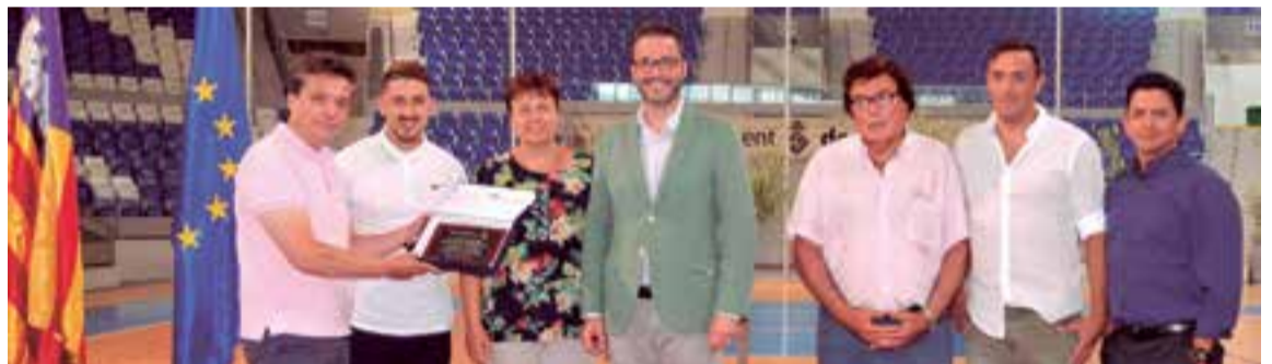
Reconocimiento del Ayuntamiento de Palma a Baleares Sin Fronteras Fútbol Club por su ascenso a Primera Regional