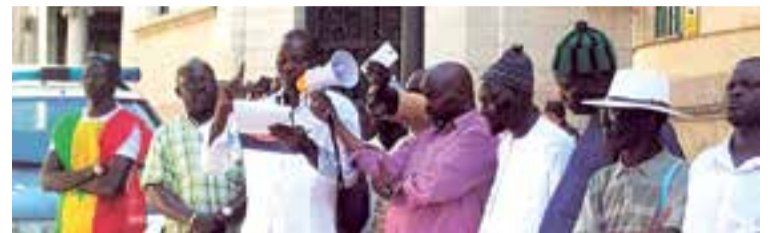
Reivindicaciones de derechos sociales de los senegaleses en Palma

Desde YAPO se denuncia la situación de muchos senegaleses: “hace tres años para regularizar su situación administrativa, salir de la calle y buscar oportunidades de trabajo en otros ámbitos legales, los vendedores ambulantes debían presentar un expediente de solicitud de residencia y trabajo a la oficina de extranjería”, no obstante, añaden que