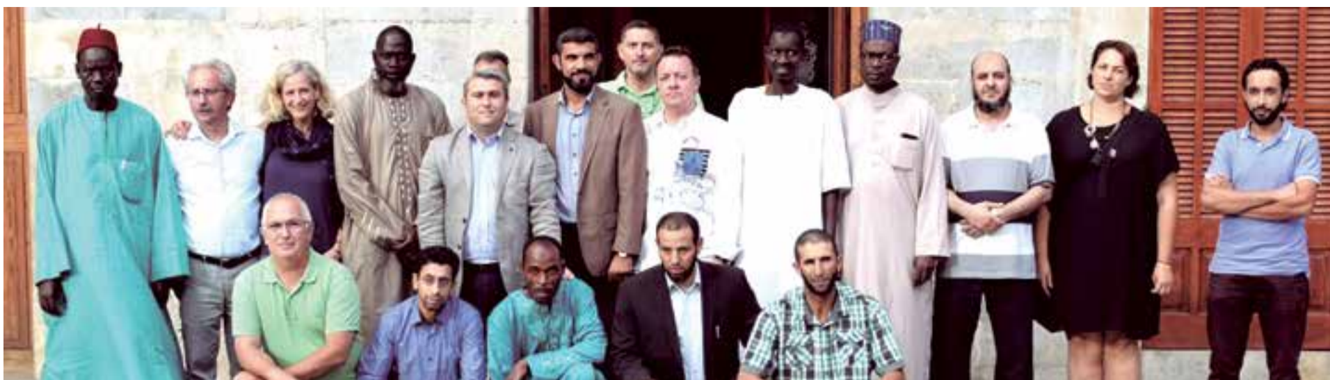
El equipo de gobierno de todas las formaciones políticas del ayuntamiento de Inca junto con las asociaciones musulmanas residentes en el municipio