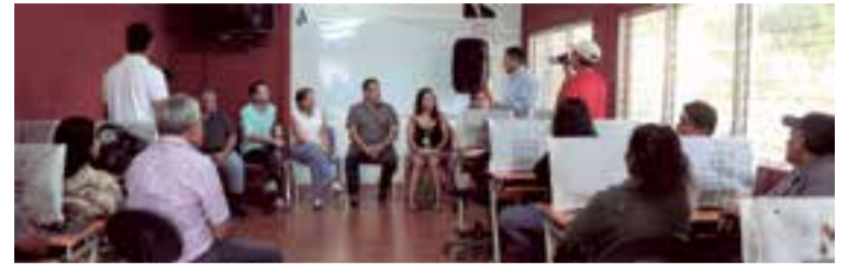
Las autoridades del Consell en Nicaragua evaluando los proyectos de ayuda

Y es que el tejido social de las zonas donde se ha trabajado conjuntamente