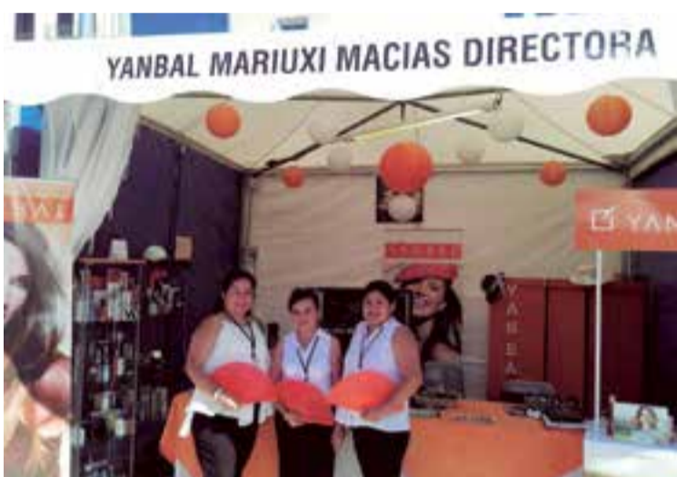
Tercer año consecutivo de Yanbal ofreciendo productos de belleza