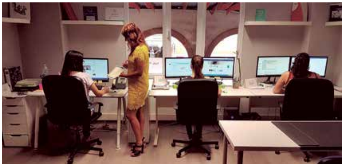
En las dependencias de European Quality Business durante los masters de diferentes áreas

SP: Efectivamente, sirve justamente para dar una mayor profe-