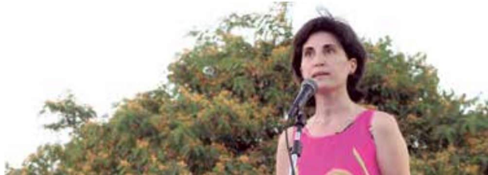
Antonia Martí, regidora de Salud y Consumo del Ayuntamiento de Palma durante el discurso