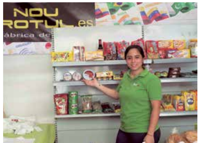
BIP Latino haciendo presencia con su gama de productos alimenticios