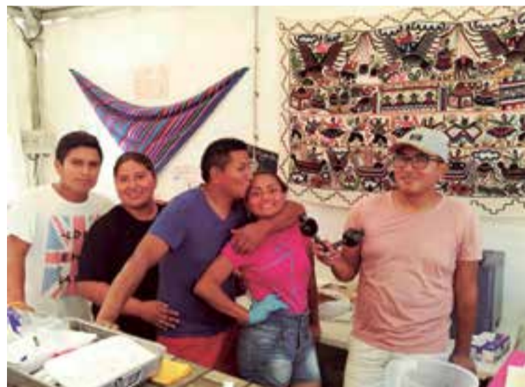
Leños Parrilla fue uno de los stands con mayor presencia de clientes