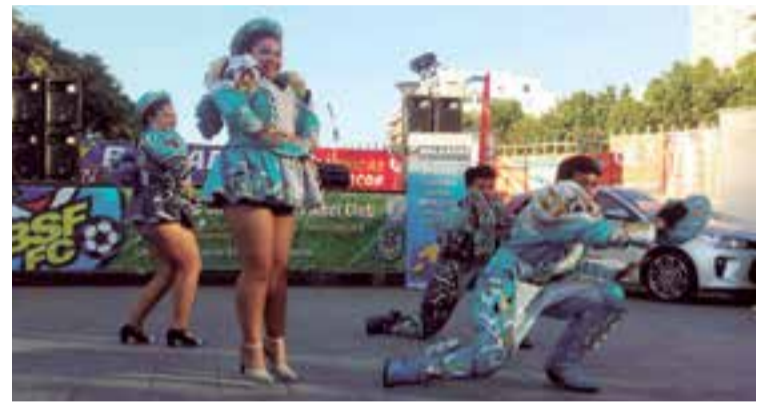
Caporales San Simón de Bolivia bailando en la última jornada de la feria