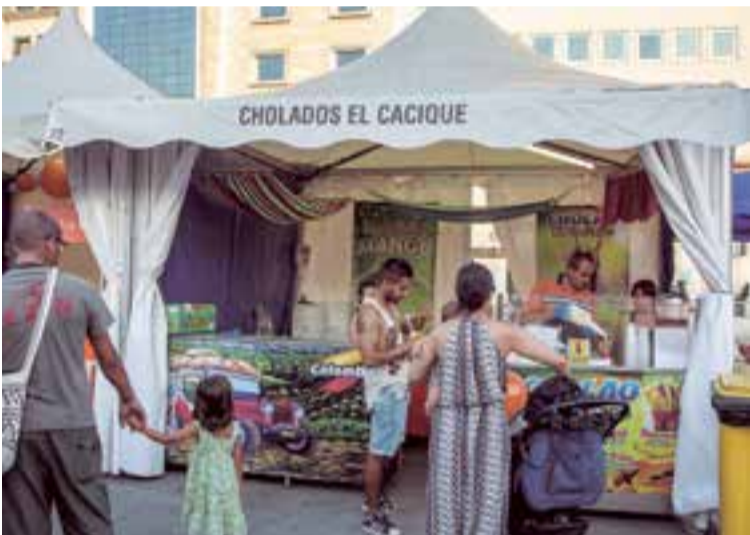
Uno de los stands con mayor demanda de público, el tiempo lo ameritaba