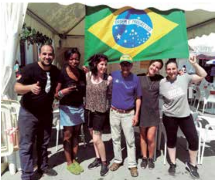
Café del Parque representando a la gastronomía de Brasil

En Salas [&] Cerdà somos, también, expertos en Derecho de Extranjería.