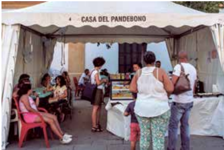
La Casa del Pandebono, estuvo por primera vez en el evento

tantes en la feria fue BIP Latino, que le ha apostado a ofrecer a su público una variedad de alimentos y bebidas de los diferentes países de Latinoamérica ●