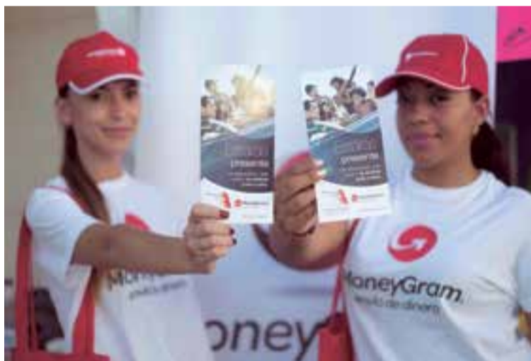
Dos promotoras de Moneygram, debutantes en la feria