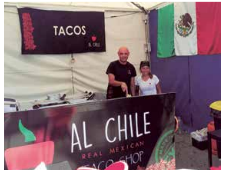
La gastronomía de México regresó después de tres años de ausencia