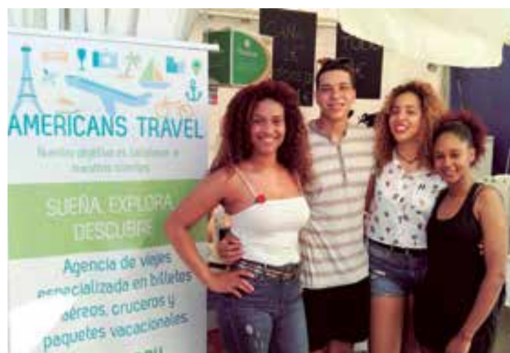
Alegre el equipo de Americans Travel por primera vez en la feria

La carnicería Al Gusto y Cárnicas Manacor, la Lavandería 1,2, 3, el Restaurante Mesón las Columnas, la Discoteca Palante Music Club, PCB Pensiones y Frau Automoviles Concesionario Oficial de Kia en Mallorca, que exhibió uno de los coches del año, también hicieron parte de la VI Feria de Comercio Latinoamericano de Palma ●