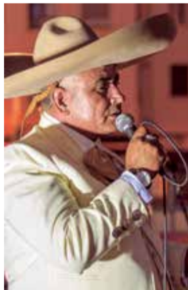
Charro Barraza, mariachi chileno