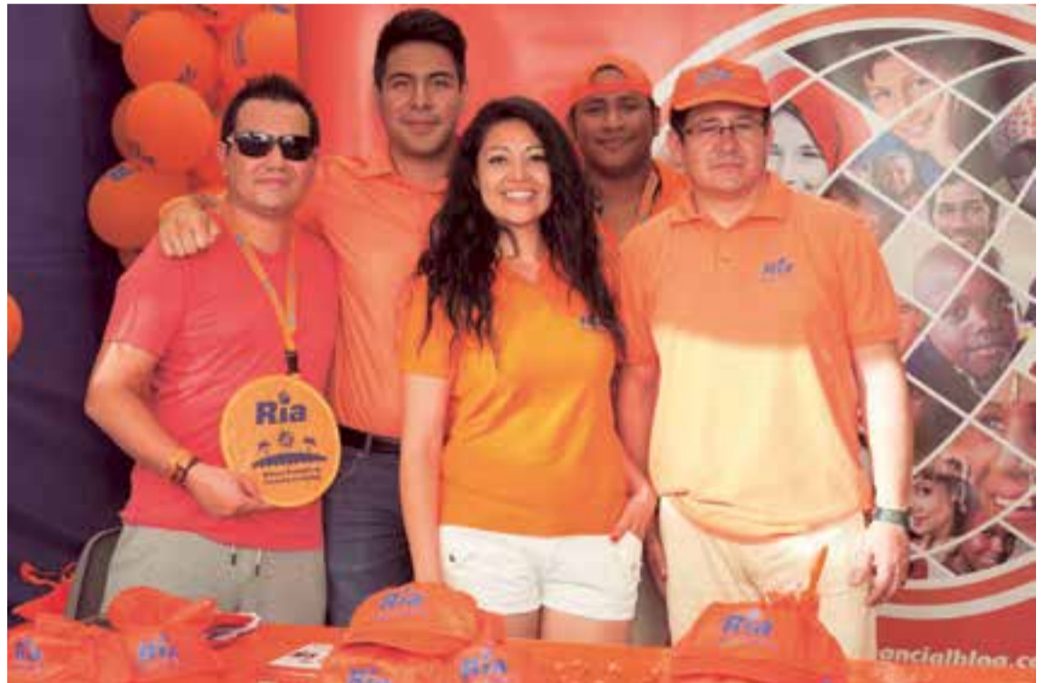
Ria Envíos de Dinero España, uniformidad, sobriedad y arduo trabajo de promoción de la marca durante la feria

Una delegación de Ria Envía de dinero viajó desde Madrid a Palma, mientras que destaca la activa participación de Lycamobile