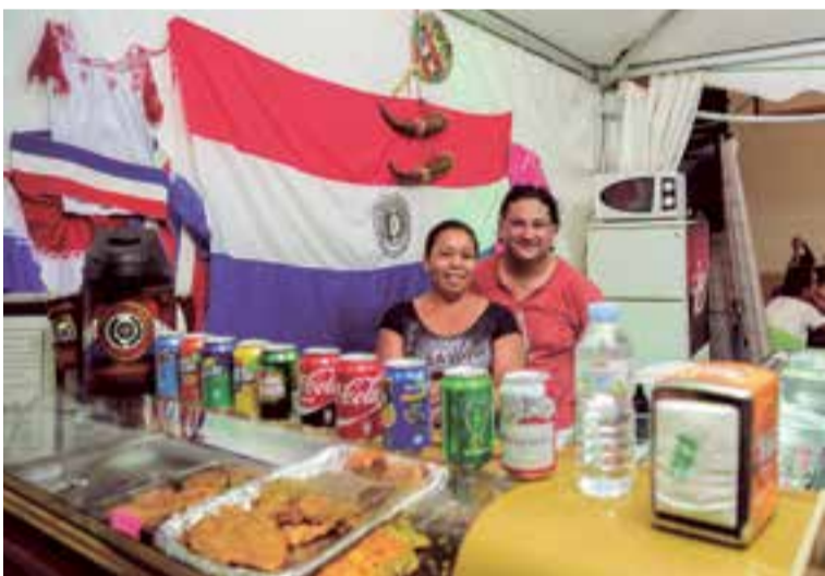
La comida paraguaya por primera vez en la VI Feria de Comercio