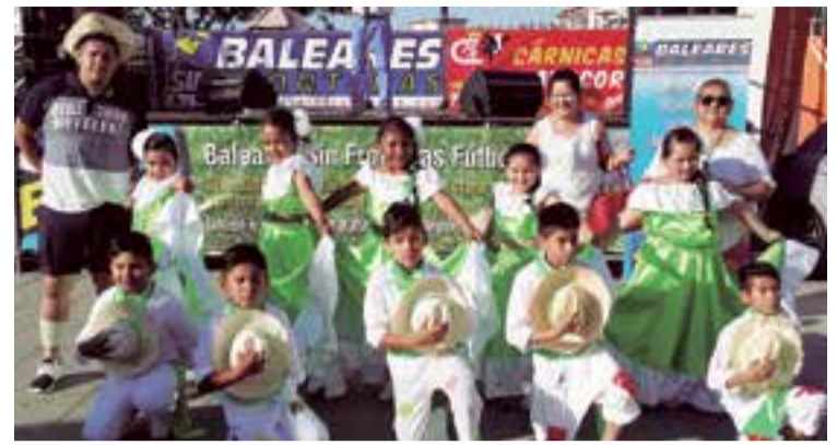
Los niños de Bolivia, Cambitas Vagos en la presentación del domingo 18