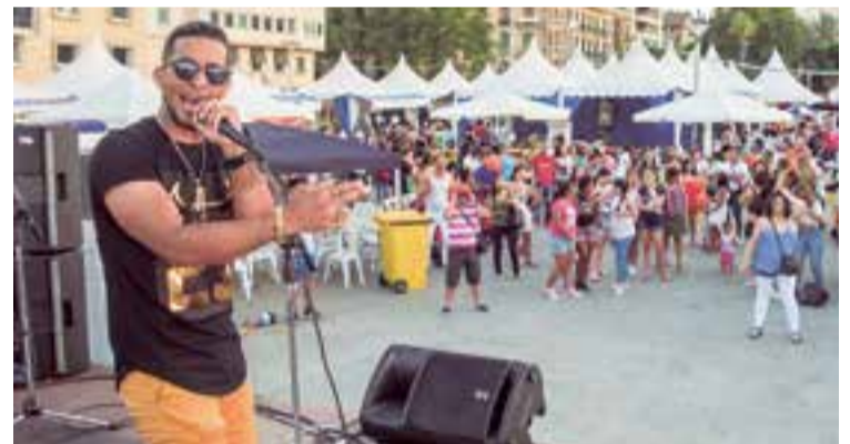
The Rey, artista dominicano, abrió el ciclo de presentaciones