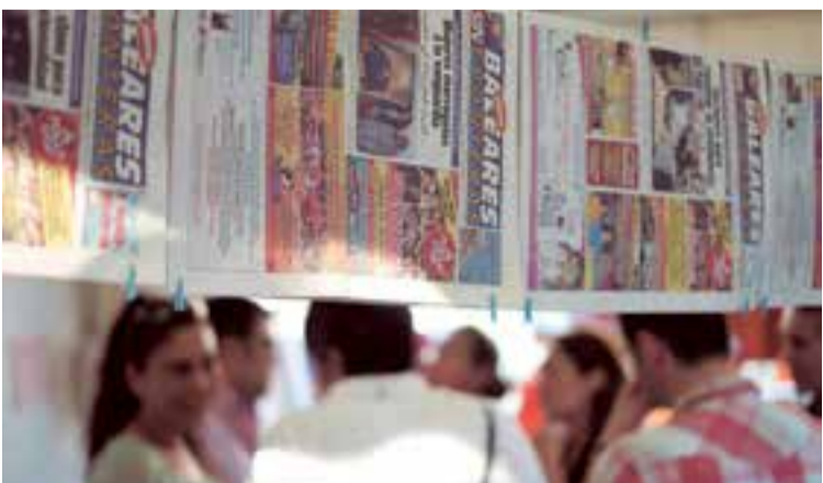
Uno de los elementos decorativos utilizados en el stand organizador de BSF