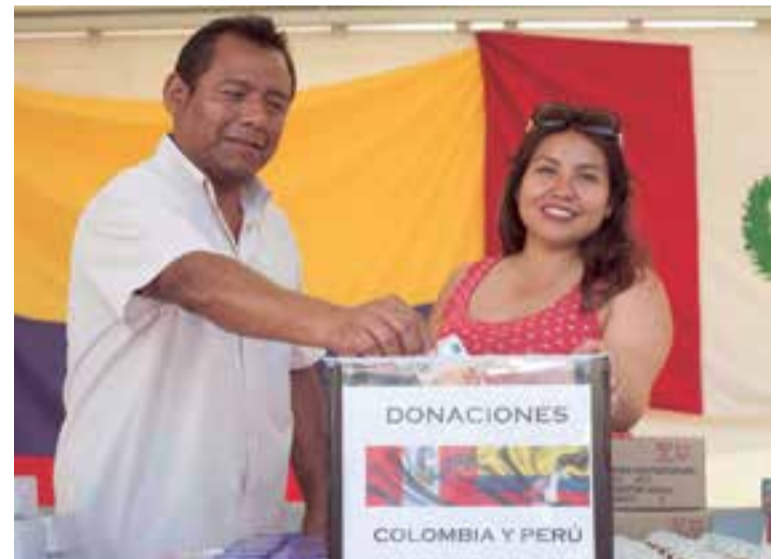
Perú y Colombia, unidos a la distancia por una causa solidaria

La diferente oferta gastronómica giro en torno de países como Bolivia, Colombia, Ecuador, Brasil,