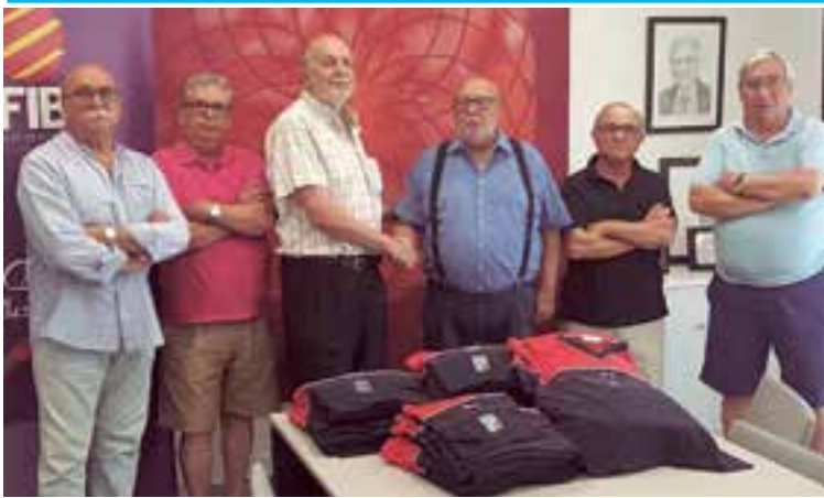
Implementos deportivos serán llevados a Chimbote, Perú