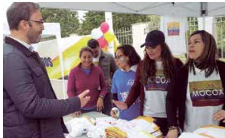
El 28 de abril los colombianos recogieron fondos para los damnificados de las riadas de Mocoa, Putumayo. Algunas autoridades asistieron