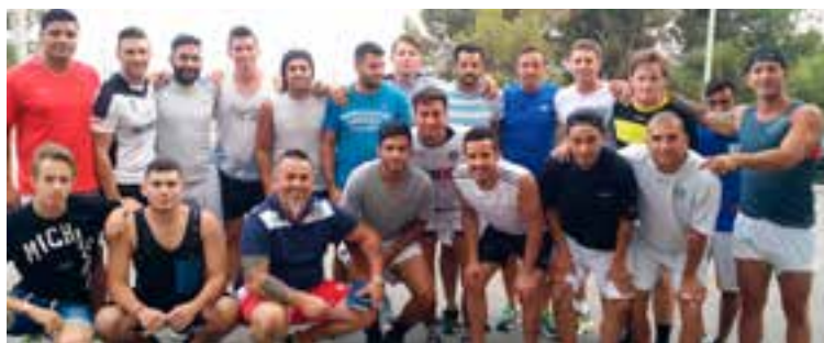
Baleares Sin Fronteras FC prepara entusiasta su debut en primera regional.

Por su parte, Baleares Sin Fronteras Fútbol Club esta temporada apostará por la base de jugadores que obtuvieron el pasado título de liga de Segunda Regional. El equipo inició los trabajos de pretemporada el pasado 20 de julio realizando físico de playa y acondicionamiento integral en varios espacios deportivos de Palma.