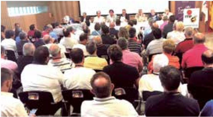
Reunión en la que la FFIB aprobó la gestión y previsiones presupuestarias.