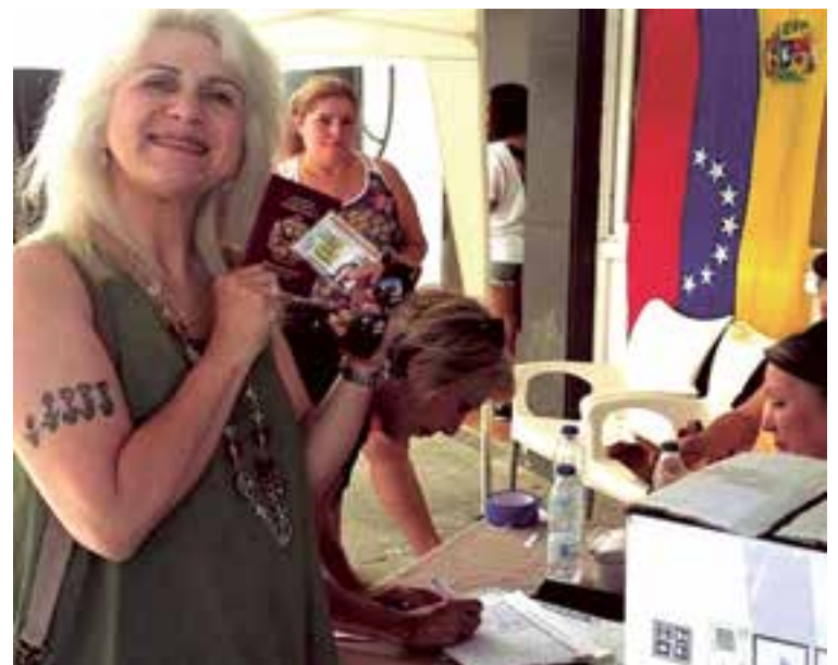
Una votante muestra su entusiasmo al participar en la consulta.

En declaraciones a este periódico, Quintero aseguró que la consulta de los venezolanos jamás se puede comparar con lo que vive Catalunya. "En Venezuela el pueblo está luchando por la reivindicación de los derechos humanos, lo de Catalunya es un tema muy diferente" ●