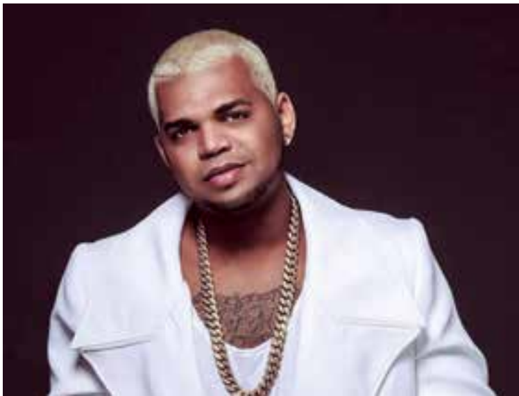
Emmanuel Reyes, conocido artísticamente como El Mayor Clásico.