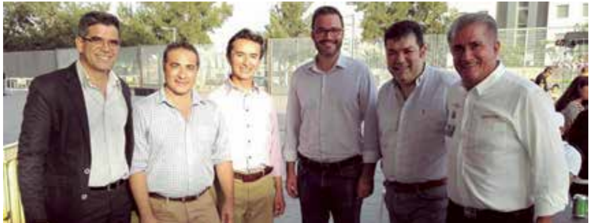
Autoridades del Ayuntamiento de Palma junto a los cónsules de Colombia, Argentina y la organización del evento

Algunos cónsules latinoamericanos y autoridades de la Isla se hicieron presentes sobre las 19h. La fiesta que comenzó sobre las 12am con los castillos acuáticos para niños y la degustación de gastronomía de Colombia y otros países latinoamericanos terminó con una estruendosa ovación de los asistentes." ●