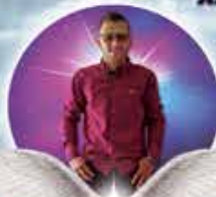
EL PORTEÑO DE LA CANCIÓN