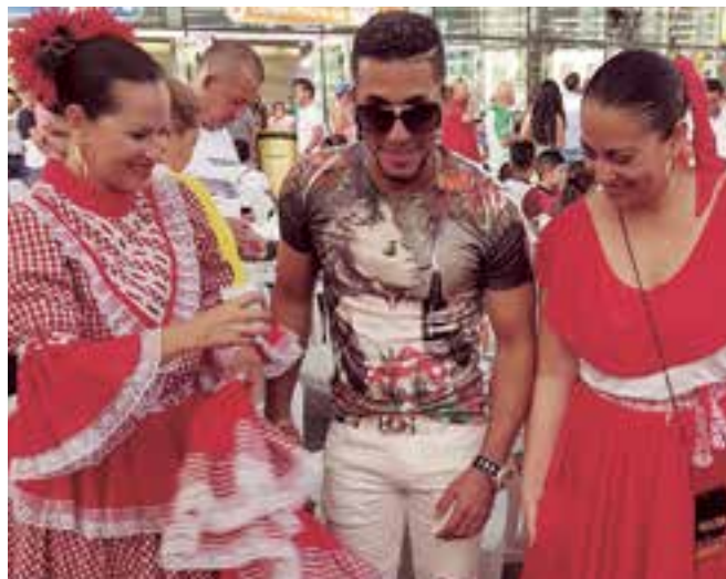
"The Rey" acompañado por dos integrantes de Pregón de Colombia