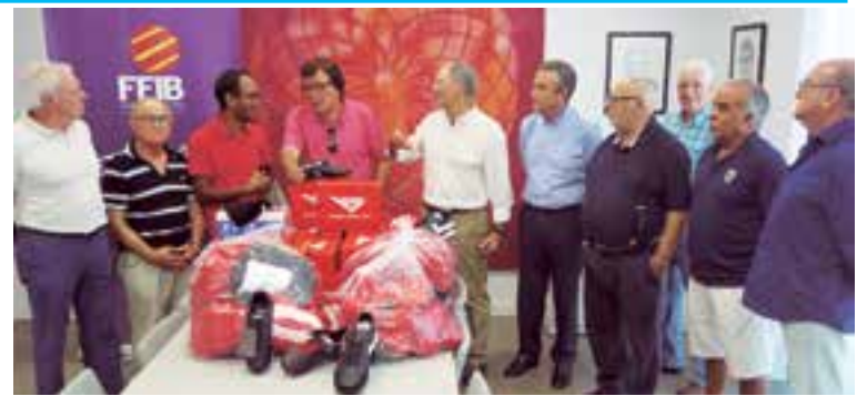
Entrega del material deportivos para los refugiados que están en Palma

Actualmente en el Albergue residen unas cincuenta personas exiliadas, y otros han sido