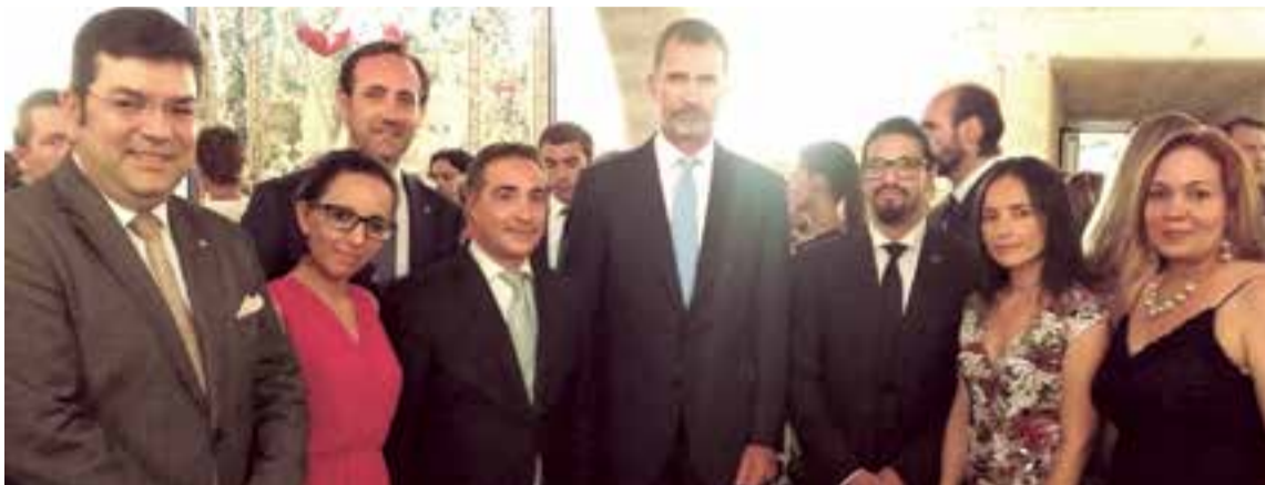
El Rey Felipe VI junto a algunos cónsules de Latinoamérica, detrás el senador, José Ramón Bauza

En esta ocasión alguna parte del cuerpo consular de Latinoamérica, incluyendo Marruecos, tuvieron una conversación grupal con el Rey Felipe