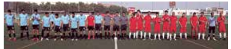
Un centenar de personas viendo el partido de la final, Argentina vs Colombia