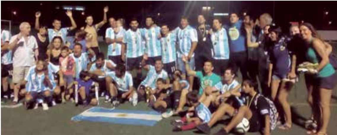
Acompañados de familiares y amigos los argentinos celebraron el título obtenido en Son Oliva