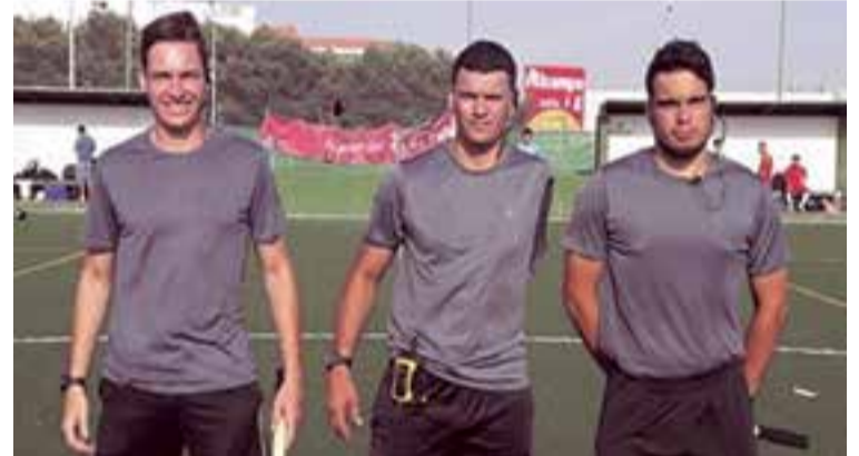
Los tres árbitros que a lo largo del torneo impartieron justicia. En la imagen del medio, el previo al partido Uruguay vs España

En Salas [&] Cerdà somos, también, expertos en Derecho de Extranjería.