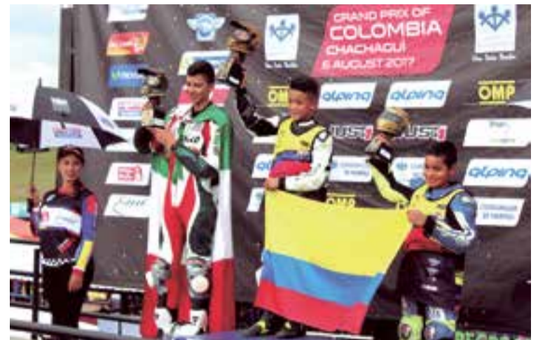
No es de extrañar verlo en el podio en las competencias de alto nivel

Sus progenitores han aprovechado el espacio de este artículo dedicado a su denodado esfuerzo