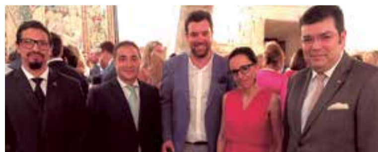
Los cónsules junto al alcalde de Palma, Antoni Noguera.