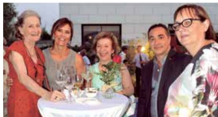
Políticos, empresarios y representantes de asociaciones en el acto del 18 aniversario de entronización del Rey Mohamed VI. El evento tuvo lugar en el domicilio de la cónsul de Marruecos