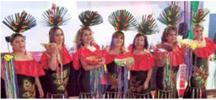
El grupo de danzas, Intrépidos Soñadores