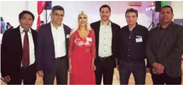
Los miembros del jurado antes de dar el veredicto de las tres finalistas