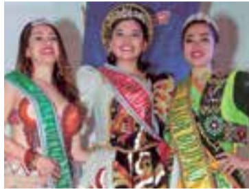
La flamante reina y sus princesas.