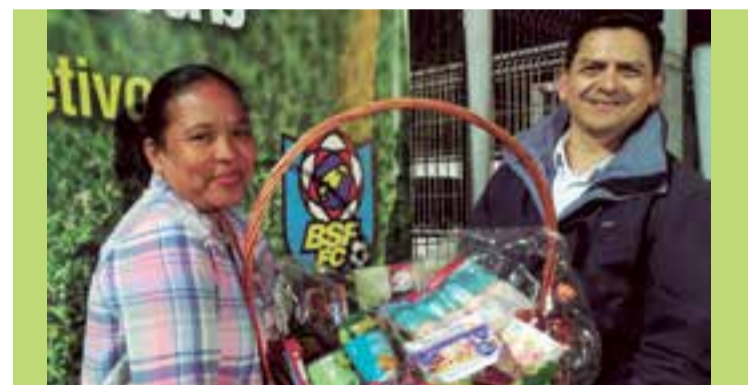
Ganadora de la cesta de Nueva Tierra

Desde la redacción de este periódico agradecemos el gesto de Montaura de no cobrar entrada a nuestra afición este sábado 14 de abril. Clubes amigos compartiendo varias temporadas, la mayoría de ellas en segunda regional, ahora ambos nos hemos estrenado en primera en este 2017-2018 ●