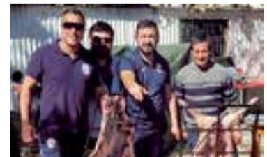
Club de Fútbol "Los Troncos"

EQUIPOS: SPORT PARAGUAY, ESPAÑA VIVANCOS, CAFETEROS, DEPORTIVO CALI, G.M. CARS, TOQUE Y SON, MAS DE LO MISMO, COLOMBIA ALCUDIA, PERU BALEAR, LA MAQUINA NUEVA, FANIA ALL STAR, LOS TRONCOS, TOLDOS ALARCON, EL DRAGON CIUDAD, LIGA DE QUITO, LA JUVENTUD, LA MAQUINA, TALLERES EL RAYO, PATACONES F.C, CAZAFANTASMAS, SPORT ANCON, LA RESACA CELESTE, GUAYAQUIL 100%, CERVECEROS FC.