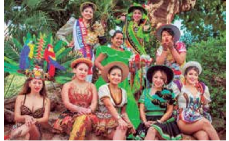
Diversos planos de las reinas en el paisaje natural de Mallorca

en varios reinados, se quedó con el tercer lugar.