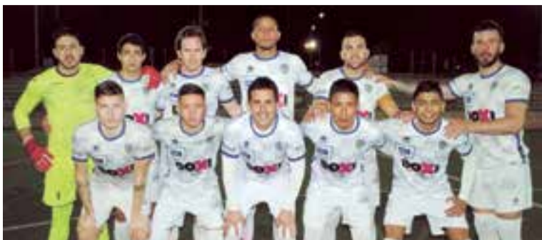
El equipo de BSF FC, siempre dando lo mejor de sí.