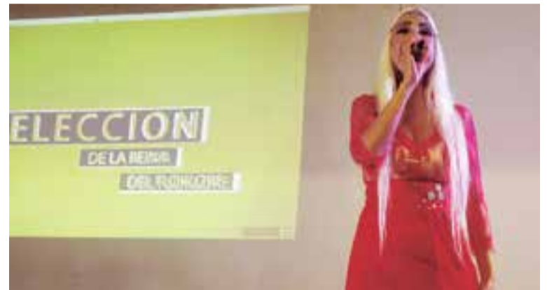
Además de actuar como jurado, la cantante uruguaya Adriana Santana hizo gala de su talento musical para deleite de todos los presentes.