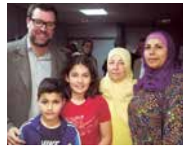
El alcalde de Palma junto a miembros de una familia siria.

Otra de las peticiones de madres de familia de origen africano se centraba en la falta de convocatorias para cursos de idiomas. “Nos cuesta ayudar a nuestros hijos en sus deberes, no dominamos ninguno de los idiomas de Baleares”, decía una representante de Nigeria a lo que Noguera advertía que era imprescindible el aprendizaje de las dos lenguas oficiales, “desde el Ayuntamiento debemos hacer un esfuerzo para que en los barrios hayan espacios de formación para el aprendizaje de las lenguas a través de dife-