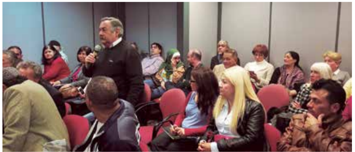
Dos momentos del intenso tiempo de debate que se prolongó por dos horas y media.