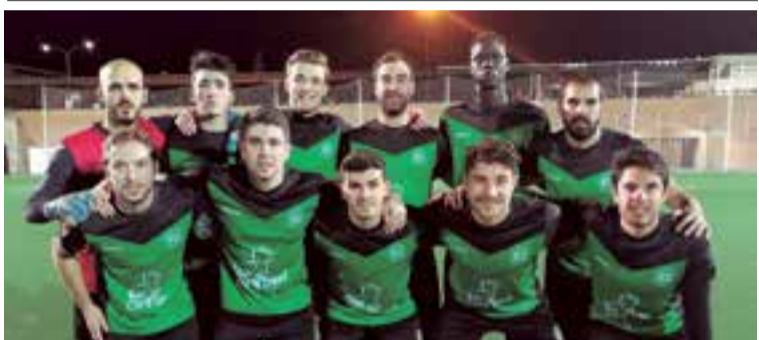
Montaura, el rival de Baleares Sin Fronteras FC, este 14 de abril