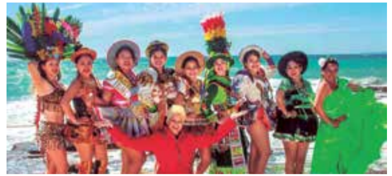
Las reinas con sus trajes típicos en un trabajo de fotografía en la playa