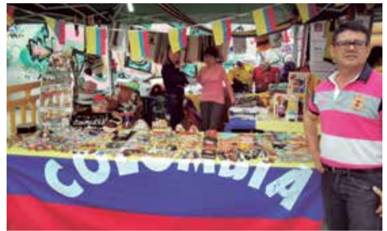
Música, animación y tradicionales productos de Colombia.