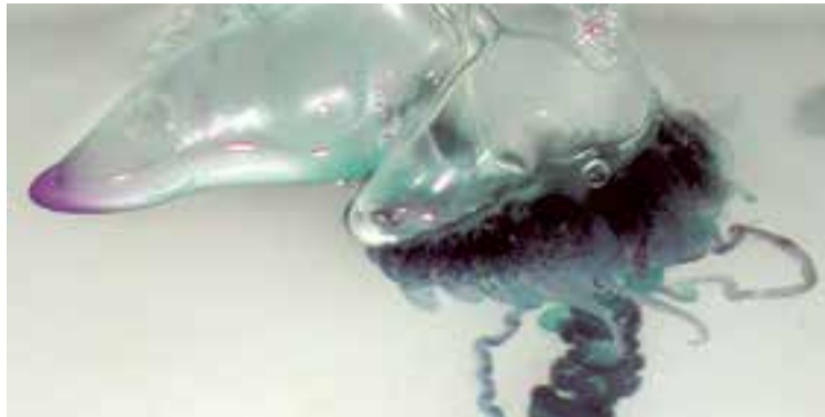
Physalia physalis es el nombre científico de la peligrosa carabela portuguesa

El lunes 21 de mayo al atardecer un vecino del Molinar localizó unos restos que posteriormente se identificaron como pertenecientes a un ejemplar muerto del hidrozoo y posteriormente el Servicio de Playas del Ayuntamiento activó el pro-