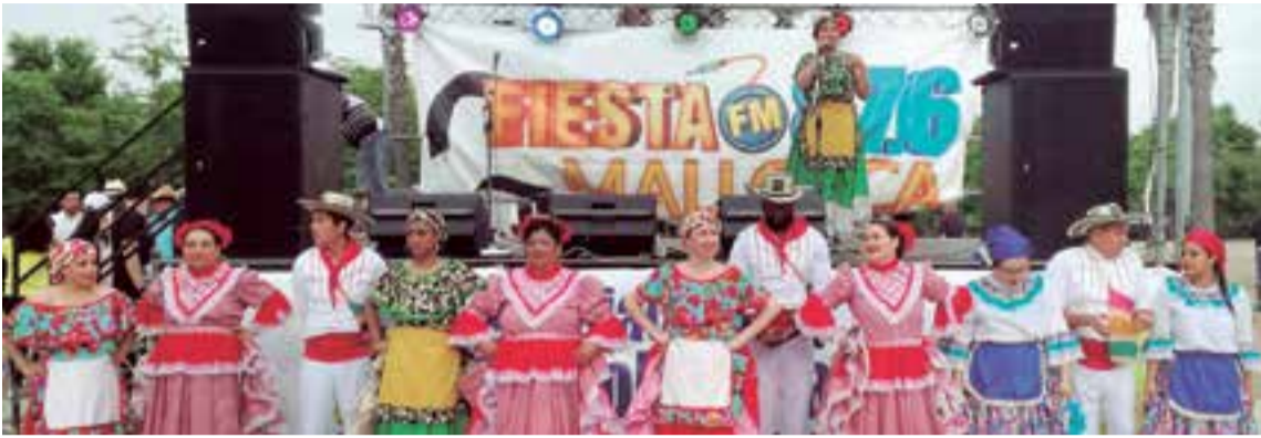
Numeroso público pudo disfrutar de una jornada de actividades artísticas y recreativas para todas las edades.