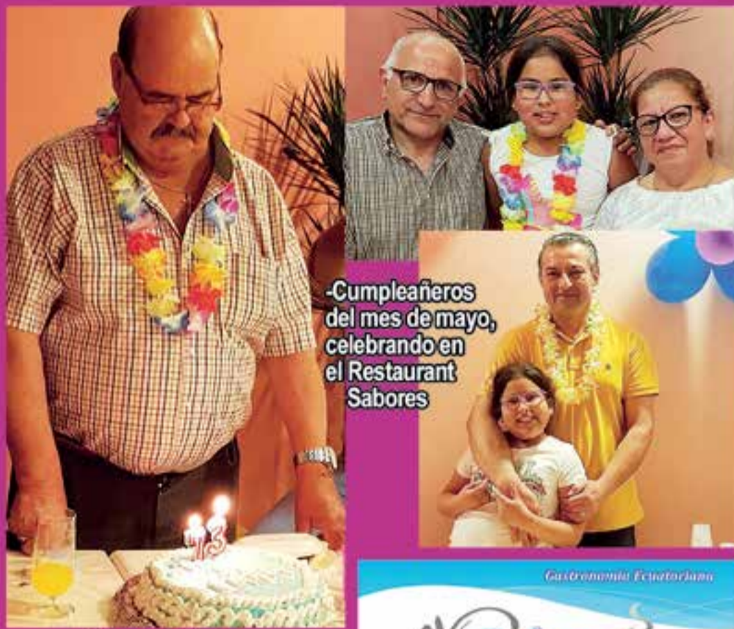
-Cumpleañeros del mes de mayo, celebrando en el Restaurant Sabores

Por ello, no lo olvidéis, en caso de divorcio acudid rápido a un profesional, o existe riesgo de perder la autorización de Residencia en Régimen Comunitario ■