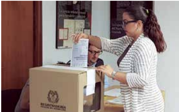
Una de las primeras votantes en el Consulado de Colombia en Palma

Las votaciones para los que tienen inscrita su Cédula de Ciudadanía comenzaron desde el pasado 20 de mayo