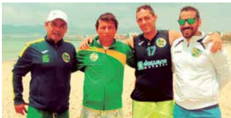
Artífices de Aldosivi Mallorca en un fraternal encuentro en la Playa de Palma

A la velada que fue en el Restaurante Binicomprat de Algaida (Mallorca) asistieron los jugadores con sus familias, patrocinadores y el regidor del Ayuntamiento de Palma,