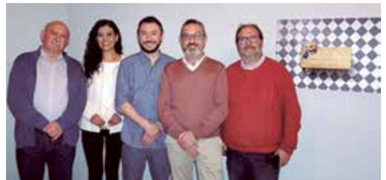
Autoridades locales en la presentación de la exposición de Ubilla

La muestra estuvo organizada por el Grup Fotogràfic Digital de les Illes Balears, además cuenta con el apoyo del Consell de Mallorca, de la Federació de Associacions Fotogràfiques de les Illes Balears (FAFIBA) y de la Confederación Española de Fotografía ●