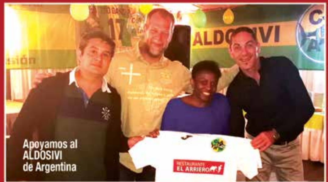
Apoymos al ALDOSIVI de Argentina

Por tanto, para poder recuperar la tarjeta será necesario en primer lugar haberse certificado la extinción de la anterior por parte de la oficina de extranjería correspondiente, y por tanto si el extranjero ya se encontrara en España deberá volver a su país, después de extinguir la misma, para hacer efectivo el correcto proceso de recuperación ●