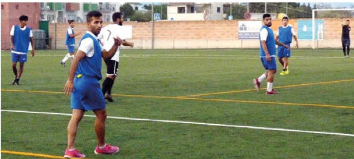
El Pla de Na Tesa de preferente fue uno de los rivales de la pretemporada