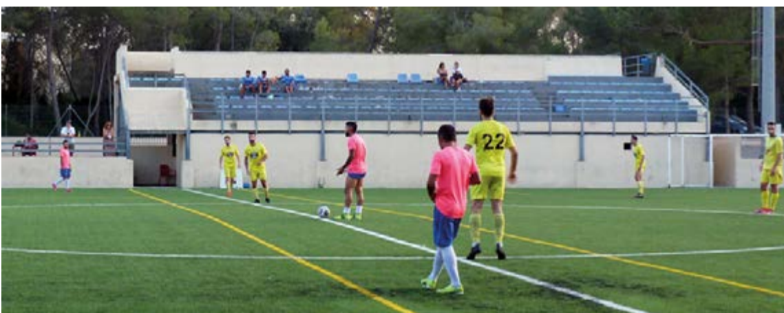
Antes de comenzar la liga, el equipo jugó diez partidos amistosos, uno de ellos frente al p0rtol de primera regional