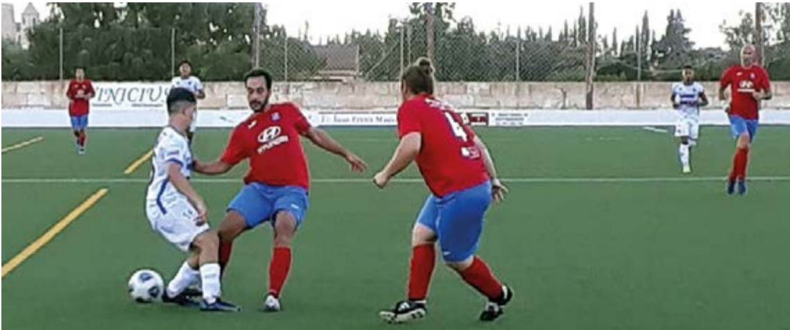
Baleares Sin Fronteras FC comenzó con pie derecho en segunda regional ganando 1-2 al Margaritense

Aficionados al fútbol, prepárense para una temporada de aúpa. El fútbol federado ha vuelto una temporada más y lo que no hay duda es que habrá sorpresas ●