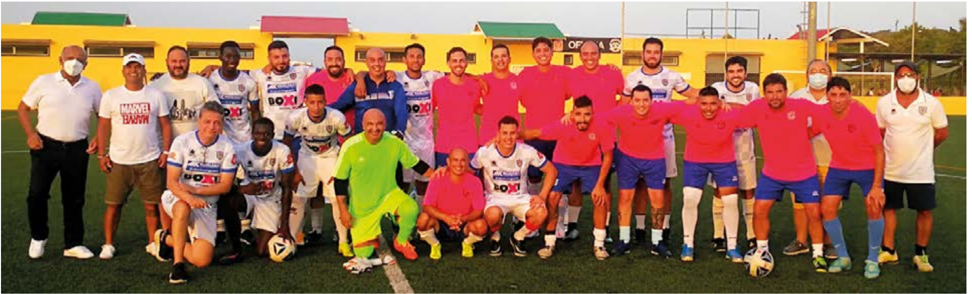
El pasado 22 de agosto el Baleares Sin Fronteras Fútbol Club rindió un homenaje a sus viejas glorias de la generación fundadora del 2009/2010.

Partidos amistosos, torrada y confraternidad entre viejos compañeros marcaron un inolvidable reencuentro