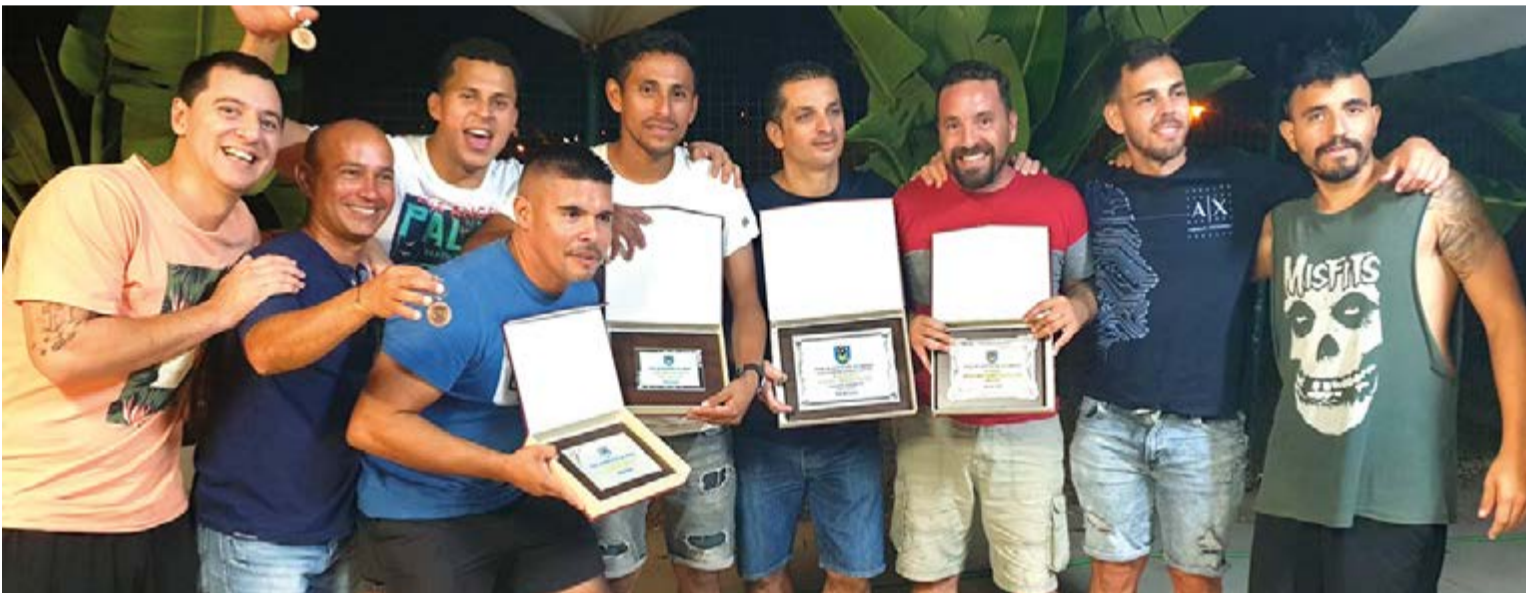
Algunos jugadores fundadores del equipo muestran las placas como reconocimiento a su aporte