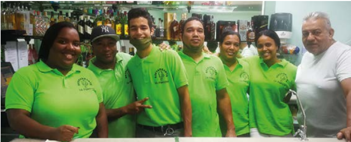
El equipo de trabajo del restaurante “La Pantera”, localizado en la calle Francesc Suau, 12, Palma

Desde el pasado 16 de abril funciona con éxito este restaurante latino que ha tenido gran acogida