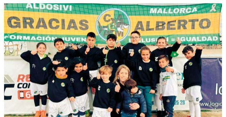
Escolta del Club Atlético Aldosivi de Mallorca presente en el último partido frente al At. Paguera ‘A’

Una incorporación, bien como entrenador o como director deportivo, que ayudará a mejorar el nivel de un equipo que lleva dos temporadas en el fútbol federado gracias a su experiencia en el fútbol profesional sudamericano conocido como ‘El hombre de los cuatro ascensos’ ●