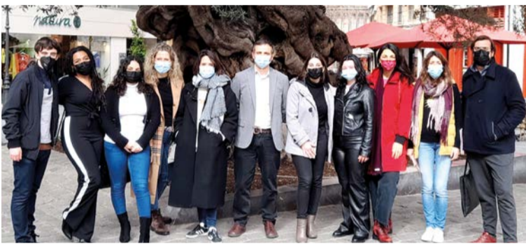
El Área de Educación y Política Lingüística organiza una campaña para fomentar el catalán entre los inmigrantes residentes en Palma