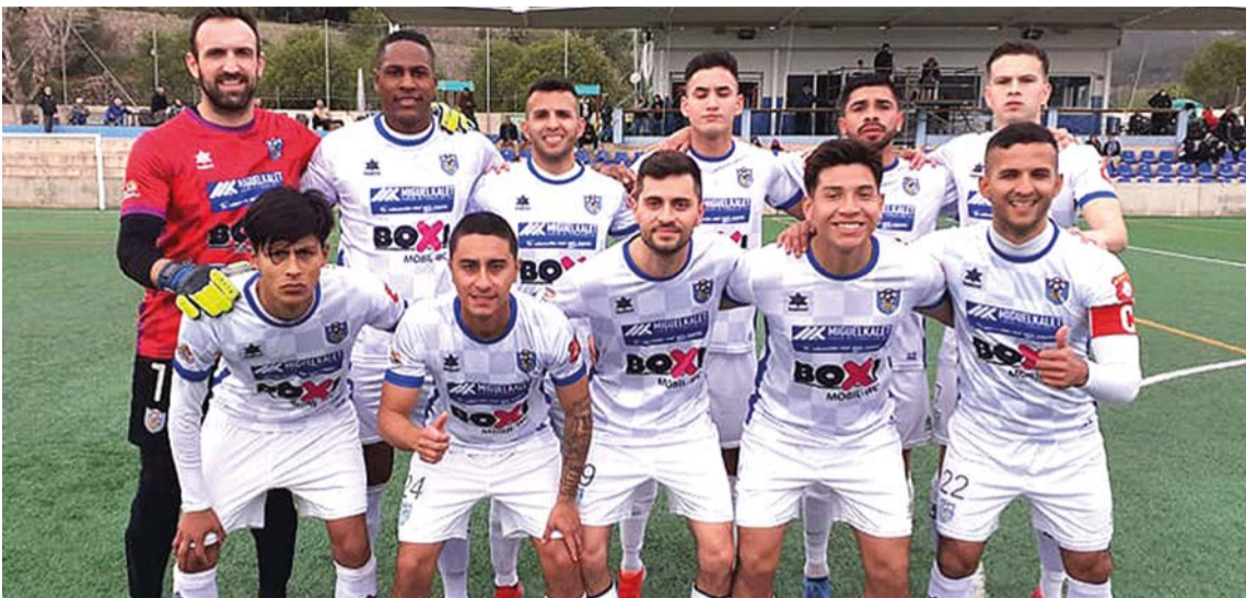
Alineación titular del BSF FC frente al Andratx 'B'