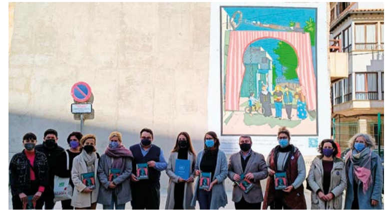
La obra de gran formato representa una ilustración del cómic "Halima. Derribando muros. Historietas de mujeres valientes en Cisjordania"

De esta forma, AMADIBA ofrecerá a los jóvenes inquers información y orientación, ayudándoles en la búsqueda y la obtención de trabajo. A través de dicho programa, los técnicos llevan a cabo un proceso de soporte individual y acompañamiento en el desarrollo de