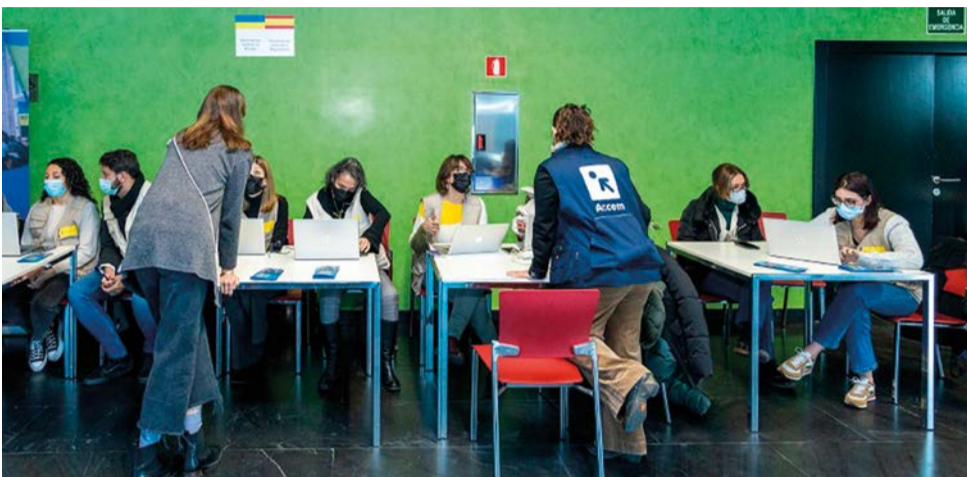
Más de 1.800 llamadas atendidas en el teléfono para desplazados de Ucrania

Más del 40% de las personas atendidas son menores y, entre los adultos, la mayoría son mujeres