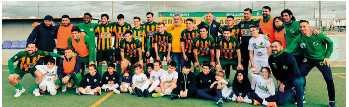
El último partido frente al At.Paguera ‘A’ en el campo del Rotlet-Molinar. “Si Dios quiere pelearémos hasta la última jornada. Este próximo fin de semana nos enfrentamos al Cala d’Or (cuarto clasificado) y tenemos una oportunidad para distanciarnos más y coger confianza para el tramo final de liga”, comenta el presidente de Aldosivi de Mallorca.