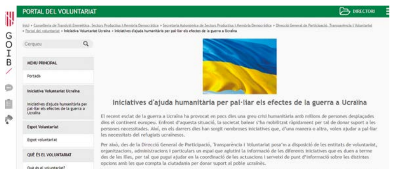
Captura de pantalla del portal del voluntariado