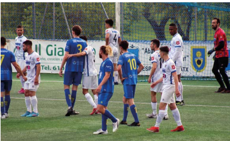
Una jugada del partido del BSF FC frente al Andratx 'B'. Foto Antonia Rigo. CE Andratx