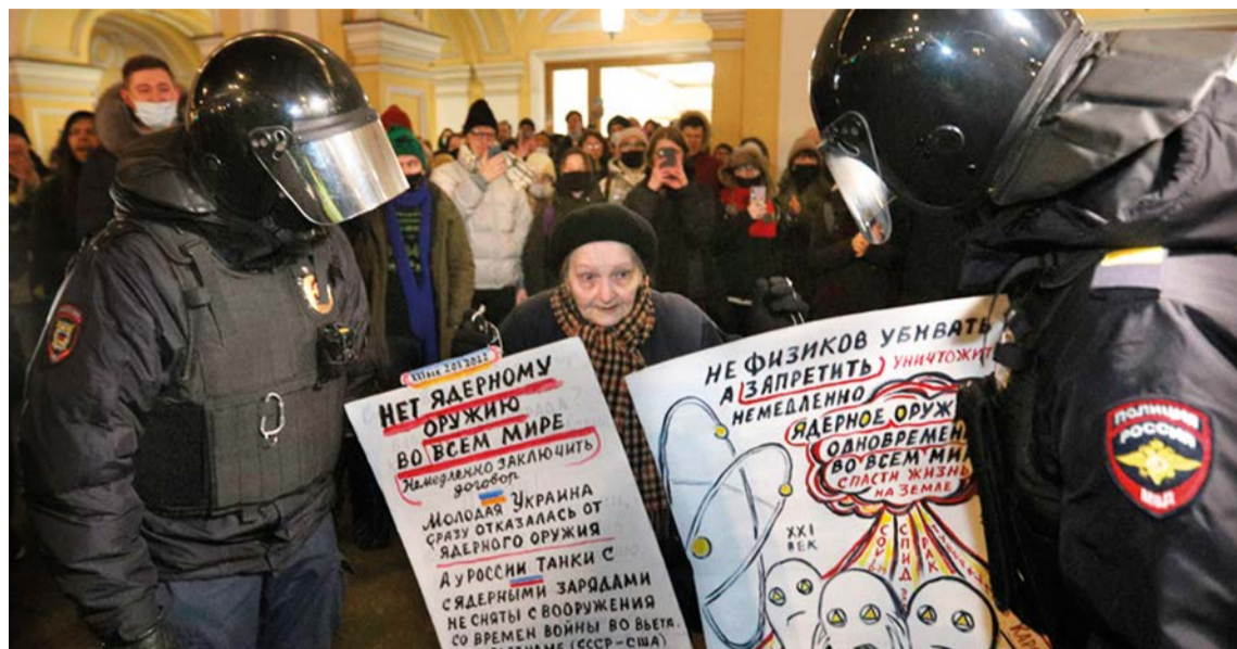
Fuerzas y cuerpos de seguridad rusos deteniendo a manifestantes contra la guerra en San Petersburgo

“Las autoridades rusas llevan 20 años librando una guerra encubierta contra las voces disidentes practicando arrestos de periodistas, tomando medidas drásticas contra salas de redacción independientes y obligando a propietarios de medios de comunicación a imponer la autocensura. Sin embargo, tras la entrada de los tanques rusos en Ucrania, las autoridades han pasado a una estra-