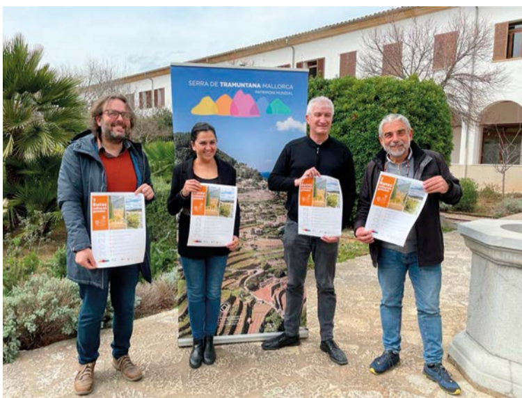
Presentación de la Rutas Culturales 2022