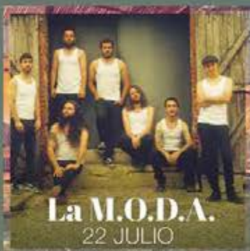
La M.O.D.A. 22 JULIO