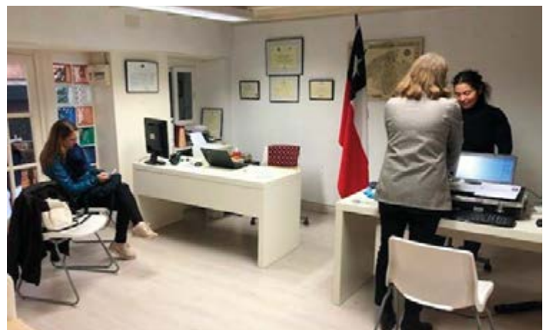
La última vez que estuvo un consulado itinerante de Chile en Mallorca fue en marzo de este año, a la espera de una nueva visita.

El panorama no era nada halagüeño por lo que varias decenas de colombianos manifestaron a las afueras de la Delegación del Gobierno de Palma, calle Constitución, su malestar por quedarse sin servicio consular. La noticia fue reproducida por los medios de