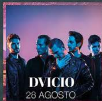
DVICIO 28 AGOSTO