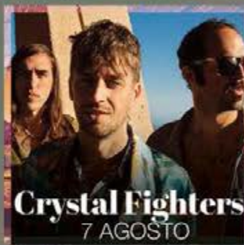
Crystal Fighters 7 AGOSTO