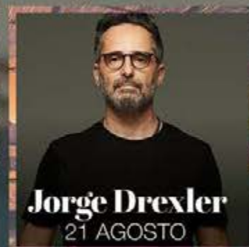
Jorge Drexler 21 AGOSTO