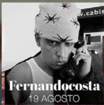
Fernandocosta 19 AGOSTO