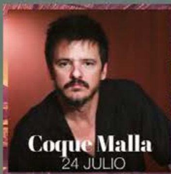
Coque Malla 24 JULIO