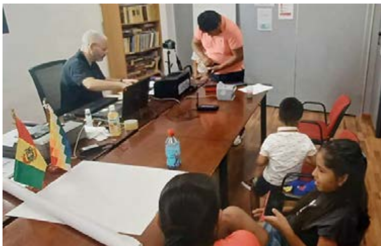
Trabajadores del consulado de Bolivia en Barcelona viajan una vez por mes a Palma a realizar un consulado itinerante

“desde las Islas se encargan de recopilar toda la documentación que los usuarios necesitan y nos la envían por correo electrónico y físico.