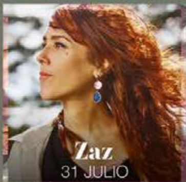
Zaz 31 JULIO