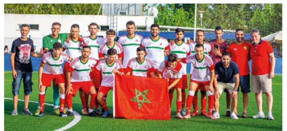
La selección marroquí porta orgullosa su bandera antes del triunfo contra Brasil