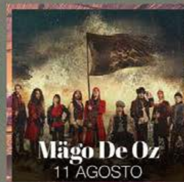
Mägo De Oz 11 AGOSTO