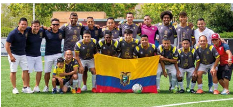
No es el uniforme habitual, pero los ecuatorianos se mostraron superiores a los peruanos, que al final les permitió encaramarse en el liderato del grupo