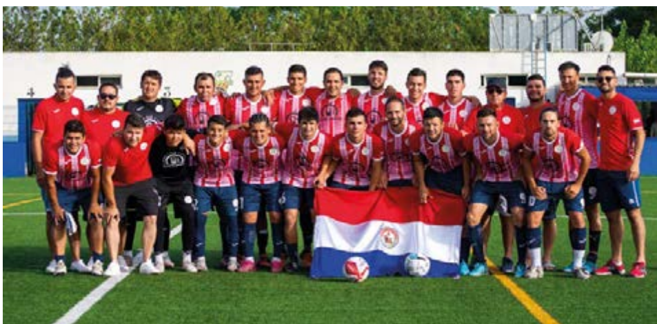
La selección de Paraguay ha ganado tres mundialitos a lo largo de la historia de estas competiciones, este año ha presentado un equipo competitivo