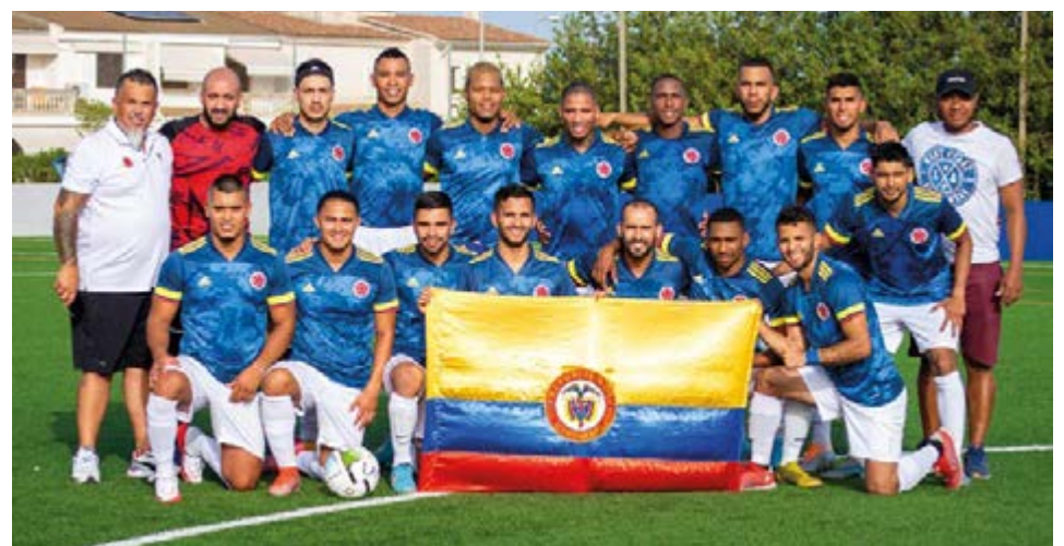
Los colombianos tienen el rotulo de favoritos para ganar este mundialito, sin embargo le empataron a los paraguayos in extremis