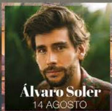
Álvaro Soler 14 AGOSTO