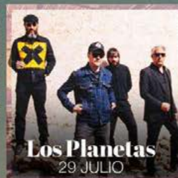
Los Planetas 29 JULIO