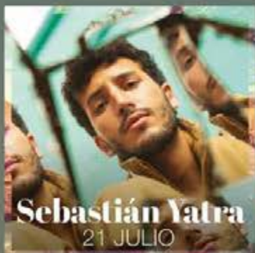
Sebastián Yatra 21 JULIO