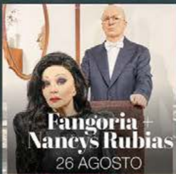
Fangoria + Nancy's Rubias 26 AGOSTO