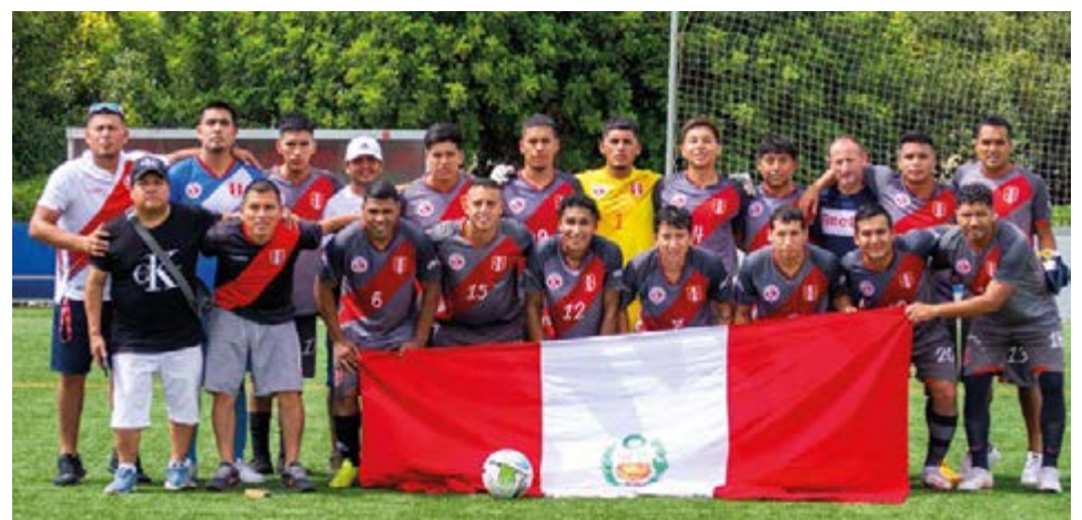
Los peruanos no comenzaron bien, perdieron 3-1 frente a su similar de Ecuador