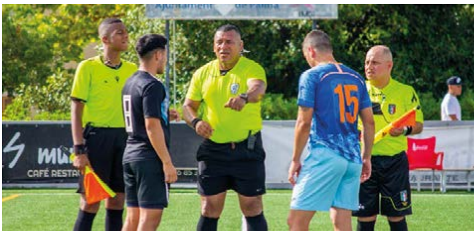
El sorteo del campo antes de dar comienzo al partido entre Resto del Mundo y Argentina

En la próxima edición de Baleares Sin Fronteras daremos cubrimiento al torneo de selecciones sub 40 que paralelamente se juega en este mismo campo ●