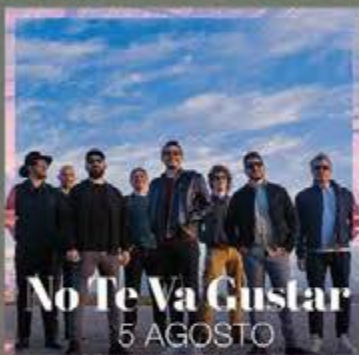
No Te Va Gustar 5 AGOSTO