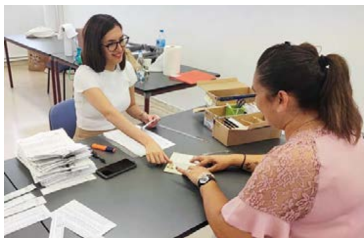
Consulado de Paraguay en Ibiza

Bastaría un ejemplo: de los 13.731 colombianos reportados por el INE, la cifra según el consulado de Palma podría dispa-