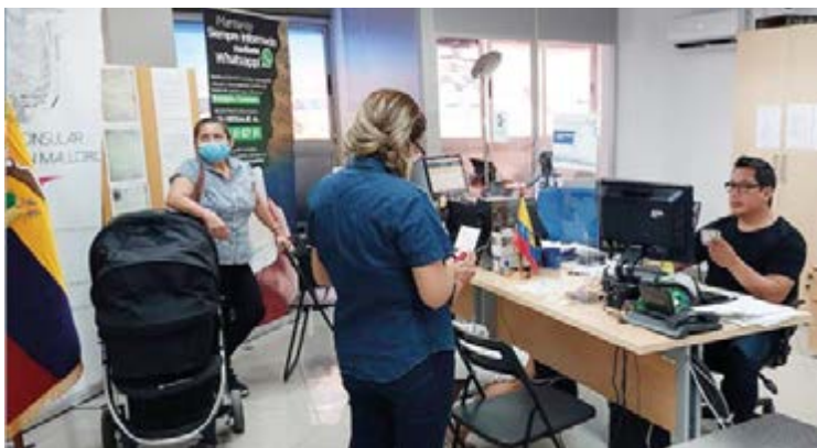
El Consulado de Ecuador en Palma atiende desde el 2008 a sus connacionales ofreciendo todo tipo de trámites