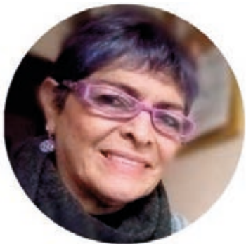
Por Lucía Duque Ríos