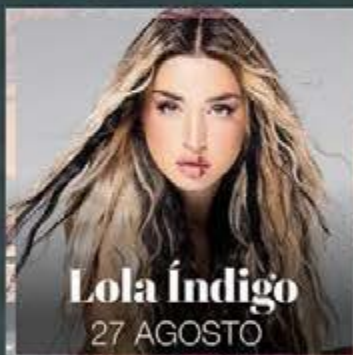
Lola Índigo 27 AGOSTO