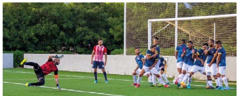
Un tiro libre a favor de los paraguayos que por poco acaba en gol