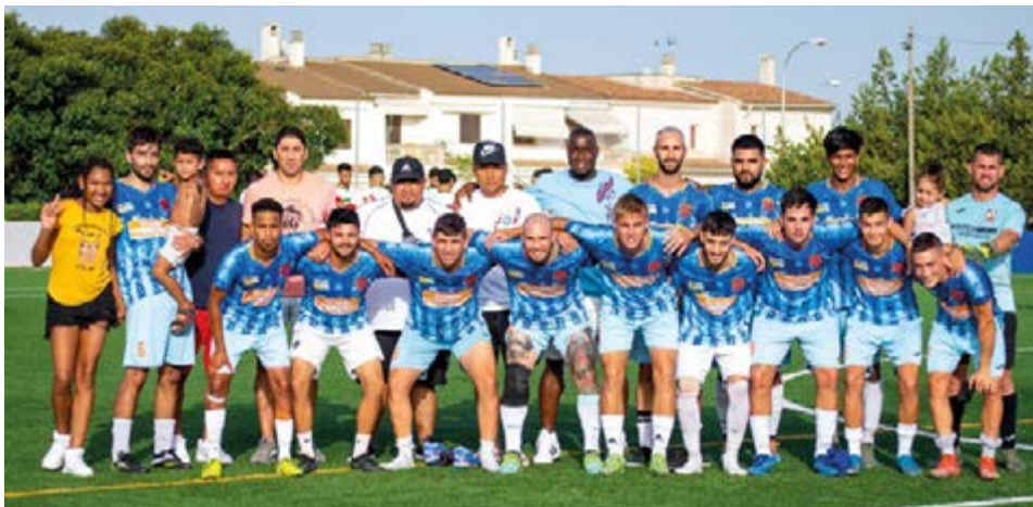
El equipo de Resto del Mundo conformado por jugadores de varias nacionalidades