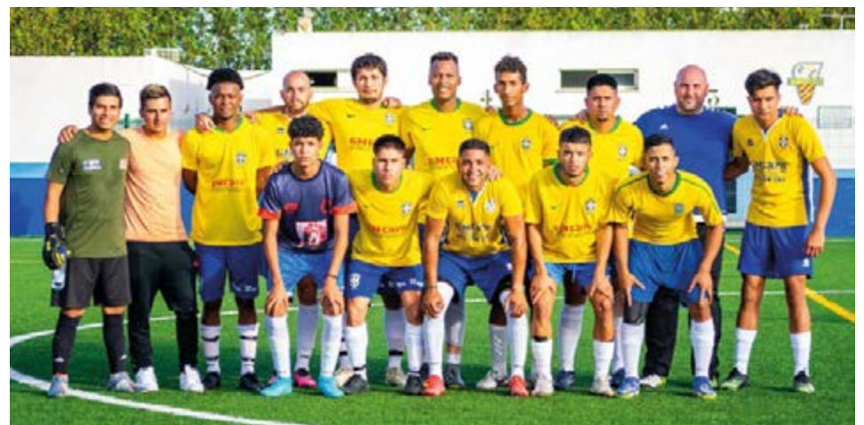
Una improvisada selección de Brasil perdió 1-0 frente a Marruecos