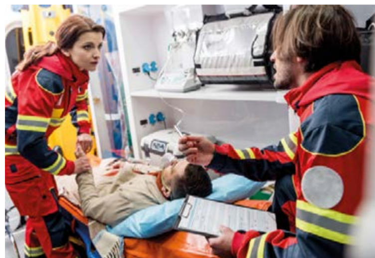
El Centro de Formación Profesional ADEMA ha abierto el plazo de inscripción del curso "Atención sanitaria a múltiples víctimas y catástrofes"

fin de gestionar los recursos disponibles y apoyar a la coordinación en estas situaciones.