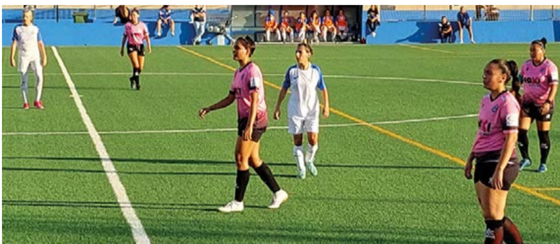
Con un empate en el feudo del Recreativo La Victoria se saldó el debut federativo del Baleares Sin Fronteras F.C. femenino

Un partido ganado por incomparecencia y un empate en las dos primeras jornadas ligueras