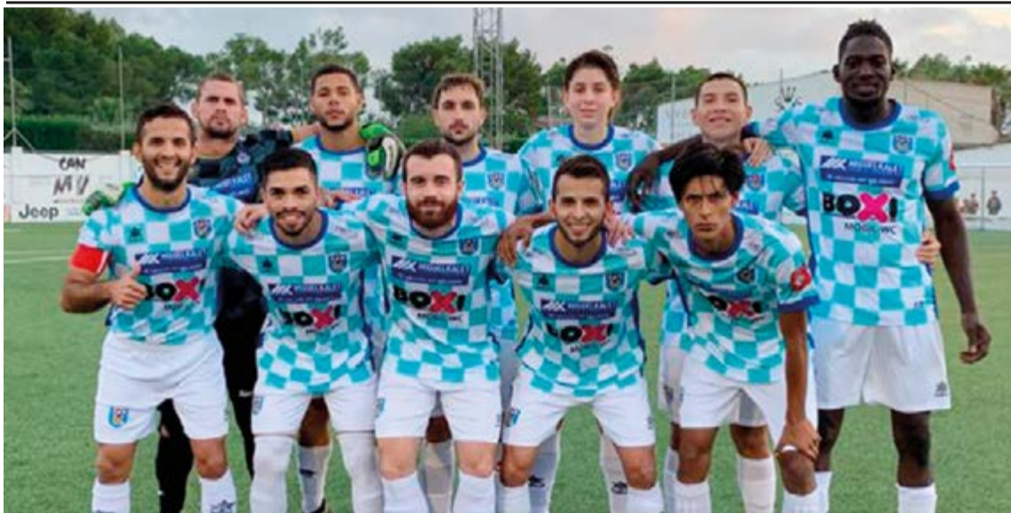
El equipo amateur masculino de primera regional prepara su partido de local frente a la Unión el próximo 23 de octubre