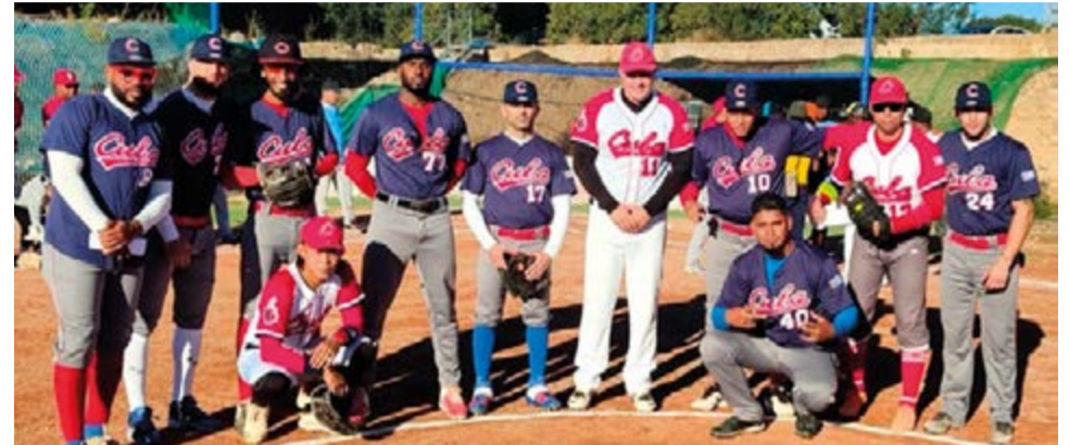
Fotos de la selección que representó a Mallorca en un torneo en Zaragoza y de un torneo organizado por la Federación de Béisbol en Baleares.