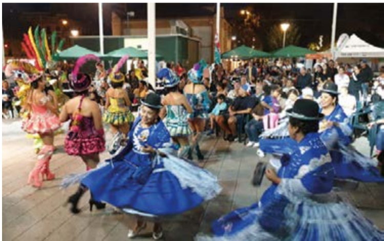
Imágenes de archivo del último aniversario de Baleares Sin Fronteras.