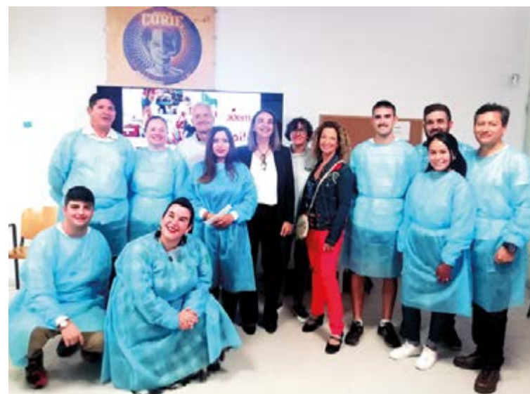
El curso del Centro de Formación Profesional ADEMA consta de 460 horas

Se trata de un certificado sanitario con el que se pretende dotar de competencias a los futuros profesionales para que colaboren en la elaboración y ejecución de planes de emergencia, además de ayudar en la organización y desarrollo de toda la logística que acompaña a una catástrofe con el