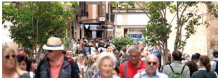
La inmigración en Baleares crecerá ostensiblemente en los próximos años.

En cualquier caso, la curva demográfica de Baleares lleva desde los años 60 en ascenso -con especial intensidad desde el año 2000- y, lo más importante, no hay visos de cambio de ten-