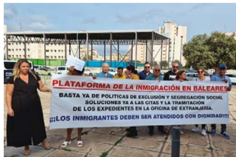
Representantes de asociaciones de inmigrantes se concentran a las afueras de Extranjería.

a la palestra otro problema: “Para hacer un trámite en extranjería le piden a la gente el certificado de antecedentes penales que caducan a los tres meses. Pero cuando extranjería resuelve ya ha pasado ese tiempo y a las personas les toca volver a hacer esta gestión, en definitiva es un sin vivir”.