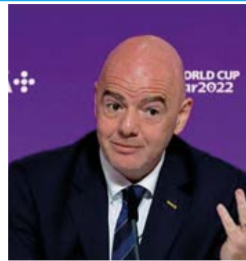
Gianni Infantino, presidente de la FIFA

También ha habido trabajadores que han perdido la vida a causa de las peligrosas condiciones de trabajo, y sus muertes rara vez se han investigado. Un estudio inter pares concluyó que las muertes de al menos 200 trabajadores de la construcción nepalíes entre 2009 y 2017 podrían haberse evitado con una protección adecuada frente al