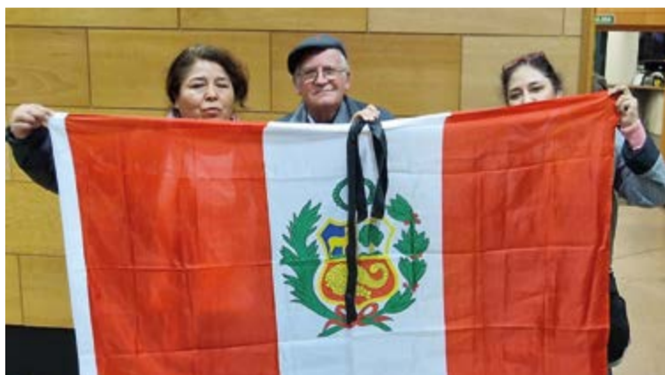
Los peruanos exhibiendo con orgullo su bandera