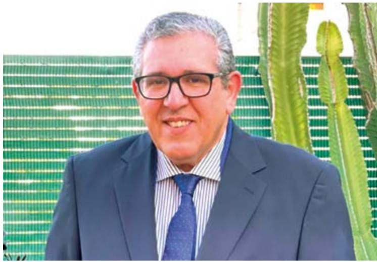
Abdellah Bidoud, Cónsul de Marruecos en Baleares.

Ante tal avance, este periódico contactó con el cónsul de