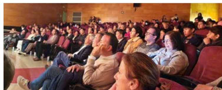
Gran presencia de público en la ONCE