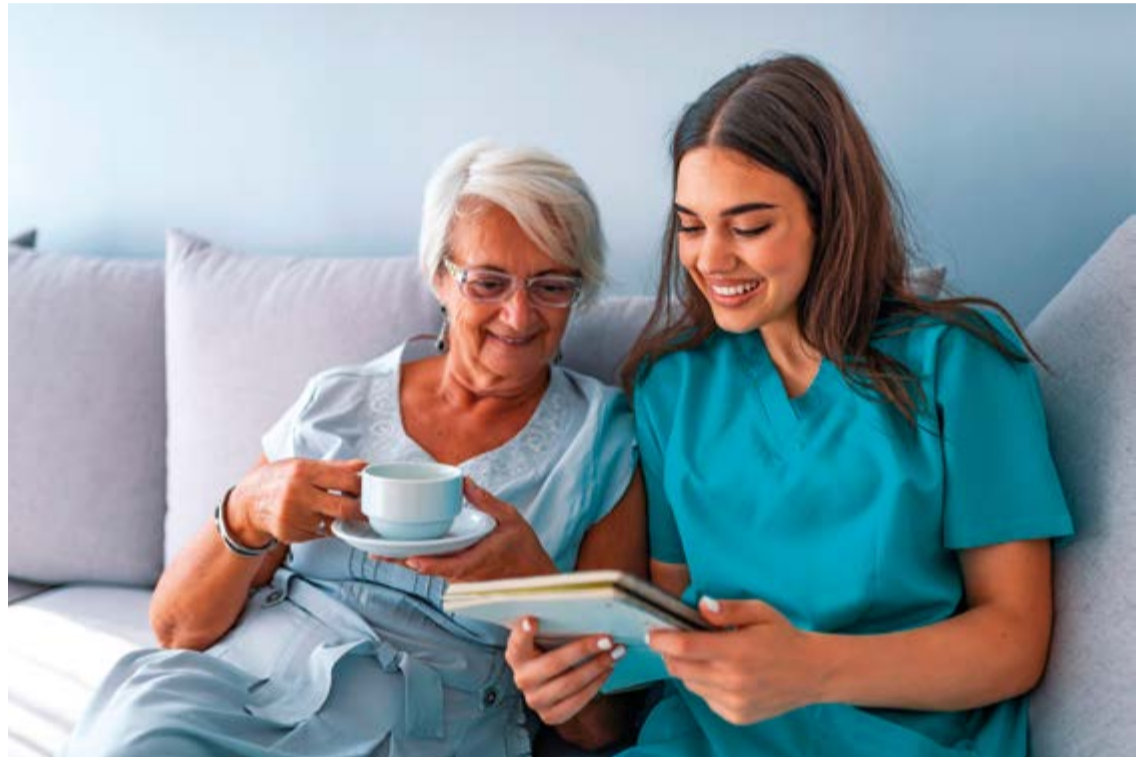
Debido al constante aumento de la expectativa de vida y envejecimiento de la población, la atención sociosanitaria domiciliaria se ha convertido en una profesión con grandes expectativas de futuro.

A lo largo de la historia se han dejado sin atender, en numerosas ocasiones, a aquellas personas que presentaban algún síntoma de "debilidad" o cierta dependencia. No obstante, en la actualidad, se hace