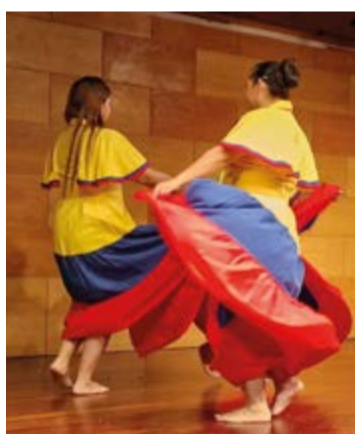
Pregón de Colombia