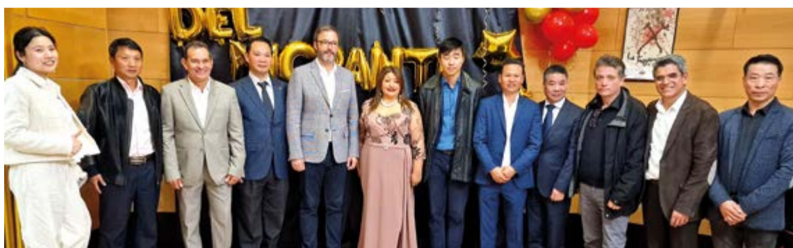
Integrantes de Achinib con las autoridades del Ayuntamiento de Palma y otros invitados