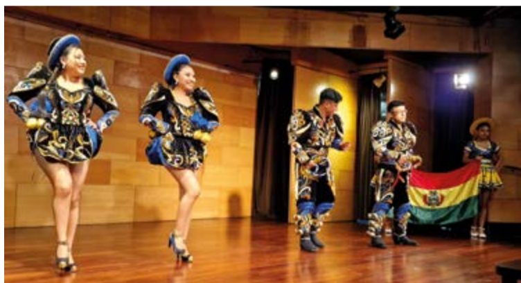
Las danzas bolivianas uno de los grupos invitados