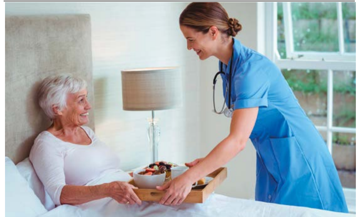
Este ámbito de formación profesional gratuita ofrece nuevas e interesantes oportunidades de empleo a trabajadores que se encuentran desempleados.