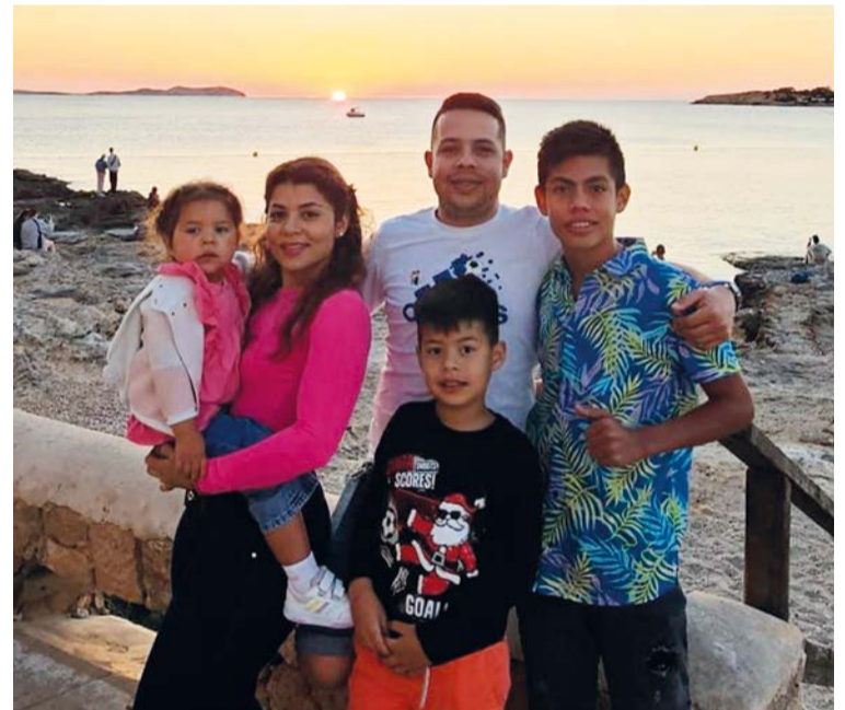
La emprendedora pareja colombiana junto a sus tres hijos

Las especialidades de la casa son la bandeja paisa, el maduro con queso, sancocho mixto, arepas rellenas, hamburguesa de patacón, desgranado, ensa-