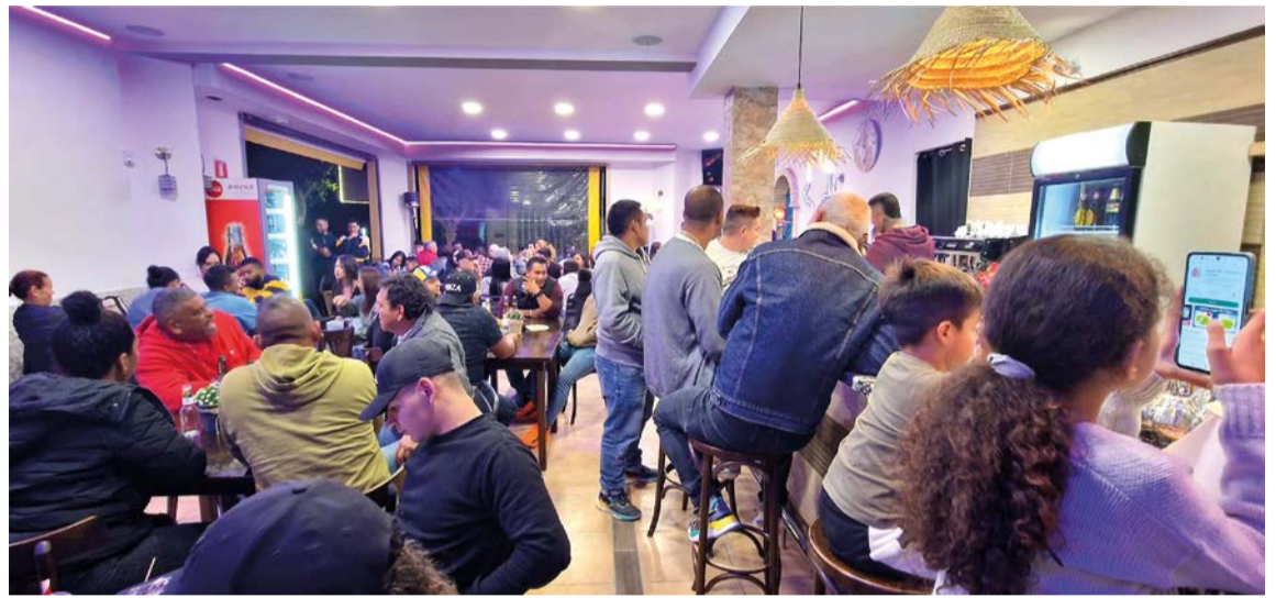
El Restaurante María Palitos, localizado en la calle Barcelona 13, Sant Antonio de Portmany