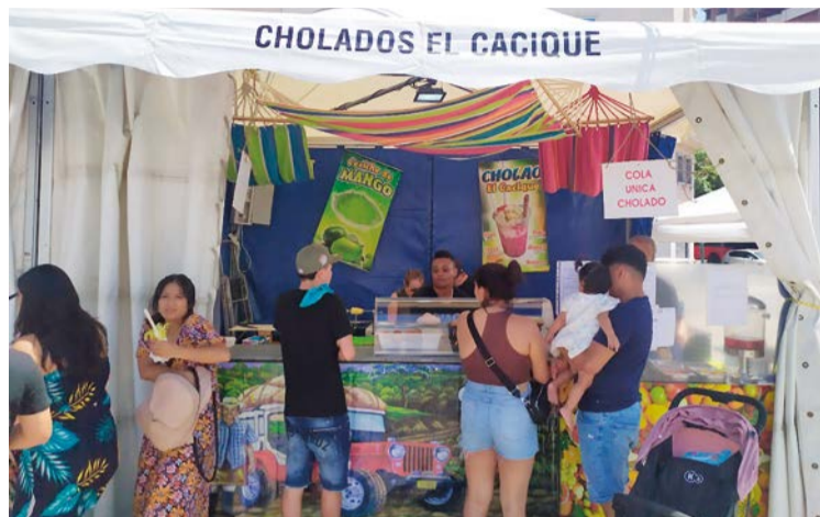
Artesanías de Colombia y Cholados El Cacique han participado en las 10 versiones de la Feria