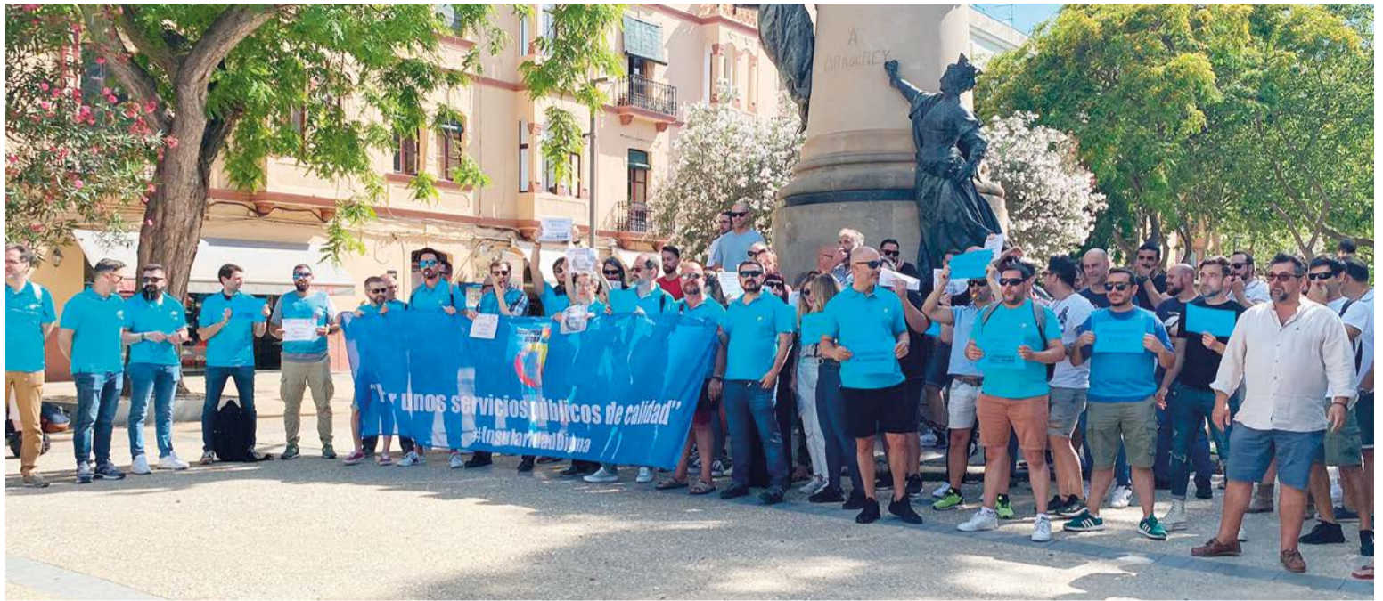
Un centenar de funcionarios se reunió en el Paseo Vara del Rey de Ibiza para protestar por la falta de trabajadores en el sector público.

El Sector Público Estatal en Illes Balears proporciona, de forma muy cercana a la ciudadanía, servicios públicos básicos que garantizan el bienestar y la seguridad de la población, en los campos de la seguridad social, SEPE, justicia, AEAT, policía nacional, guardia civil, instituciones penitenciarias, hacienda, extranjería, costas, defensa, administración