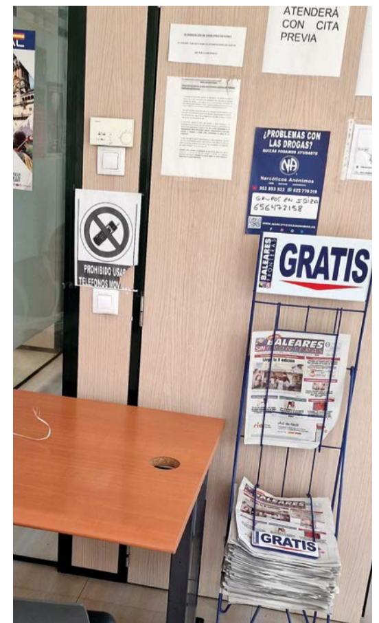
La versión papel de BSF siempre disponible en la sala de atención al público de la Policía Nacional de Ibiza.