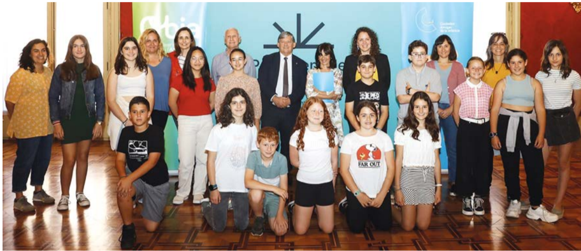
Representantes de los Consejos de Participación infantil y juvenil de Baleares

En esta ocasión, la temática se ha centrado en las propuestas que los niños, niñas y adolescentes trasladaron durante la celebración del