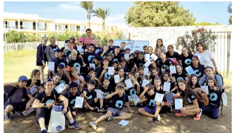
Regresa la gincana para la Igualdad del proyecto ONA

Algunos de ellos repiten fruto del éxito y el entusiasmo que despierta esta actividad entre los y las estudiantes de primaria, que disfrutaron de la actividad física en un entorno natural como es el parque de Sa Sivina de Punta Prima a la vez que aprenden jugando valores tan importantes en el deporte y en la vida ●