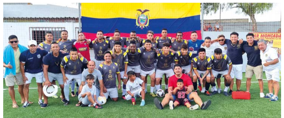
Selección de Ecuador