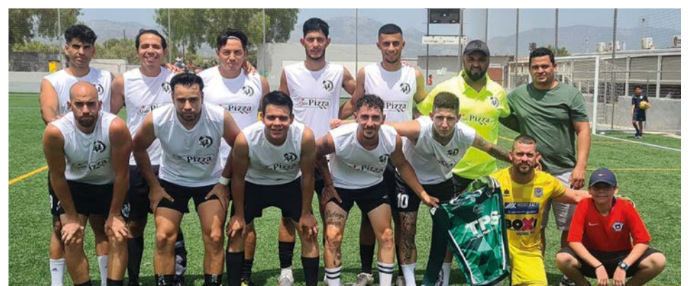
Selección Resto del Mundo