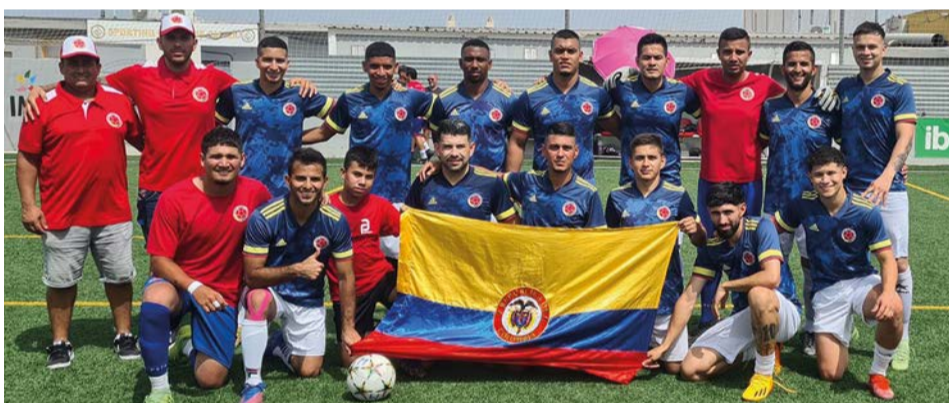
Selección de Colombia