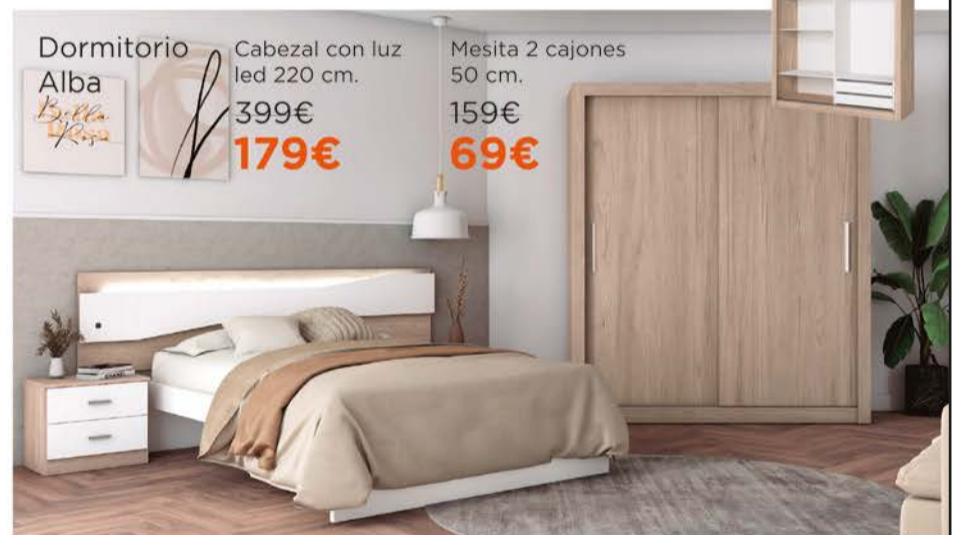
Dormitorio Alba Bella Rosa