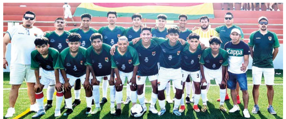
Selección de Bolivia