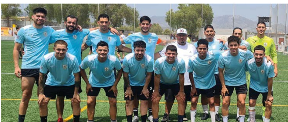
Selección de Uruguay