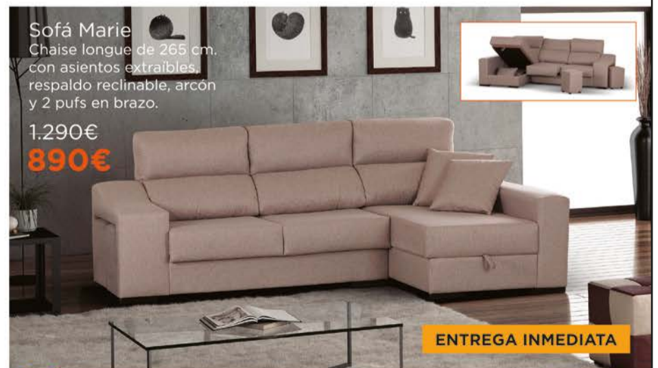
Sofá Marie Chaise longue de 265 cm. con asientos extraíbles, respaldo reclinable, arcón y 2 pufs en brazo.