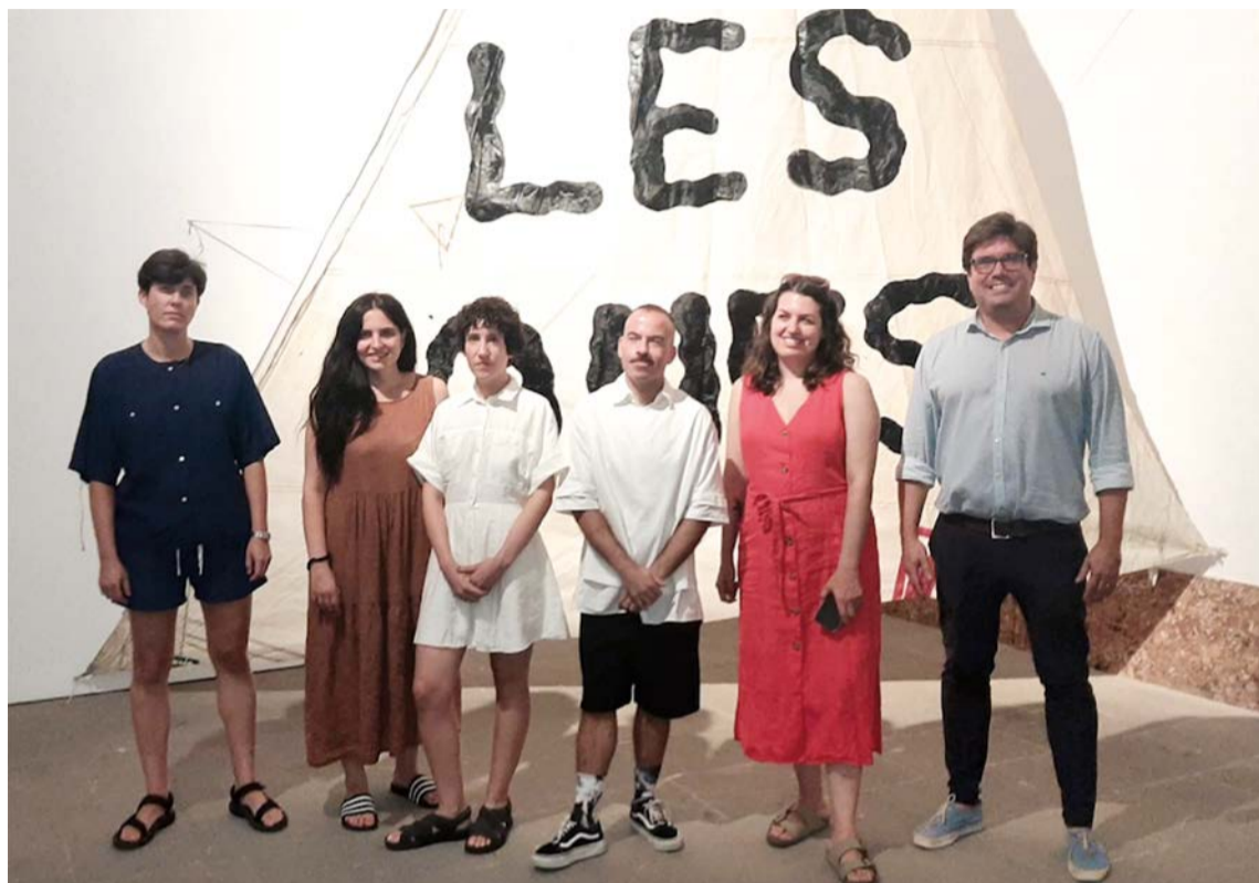
Algunas de las artistas de la muestra dirigida por Fernando Gómez de la Cuesta y comisariada por Jesús Alcaide

donde se conjugan propuestas en cuyos trabajos se pueden establecer diferentes conexiones entre la producción artística contemporánea y el territorio de lo acuático, el mar, la liquidez, los fluidos y el paisaje fluvial, así como con el modo con el que el pensamiento