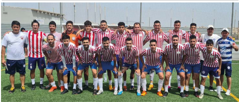
Selección de Paraguay