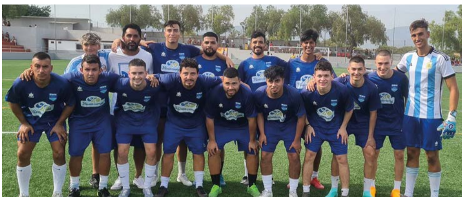
Selección de Argentina

En la competición sub-50, España jugará contra Colombia por el título y Resto del Mundo y Perú definirán el tercer y cuarto puesto ●