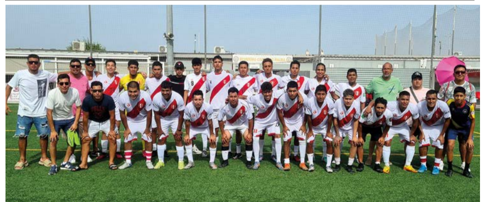
Selección de Perú