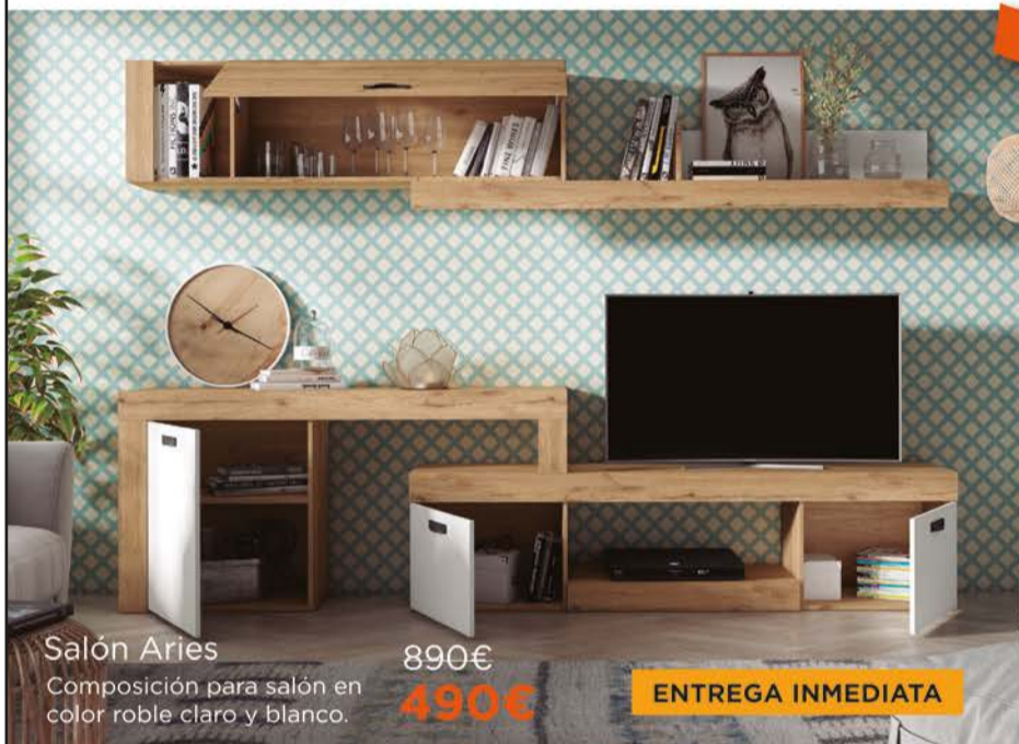
Salón Aries Composición para salón en color roble claro y blanco.