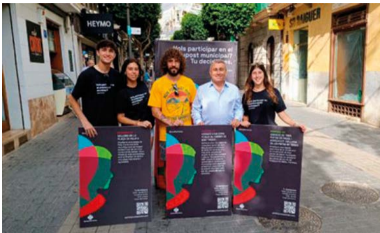
El alcalde de Inca, Virgilio Moreno