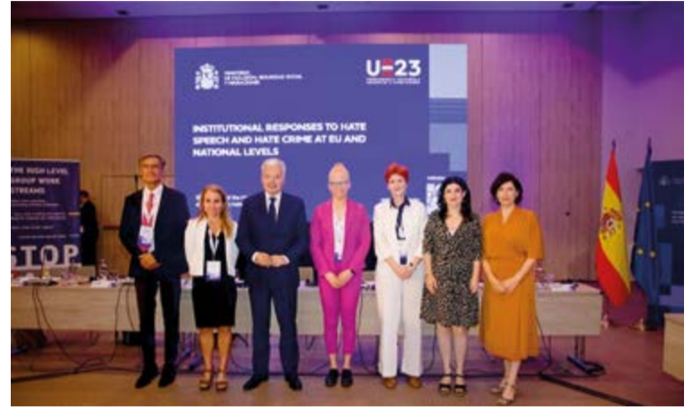
El Grupo de Alto Nivel de la UE sobre la lucha contra la incitación al odio y los delitos de odio se reúne en Madrid durante dos días

Estas personas han sido pre-seleccionadas en colaboración con el Alto Comisionado de Naciones Unidas para Refugiados (ACNUR),