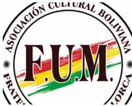
Asoc. Cultural Boliviana Fraternidades Unidas de Mallorca.