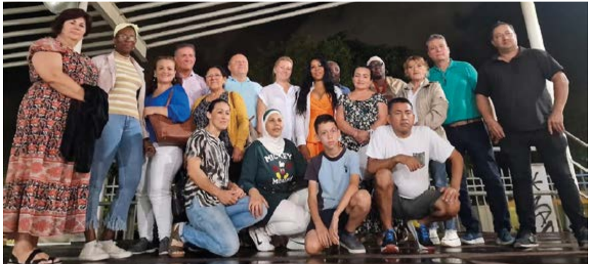
Algunos de los feriantes y representantes de asociaciones que intervendrán en la Feria Intercultural.