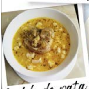
Caldo de pata