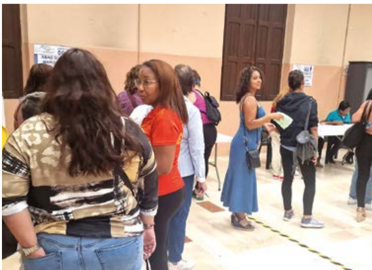
Un porcentaje de la comunidad ecuatoriana acudió a depositar su voto. En las imágenes: jurados de dos mesas y familias ecuatorianas presentes en el recinto electoral.