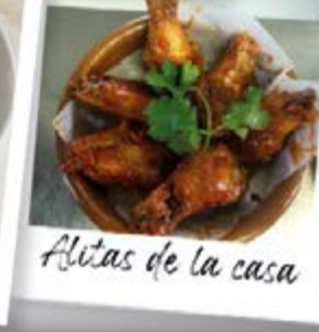
Aletas de la casa

Venga y disfrute de los succulentos platos elaborados con el delicioso sabor ecuatoriano de CA NA YOLI