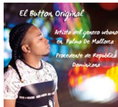
El Button Original.