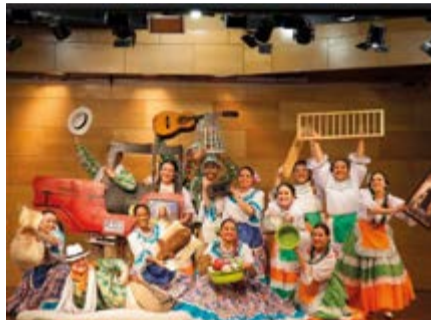
Pregón de Colombia.