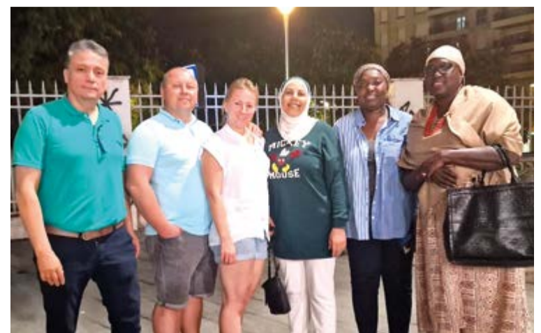
Ucrania, Senegal y Siria tendrán representantes en la Fira de Inca.