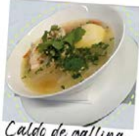
Caldo de gallina campesina