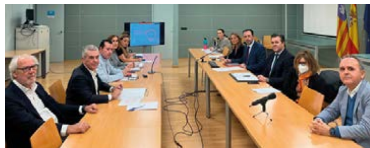
Durante 2024 el Govern seguirá luchando contra el fraude por contratación irregular de empleados mediante una campaña de inspección de trabajo.

En cuanto a la planificación de las principales acciones diseñadas para el año 2024, la Conselleria de Empresa, Empleo y Energía ha proyec-