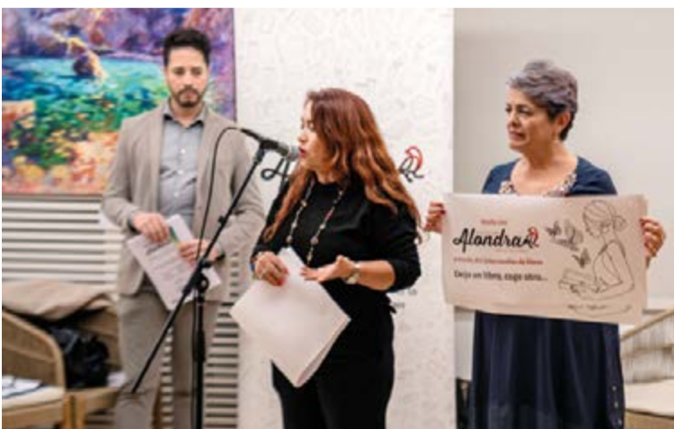
Al segundo aniversario de la Asociación Alondra fueron invitados artistas músicos y representantes políticos. El evento se realizó en el Hotel Saratoga de Palma.