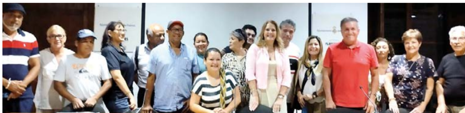
Desde hace cuatro meses, el área de Interculturalidad planifica nuevas acciones de trabajo con vistas a 2024.