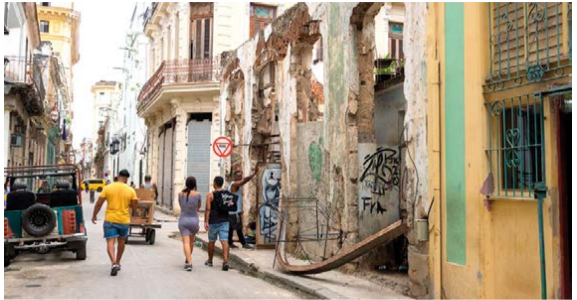
Cuba. País pobre de América latina

Seguiremos, tal vez, luchando contra molinos de viento, aun cuando el refuerzo de