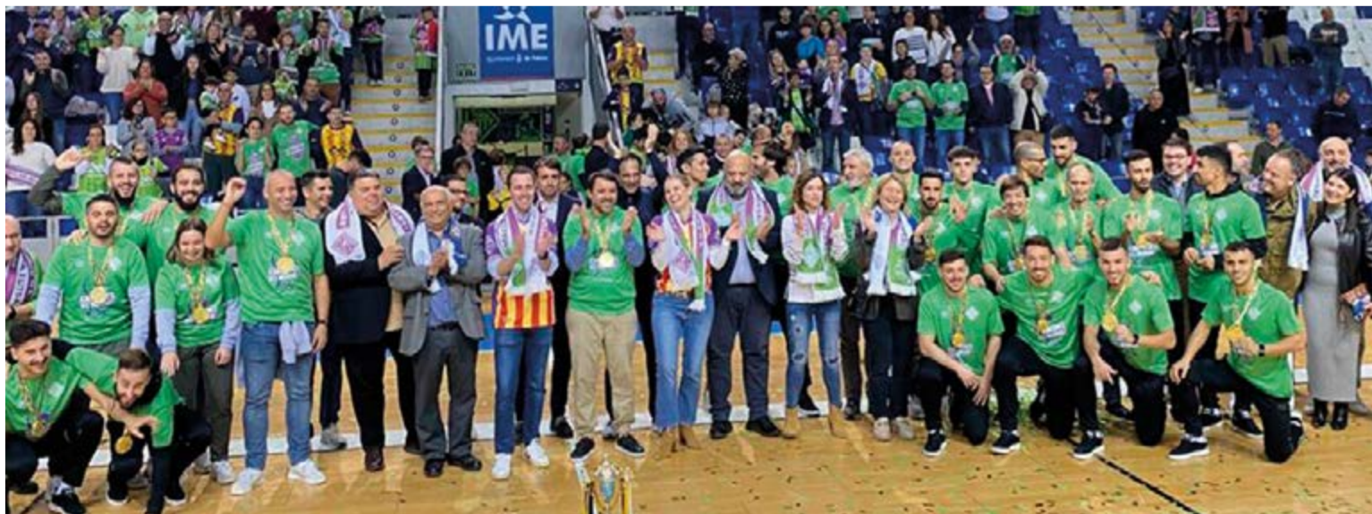
El Mallorca Palma Futsal realizó una brillante temporada en 2023