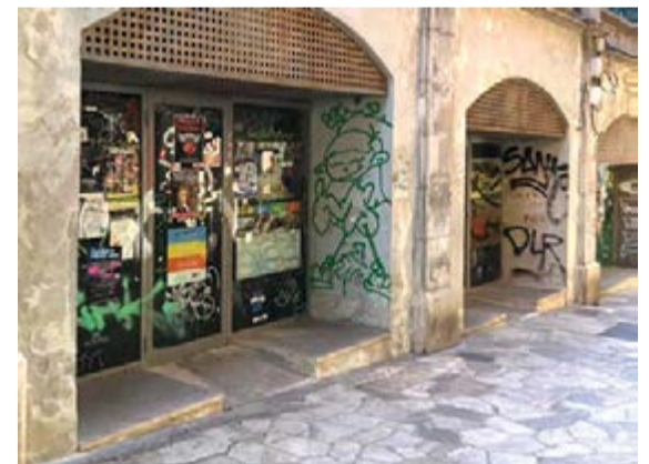
Imágenes del pulcro estado actual recuperado y, al final, de las vandálicas e incívicas pintadas que habían estado afectando patrimonio municipal de alto valor histórico.