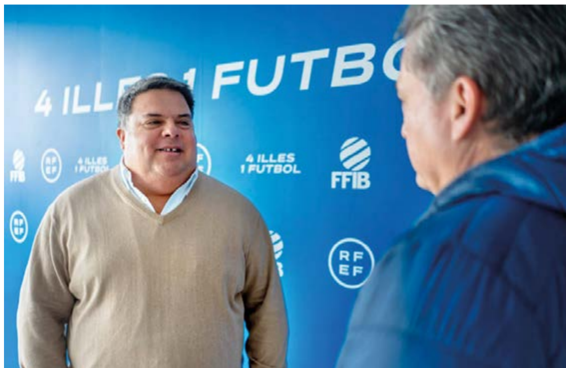
Estuvimos entrevistando al presidente de la FFIB en sede de Son Malferit.

Ya no solo se está haciendo un trabajo desde el ámbito social, ahora ya también con los excelentes resultados depor-