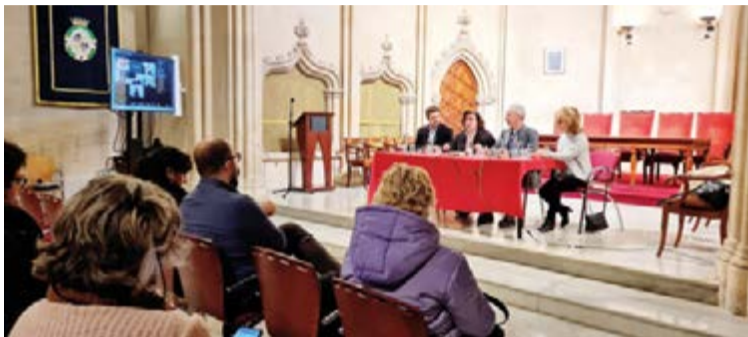
Reunión de la conselleria de asuntos sociales