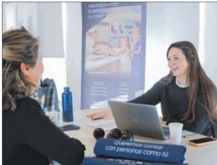
PalmaActiva apoya al empresariado y a potenciales trabajadores fomentando el empleo a través de sus convocatorias.

PalmaActiva continúa impulsando nuevas oportunidades laborales con la organización de próximas jornadas de selección previstas para el mes de abril, en las que se ofrecerán cerca de 40 puestos de trabajo: