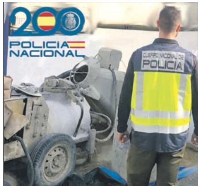
La UCRIF, Policía Nacional en un operativo en Manacor con trabajadores en situación irregular.

bajo conjunto y coordinado que se viene realizando por parte de la Policía Nacional y la Inspección de Trabajo de la Seguridad Social en la lucha contra el trabajo irregular, los derechos de los trabajadores y la competencia desleal que representan las empresas que no cumplen con la legalidad.