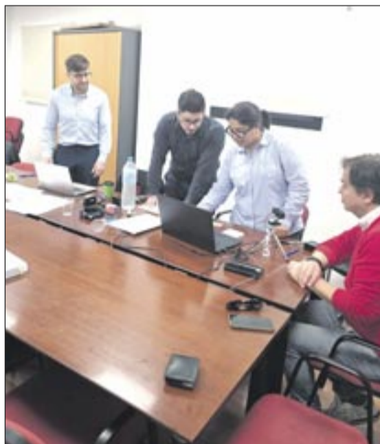
Un consulado de Uruguay estuvo con funcionarios de Barcelona atendiendo a sus connacionales en el Casal de Inmigrantes de Palma.