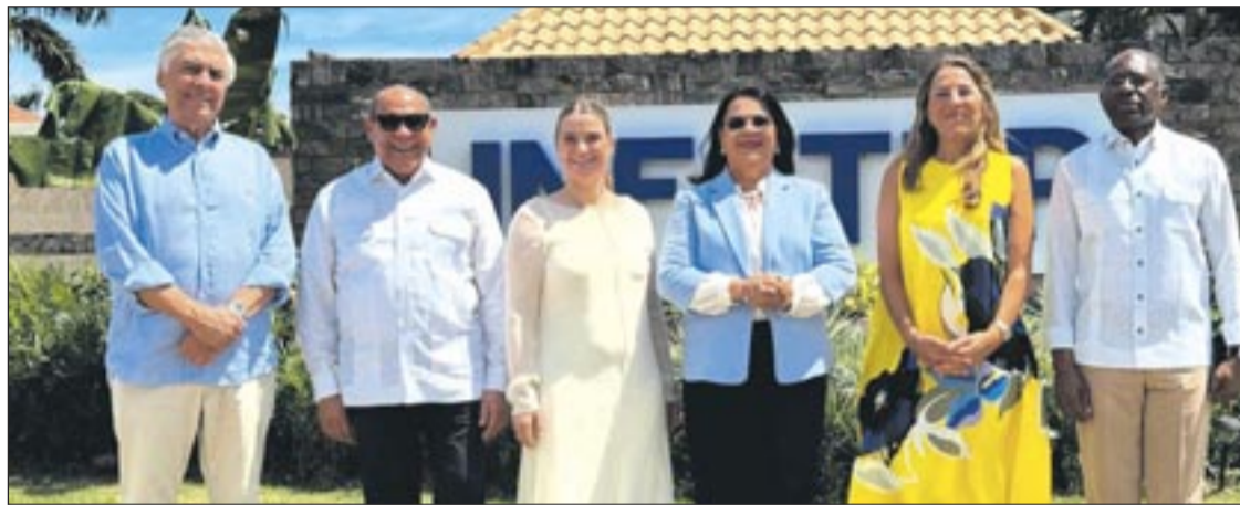
La presidenta del Govern balear ha visitado el Instituto Nacional de Formación Técnico Profesional de República Dominicana, centro que participa en el convenio firmado con la Escuela de Hostelería de las Illes Balears (EHIB).

La presidenta del Govern de les Illes Balears, Marga Prohens , ha visitado el Instituto Nacional de Formación Técnico Profesional de República Dominicana (INFOTEP), centro que participa en el convenio firmado con la Escuela de Hostelería de las Illes Balears (EHIB). Se trata de un acuerdo estratégico destinado al intercambio de conocimientos y a la excelencia en la formación turística, firmado en el marco de la Feria Internacional de Turismo de Madrid (Fitur).