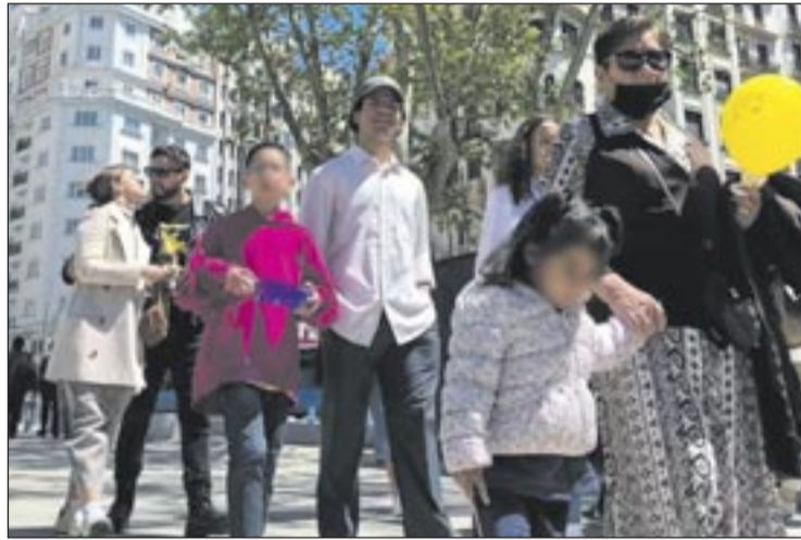
El Ayuntamiento de Palma condenó los insultos y comentarios xenófobos sufridos hacia un grupo de estudiantes de origen alemán en un trayecto en autobús entre Valldemossa y Palma.