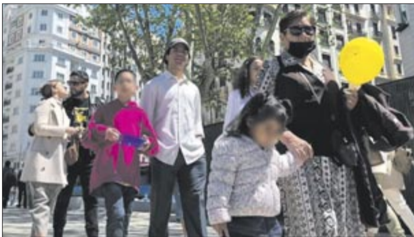
El Ministerio de Migraciones contabilizó 13.500 solicitudes telemáticas en el primer día del proceso de regularización extraordinaria.

Todas estas solicitudes se han presentado mediante certificado digital, y la mayoría se han registrado por par-