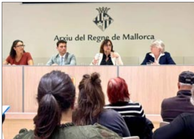
La vicepresidenta y consellera Estarellas ha presentado el documento en el Pleno del Consejo Asesor para la Integración de las Personas Migrantes desde diversas perspectivas sociales.