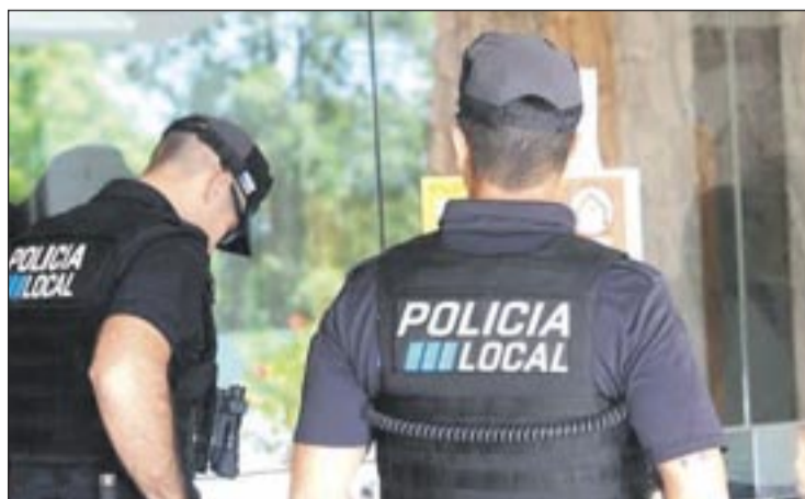
Ejemplarizantes sanciones del Ayuntamiento, entre ellas las actuaciones policiales para luchar en Eivissa contra los alquileres ilegales de viviendas.

En las otras actuaciones para fomentar la vivienda, destaca la propuesta del cambio de inmuebles de uso de locales para convertirlos en viviendas; un incentivo de bonificación de hasta un 90% por ciento en tasas urbanísticas para constructores que edifiquen en VPO; estudios de nuevos solares para la construcción de más viviendas