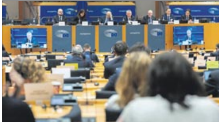
Comisión Parlamento Europeo.

Uno de los aspectos más controvertidos del acuerdo es la posibilidad de establecer cen-