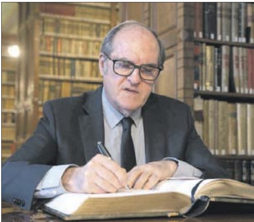
Ángel Gabilondo, Defensor del Pueblo

propone que, cuando una persona migrante informe de que ha iniciado los trámites de regularización y presente la documentación correspondiente, los agentes verifiquen esa información antes de poner en marcha cualquier procedimiento de expulsión.