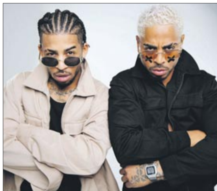
Dos hermanos cubanos, residentes sobresalen en Mallorca por su interpretación de género urbano.

que aquí también hay talento. Mallorca tiene artistas muy duros y queremos abrir más puertas para todos.