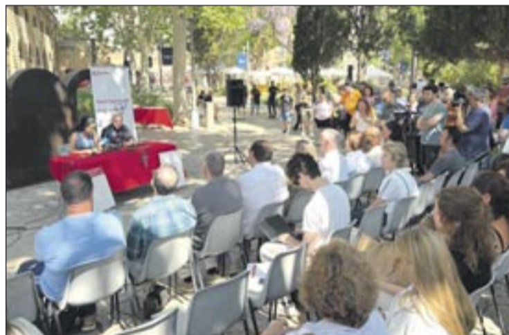
La Semana de la Caridad, incluye está bajo el lema «Elige amar. Elige comunidad», la programación incluye conferencias, talleres, exposiciones, actividades participativas, celebraciones litúrgicas y propuestas culturales.