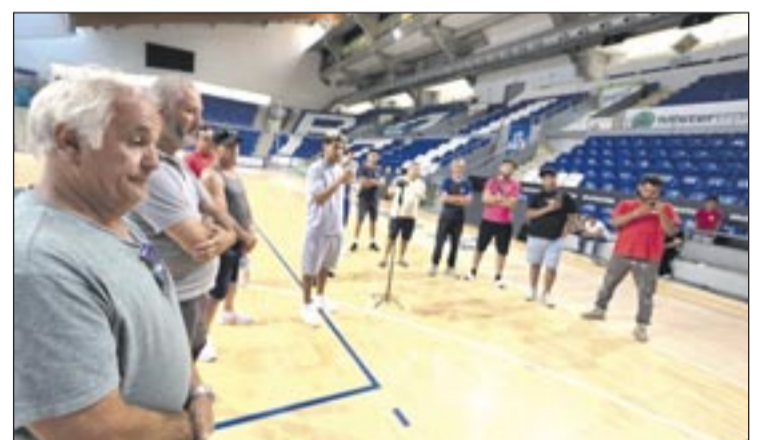
Los niños fueron los protagonistas durante el sorteo que se realizó en el pabellón de Son Moix, que fue testigo de la conformación de los tres grupos que durante un mes determinará cuál será la selección campeona de esta versión 2026.