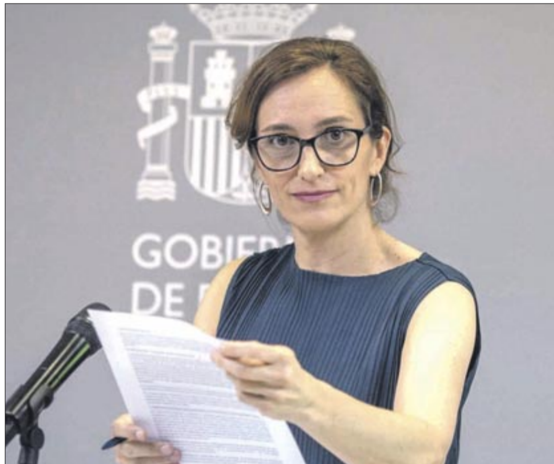
La ministra de Sanidad, Mónica García

El informe también identifica ámbitos en los que la situación de salud es muy similar entre los distintos grupos analizados. Es el caso del infarto agudo de miocardio, con una tasa de 8,7 por mil en personas nacidas en España frente a 8,8 en las procedentes de la Unión Europea, así como de la hipertensión no complicada, que presenta cifras prácticamente equivalentes entre la población autóctona (172,2) y la originaria de África